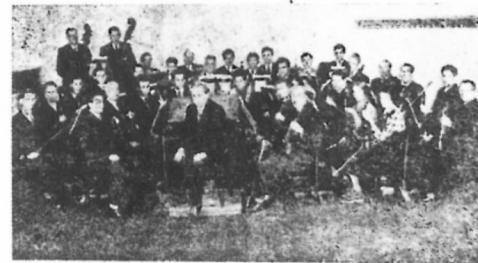
Na jedne probe Gradskog simfonijskog orkestra

dno vrijeme, pa prema tome manje griješke ne možemo i ne smijemo tako strogo ocjenjivati. Pohvalno je da naše narodne vlasti daju punu podršku unapređivanju glazbenog amaterizma, koji ako se ozbiljno i savjesno gaji može dati isto tako vrijedne priloge muzičkoj kulturi kao i glazbeni profesionalizam, a za koji amaterizam imamo svjetle i neumrlje primjere i u historiji glazbe. Marljivim studijem i vježbanjem bit će sigurno i ovi nedostaci u orkestru uklonjeni a zato daje garanciju visokog muzičko obrazovanje i kultura samoga dirigenta.