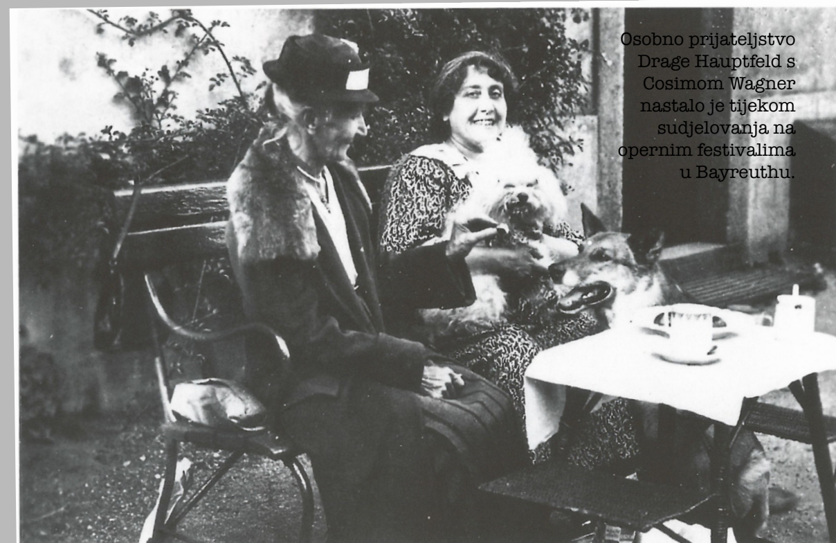
Osobno prijateljstvo Drage Hauptfeld s Cosimom Wagner nastalo je tijekom sudjelovanja na opernim festivalima u Bayreuthu.

“Mnogi poznati umjetnici i skladatelji surađivali su s Glazbenom školom. Posjećivali su je Vatroslav Lisinski i Ivan Zajc.”