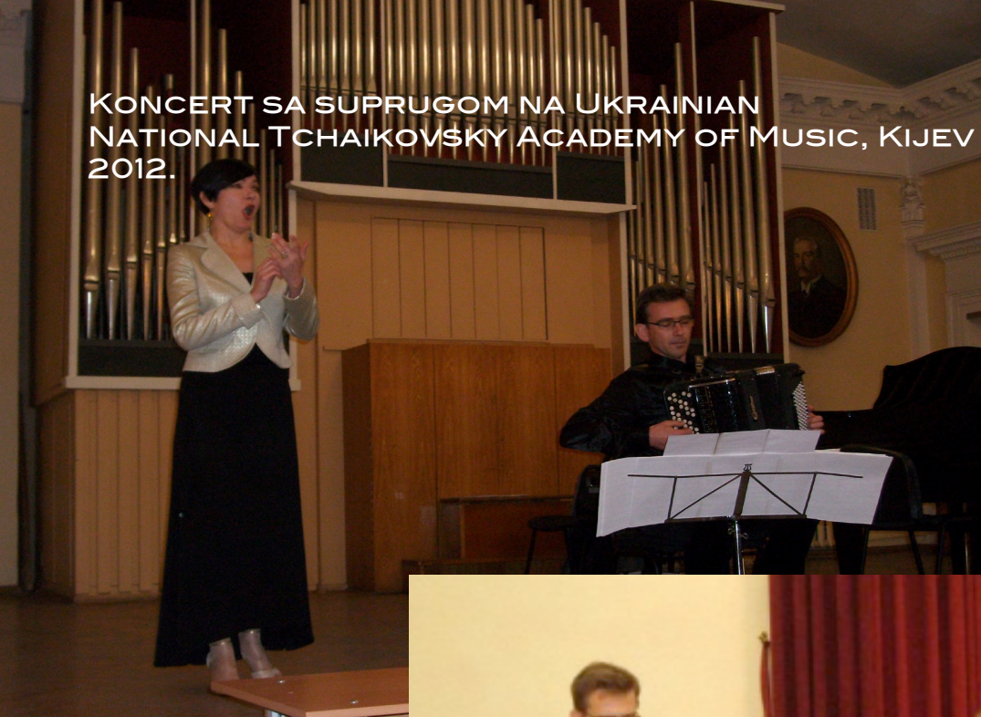
KONCERT SA SUPRUGOM NA UKRAINIAN NATIONAL TCHAIKOVSKY ACADEMY OF MUSIC, KIJEV 2012.