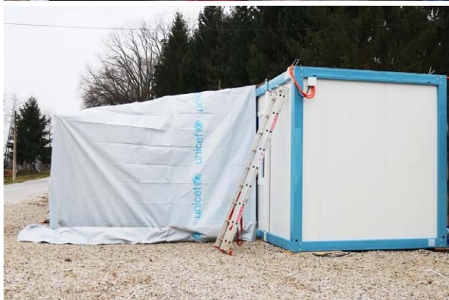
SLIKA 8. U razgovoru s obitelji koja je primila UNICEF-ove cerade.