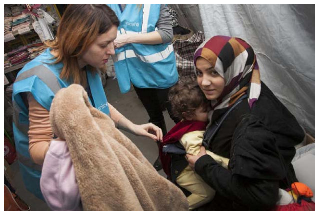
SLIKA 7. Centar za pomoć majkama i bebama izbjeglicama

nuo kampanju „Zajedno protiv koronavirusa“. Cilj nam je bio pružiti podršku zdravstvenom i obrazovnom sustavu te osigurati zaštitu djece i obitelji. Već krajem ožujka, unatoč velikim izazovima u osiguravanju dovoljnih količina zaštitne opreme u cijelom svijetu, uspjeli smo u Hrvatsku dopremiti četiri tone profesionalne zaštitne opreme. Pandemija koronavirusa školske je aktivnosti preselila u online okruženje. Poseban je to izazov za obitelji s djecom koja nemaju informatičku opremu i pristup internetu za pohađanje škole na daljinu.