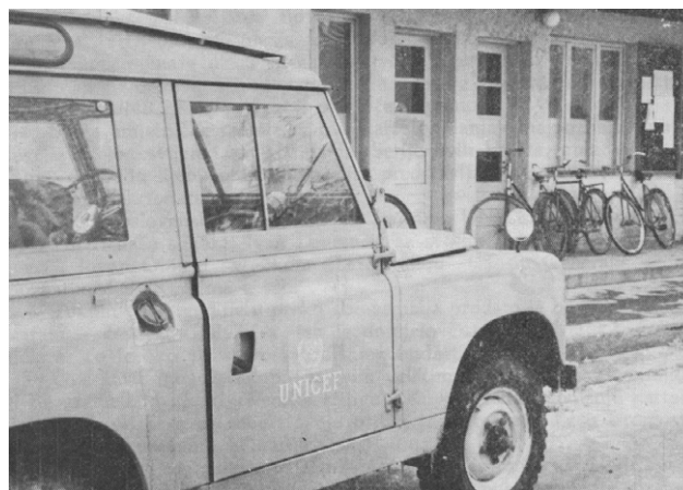
SLIKA 4. Stotine automobila i bicikala UNICEF je donirao kako bi zdravstveni djelatnici mogli doći do svakog djeteta i obitelji.

naobrazba bila što kvalitetnija, škole za primalje i medicinske sestre postale su četverogodišnje srednje škole za koje je UNICEF osigurao opremu. Osigurani su i oprema, lijekovi, doškolovanje kadrova u inozemstvu za 36 dispanzera za majke i djecu, desetke laboratorija, školskih ambulanti, a otvoreno je i 101 savjetovanište za žene i djecu.