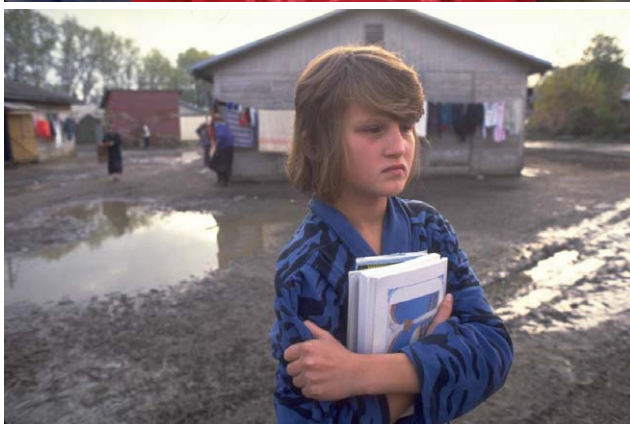
SLIKA 5. Za vrijeme Domovinskog rata UNICEF je pružao psihosocijalnu podršku djeci i osiguravao higijenske i druge potrepštine. Nakon rata aktivno smo educirali djecu u školama o zaštiti od mina i eksplozivnih sredstava zaostalih nakon rata.

Pokazali smo to i nakon poplava koje su pogodile našu zemlju u svibnju 2014. godine. Nakon dostave hitnih potrepština UNICEF je kroz dvije godine podržavao rad neformalnog vrtića u Gunji. To se pokazalo iznimno važnim za djecu i roditelje nakon poplava, jer su se djeca lakše oporavljala od trauma, nastavljala su svoj odgojno-obrazovni put i bila su manje izložena stresu, a roditelji su se mogli posvetiti rješavanju pitanja smještaja i obnove kuća.