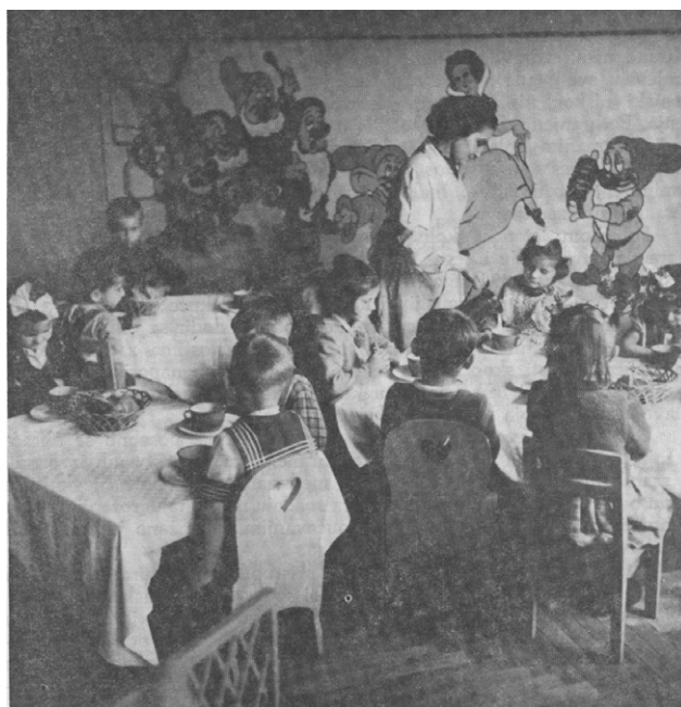
SLIKA 2. UNICEF je podržao i otvaranje školskih kuhinja diljem zemlje, a mnogoj djeci je besplatan obrok u školi bio jedini u danu.

Zagrebu, Rijeci i Splitu, a kasnije i tvornice za proizvodnju mlijeka u prahu u Osijeku i Županji. UNICEF je osigurao najmodernije strojeve za proizvodnju pasteriziranog mlijeka i pomogao da se educiraju radnici. Trajno mlijeko moglo se jednostavno transportirati u sve krajeve zemlje kako bi se nahranila gladna dječja usta. Mlijeko se besplatno dijelilo u školama, a brojnoj djeci to je bio jedini obrok u danu. Mnogi se i danas sjećaju dvopeka, kolutova žutog sira, okusa gorkog ribljeg ulja, ali i prve čokolade! Sve je to bilo u UNICEF-ovim paketima pomoći.