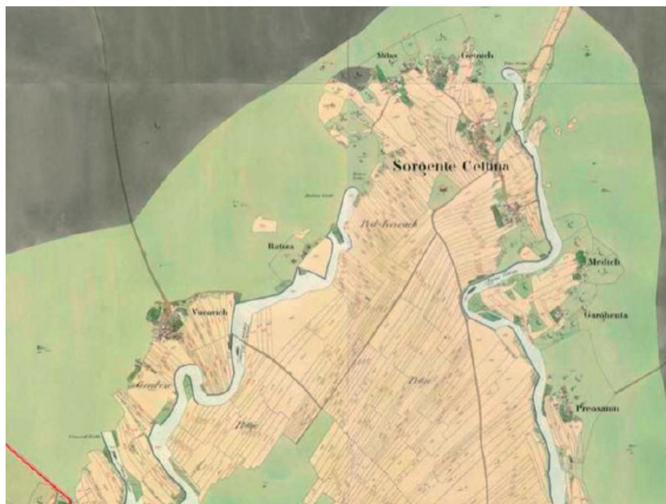
Slika 7. Habsburška Monarhija – Katastarska izmjera (XIX. stoljeće).