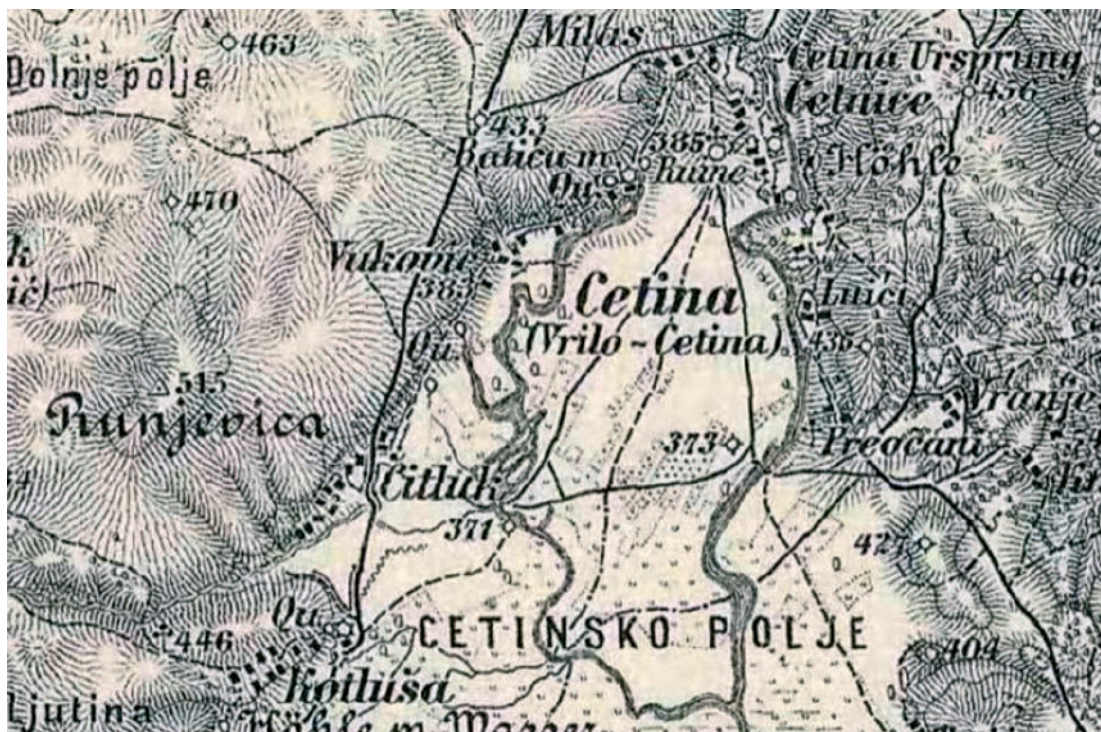
Slika 6. Habsburška Monarhija (1869. –1887.) – Treća vojna izmjera (1 : 75 000).