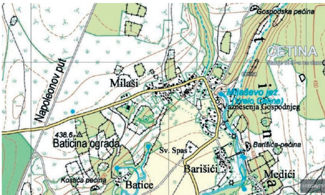
Slika 9. Topografska karta Republike Hrvatske (1 : 25 000).