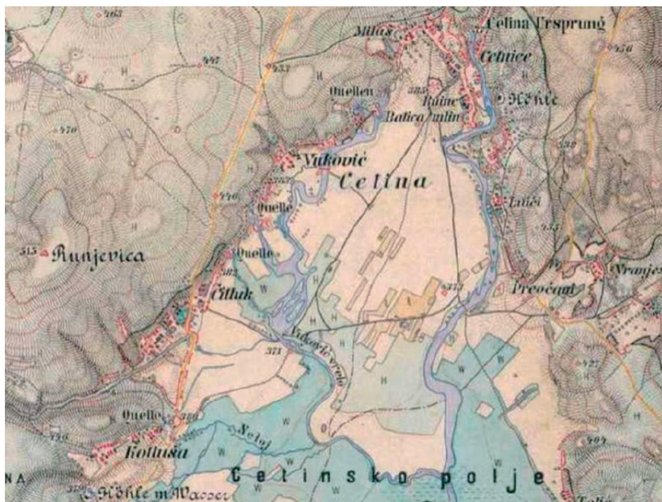
Slika 5. Habsburška Monarhija (1869. –1887.) – Treća vojna izmjera (1 : 25 000).