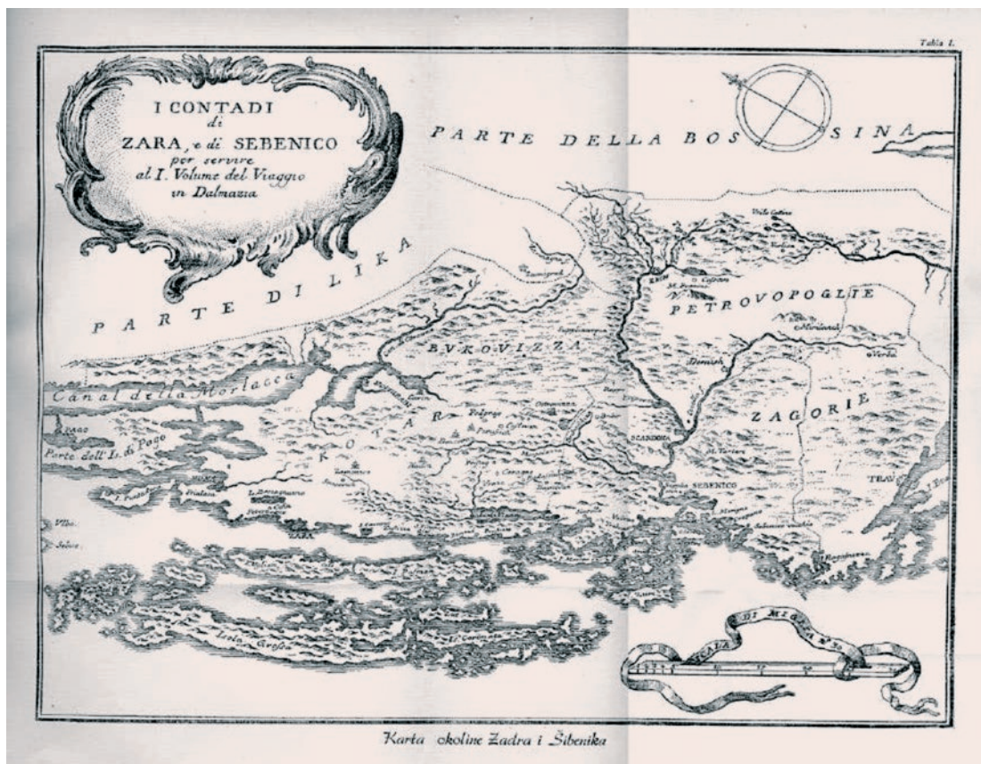
Slika 3. Kartografski prilog u knjizi Ivana Lovrića „Bilješke o putu po Dalmaciji“ iz 1776. g.

Konačno, prikupljeni su i podaci o lokalnim imenima izvora koja se koriste u selu Cetina te okolnim naseljima (Civljane, Kijevo, Vrlika). Nitko od intervjuiranih sugovornika ne koristi naziv Glavaš za izvor Cetine, već taj toponim poistovjećuju s obližnjim selom Glavaš koje se nalazi ispod Dinare, između Kijeva i Uništa. Korišteni i uvriježeni nazivi koje stanovništvo koristi su Veliko vrela/vrilo i Milaševo vrela.