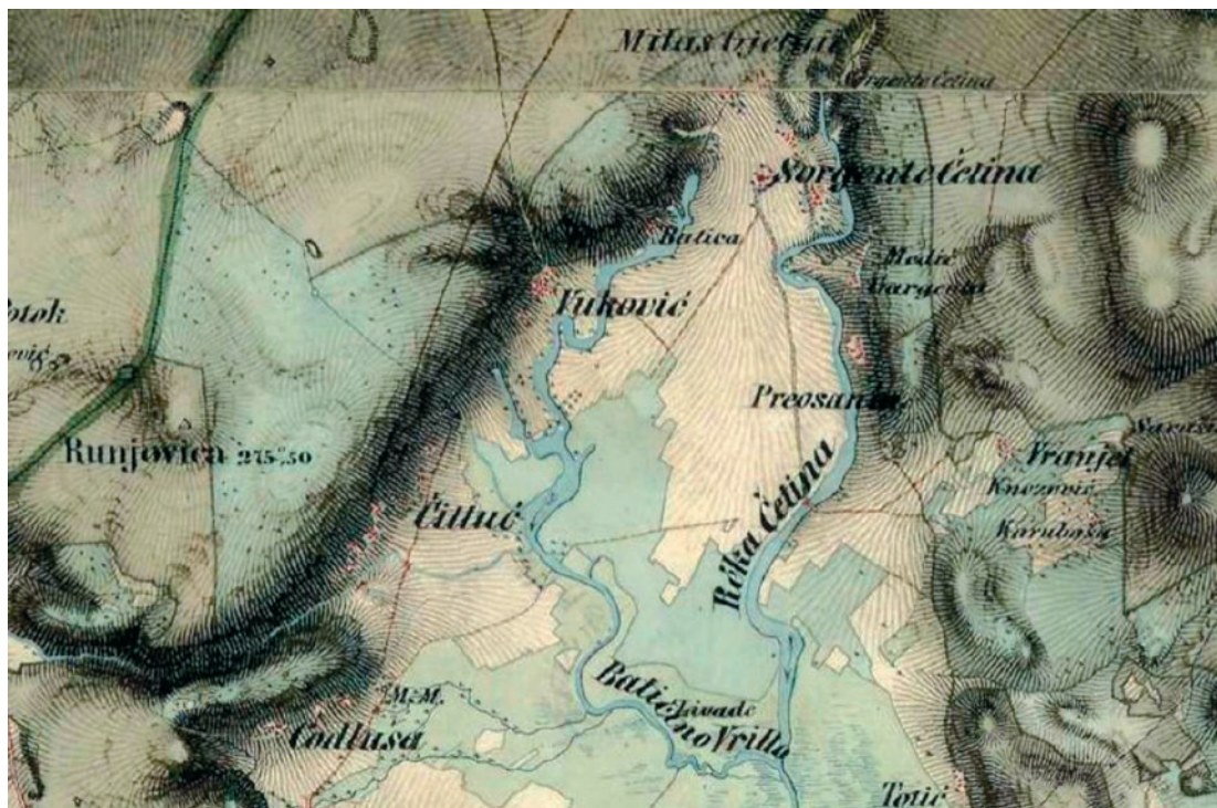
Slika 4. Dalmacija (1851. –1854.) – Druga vojna izmjera Habsburške Monarhije.