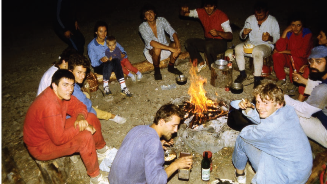
Logor u Klepinoj dulibi 1986.

prepričava. O strahovima u speleologiji Šišmiš kaže da ih baš i nema, ali prisjetio se nekih situacija u kojima se možda trebao više bojati.