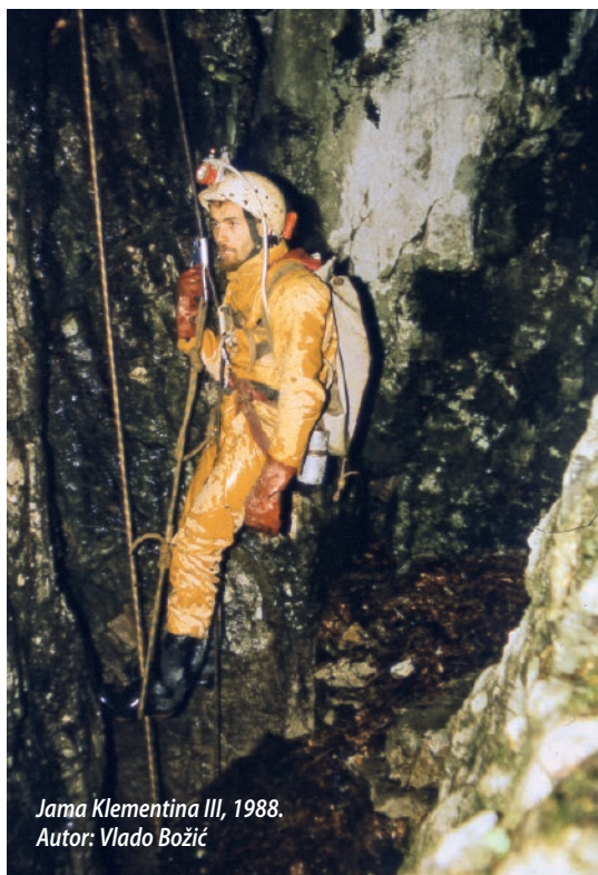
Jama Klementina III, 1988. Autor: Vlado Božić

„Mi smo ulazili bez ičega unutra, pa nas je više puta iznenadila voda. Imali smo paniku izać van jer je na ulazu bio 12-metarski slap, i tako tri puta. Onda smo zabili spit i postavili si špagu da se imamo za šta primit. Išli smo u Strmotićku zimi, a ulazili ujutro i bili unutra tijekom dana, umjesto da smo po noći bili unutra. To naučiš s iskustvom: kad je vani snijeg, onda se radi po noći, a po danu si vani. Jer se sve zaleđi i unutra nema vode.“ Povremeno tijekom razgovora, najčešće usred neke opasne ili nepromišljene priče Šišmiš bi se dosjetio korisnih speleoloških „trikova“ poput ovog. Naravno, tako mladi i željni izazova i ispitivanja vlastitih granica, Makina i Šišmiš okušali su se i u speleoronjenju, ali na svoj način. Tako se doživljaji iz Strmotića ponora nastavljaju: „Jednom