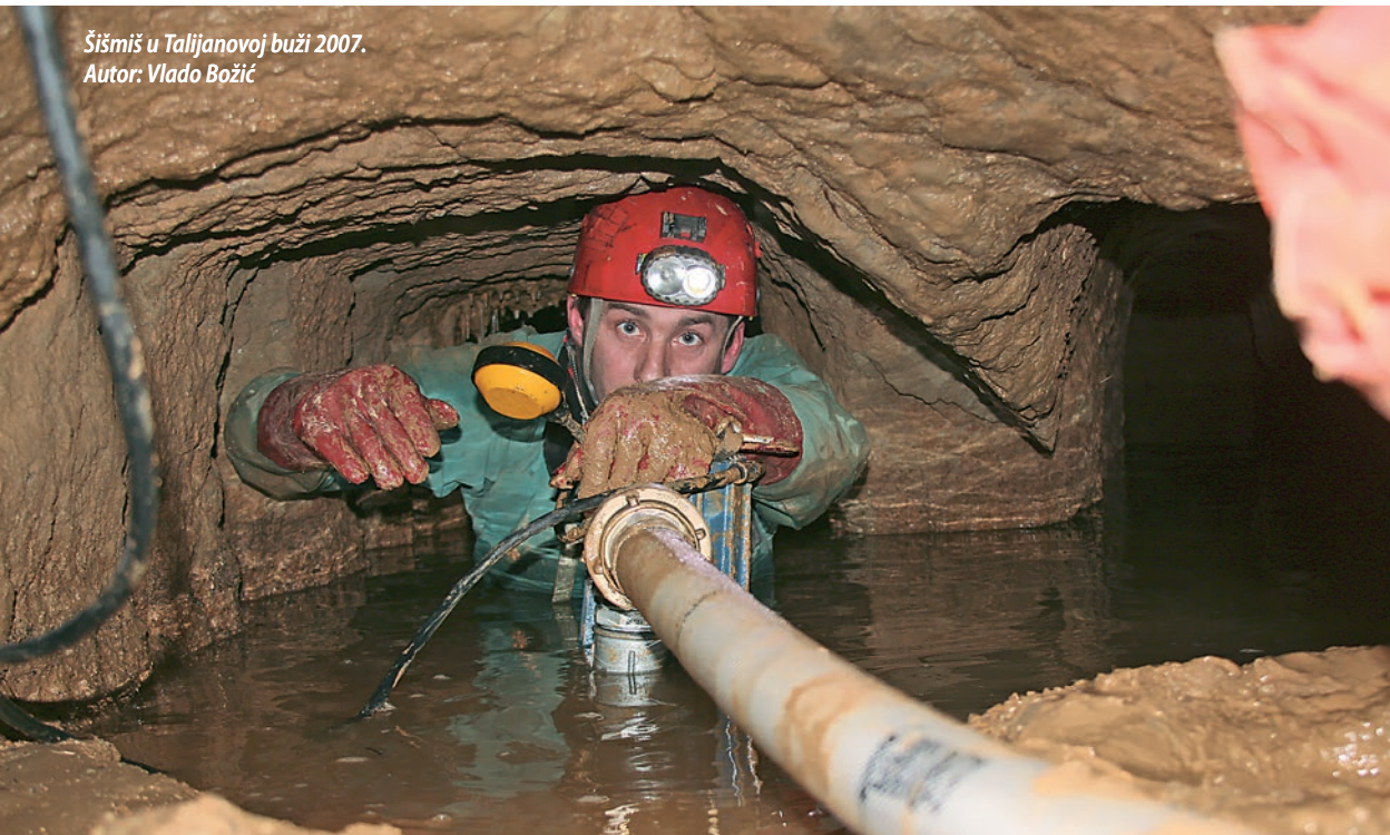
Šišmiš u Talijanovoj buži 2007.

„Dali su nam lokaciju, i Anđelko Novosel i još netko prvi su išli tamo. Došli su do visoke police, bacili kamen i zaključili da jama ide dalje. To ljeto su napravili ekspediciju s gomilom ljudi, a Bančo je bio vođa. Ja sam tada šljakao i nisam mogao dobit godišnji. I bio sam lud, čuo sam da su došli do 750 metara, 950 metara. Zadnja informacija je bila da su došli na 1100 metara. A ja lud ko pračka, ne daju mi ni dan godišnjeg. I onda sam dogovorio da me u petak nakon posla dofuraju gore. Došao sam u noć,