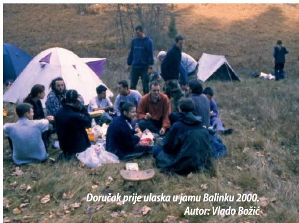
Doručak prije ulaska u jamu Balinku 2000.

je Bančo išao ronit u sifon na kraju. To je jezerce metar i pol široko, 5 metara dugačko, duboko 3 metra, i dolje je rupa duga 3-4 metra kroz koju se treba provući. To su bili Bančini počeci speleorronjenja. Trebao je skinut bocu sa sebe, progurat je i proč, ali to nije napravio, već je izašao van. I Makina je, naravno, popizdio. I idemo mi to preronit na dah. Ide Makina prvi, a dogovor je da mu brojim do 13 i, ukoliko ako mi ne da signal (dvaput cukne špagu), ja ga vučem van. I on zaroni, ja brojim, i na nekih 10 on cukne dvaput. Zaronim i ja, crtamo mi to, i ode on dalje preronit sljedeći sifon. Preroni 5 metara, cukne dvaput. Dobro je. Opet cukne dvaput, znači da ide dalje. Preroni i cukne dvaput, dakle uspio je. U jednom trenutku špaga se počne trest, i ja ga krenem vuć van. Izvučem ga, a on me pita zakaj sam ga izvukao van. Kažem mu: 'Pa cuk'o si špagu više puta.' 'Bila mi je zima, tresao sam se', kaže on. I na tome je završilo. To mu je bio prvi sifon na dah. Tada su u društvu radili ocjene težine objekata. I bilo je ronjenje ovo, ronjenje ono, a ronjenje na dah – ne postoji. A mi smo imali preronjenih sifona na dah preko nekoliko. Najgluplje je bilo kad je u Mašića