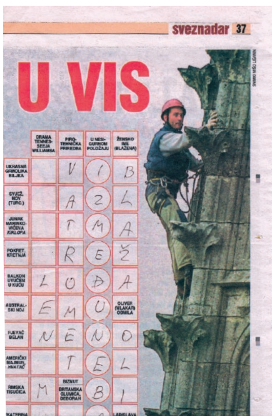
Šišmiš na katedrali u Večernjem listu (2. 4. 2006.)