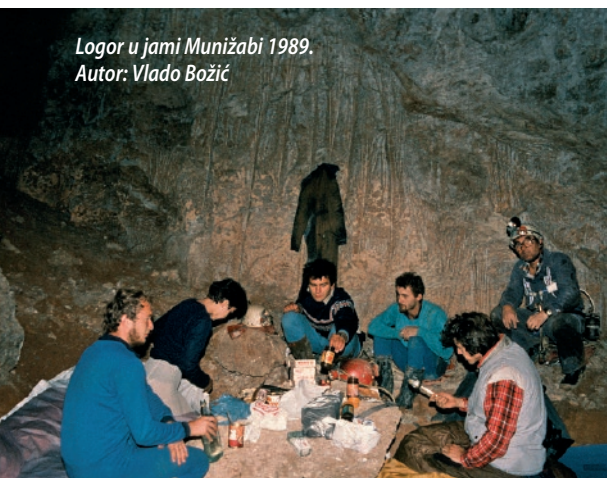
Logor u jami Munižabi 1989.

Svoju prvu stotku, jamu Janovku u Devčićima, Šišmiš je „probio“ već sa 17 godina. Opušteno nam preporučava: