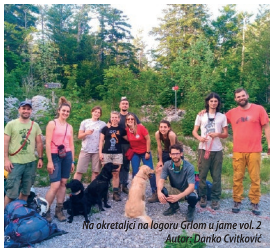
Na okretaljci na logoru Grlom u jame vol. 2 Autor: Danko Cvitković