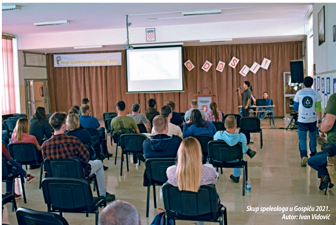
Skup speleologa u Gospiću 2021.

Na kraju godine započeta je i suradnja Laboratorija za geoprostorne analize i vizualizacije na Geografskom odsjeku PMF-a i Čistog podzemlja. Podaci o onečišćenim špiljama i jamama odsad su dostupni geografskoj znanstvenoj zajednici diljem svijeta za različite analize.