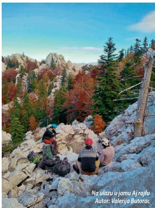
Na ulazu u jamu Aj rajfu