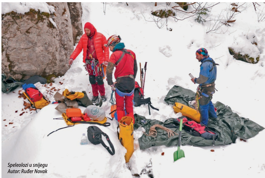
Speleolozi u snijegu