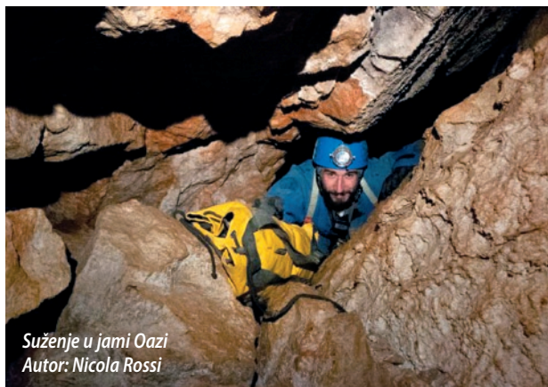
Suženje u jami Oazi

Uspostavljena je suradnja Čistog podzemlja i zagrebačke XV. gimnazije, u sklopu koje učenici testiraju uzorke vode koje su im speleolozi prikupili iz različitih špilja i jama na prisutnost mikroplastike. XV. gimnazija lani se priključila projektu „Microplastic monitoring protocol Trial“, u kojem zajedno sa znanstvenicima iz Italije i Australije rade analize mikroplastike u vodi, ali i provode razne edukacije.