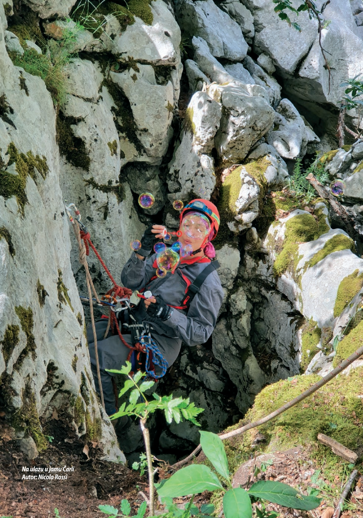
Na ulazu u jamu Čarli