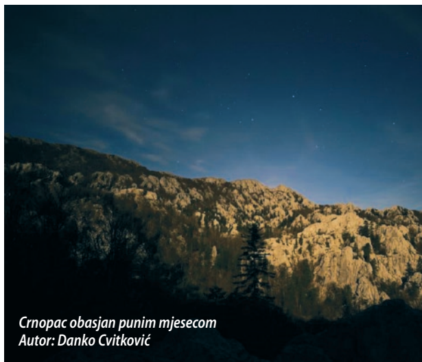
Crnopac obasjan punim mjesecom

Hrvatska gorska služba spašavanja (HGSS) 15. lipnja u Ogulinu je svečano proslavila blagdan svog zaštitnika sv. Bernarda. Tom prigodom našim čla-