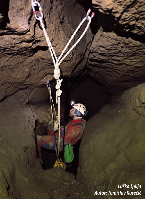
Luška špilja Autor: Tomislav Kurečić