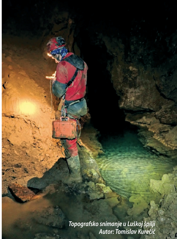
Topografsko snimanje u Luškoj špilji Autor: Tomislav Kurečić

inicijativi ČP donaciju od 200 000 kuna. Na toj akciji čišćenja iz špilje je izvađeno oko 10 kubika otpada. Tijekom godine ČP je nastavilo s donacijama speleološkim organizacijama koje u akcijama čišćenja iznose otpad iz krškog podzemlja. Uspješnost suradnje Lidla i ČP-a dokazuje se sve većom količinom izvađenog otpada iz speleoloških objekata. U 2021. speleolozi su organizirali akcije čišćenja u čak 19 objekata, iz kojih je izvađeno više od 180 kubika otpada, što je više od dvostruko više nego u do tada rekordnoj 2020. godini, kada je izvađeno oko 80 kubika otpada.