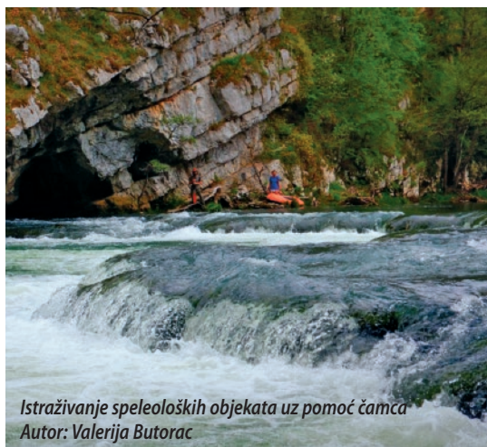
Istraživanje speleoloških objekata uz pomoć čamca

Logor Grlom u jame vol. 2 održan je na Crnopcu od 19. do 27. lipnja, a na njemu je sudjelovao 21 član Odsjeka te je ukupno istraženo 10 speleoloških objekata. Ulazi ovih objekata pronađeni su tijekom