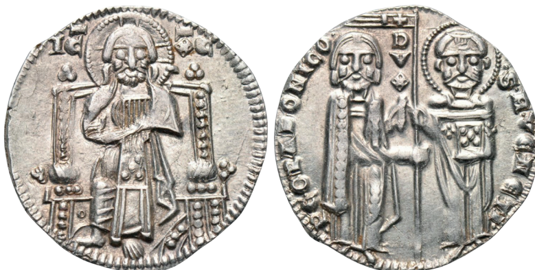
Slika 5. Novac mletačkog dužda Pietra Gradeniga (vl. 1289.-1311.)