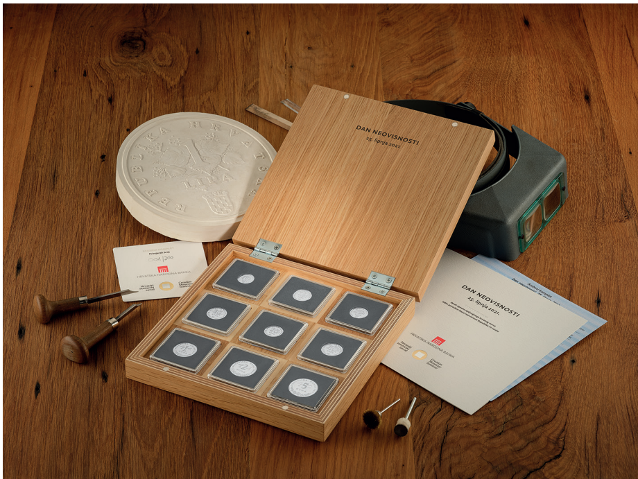
Numizmatički komplet prigodnoga srebrnoga kovanog novca

Kovanice srebrnog kompleta izrađene su od srebra čistoće 999/1000, a prodajna cijena kompleta iznosi 5.000,00 kuna.