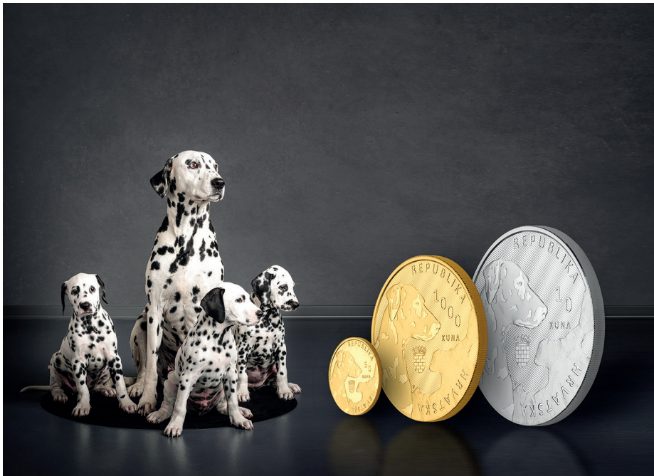
Kovanice s motivom dalmatinskog psa