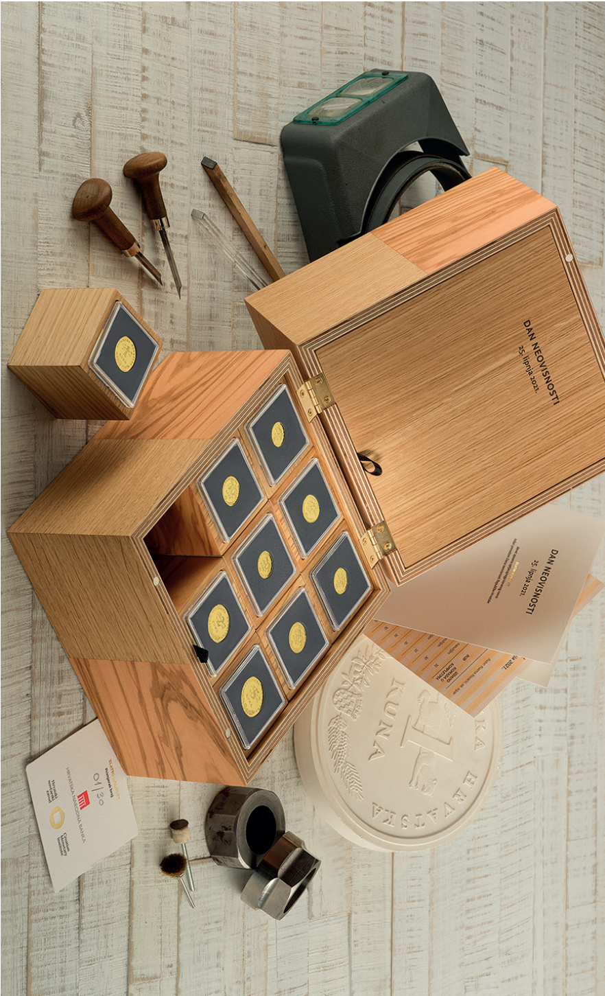
Numizmatički komplet prigradnega zlatnoga kovane novca