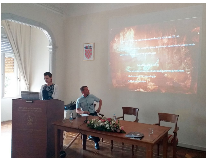
Izlaganja na skupu