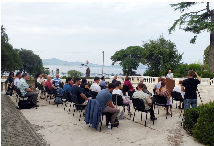
Otvoreње skupa i prigodna obraćanja