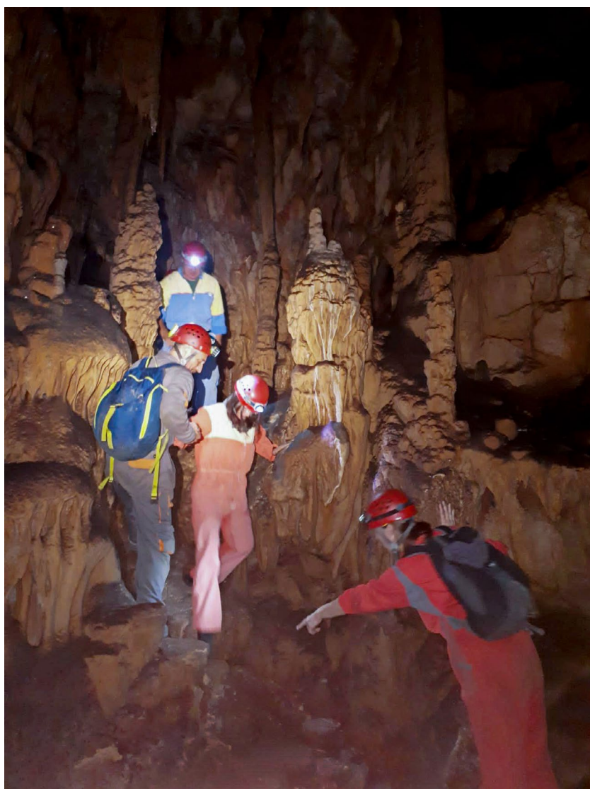
Posjet Modrić pećini za sudionike skupa