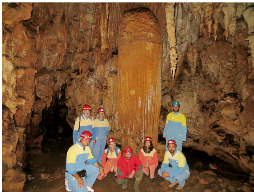
Posjet Modrić pećini za sudionike skupa