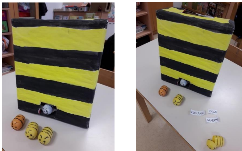
Slika 1 i 2: Čitanje košnica s pčelama

Tako sam u 1. tromjesečju izradila košnicu u koju sam stavila pčele napravljene od Kinder jaja. Kao poticaj za svako čitanje dopustila sam učeniku da odabere jednu pčelu. U pčeli se skrivala izreka ili poslovice koju sam srezala na nekoliko riječi. Za domaću zadaću učenik je pravilno sastavio riječi i dopunio poslovicu. Njegov zadatak bio je raspitati se o značenju izreke ili sutradan o njoj pitati učitelja u školi. Učenici su voljeli čitati i zbog sakupljanja pčela, tog motivacijskog faktora.