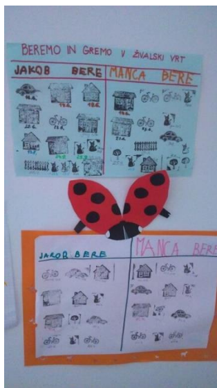
Slika 8. Tablica (Jakob čita, Manca čita)