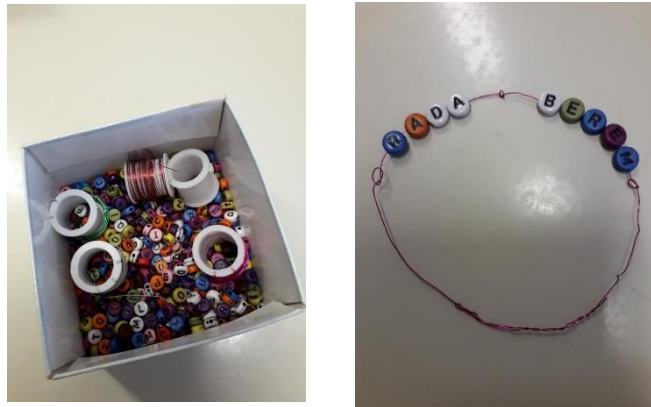
Slika 3 i 4. Narukvica za čitanje

Kao još jedan motivacijski alat nazvala sam narukvicu za čitanje. Učenici su na dodatnoj lektiri ili redovnoj lektiri dobili perlicu sa slovom koju su nanizali na narukvicu. Prilikom svakog čitanja dobili su jednu perlicu i tako su sastavili svoje ime i prezime ili odabranu rečenicu (npr. volim čitati). Voljeli su stajati u redu da im napunim narukvicu i voljeli su znati da ih se sluša. Istodobno sam promatrala njihov odgovor na to, hoće li u kut za čitanje doći bez prisile i hoće li svaki put birati čitanje. Neki u početku također nisu imali samoinicijativni odgovor, ali kada su primijetili da su drugi motiviraniji od njih odlučili su i sami pristupiti čitanju.