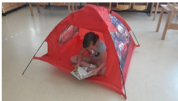
Slika 5 i 6. Čitanje u čitaonici/šatoru ispod svjetla i s pokazateljem čitanja