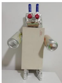
Slika 5: Robot