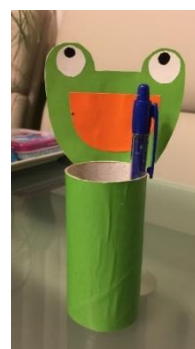
Slika 6: Stalakk za olovkke

Nakon povratka u školu napravili smo izložbu fotografija u učionici i neko vrijeme razgovarali o ponovnoj uporabi otpadne ambalaže.