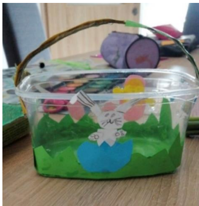
Slika 2: Košarica