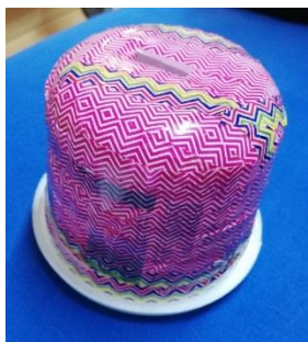
Slika 4: Štedna kassica