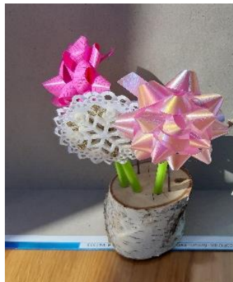
Slika 3: Vaza