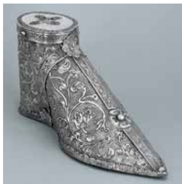
Slika 8. Relikvijar – stopalo sv. Krševana

Relikvijar – stopalo sv. Krševana čuva se također u Stalnoj izložbi crkvene umjetnosti, izrađen je od srebra tehnikom iskucavanja i graviranja, datira se u XVII. stoljeće, a djelo je zadarskih zlatarskih radionica. Dimenzije mu iznose: visina 11,5 cm, dužina 25 cm, širina 9 cm. Ukrašen je izvijenim lisnatim viticama, s apliciranim trakama i cvijećem. Na vrhu ima poklopac s križnim otvorom za razgledavanje relikvija. Ima oblik gotičke pontifikalne cipele (slika 8).