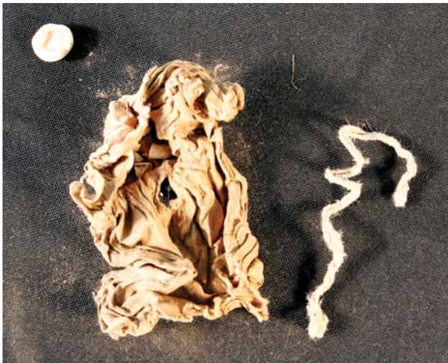
Slika 7. Vrećica sa sjemenkama/plodovima (?) iz škrinjice sv. Krševana

mineraliziranim sjemenkama/plodovima možda neke mahunarke, a najsličniji su plodu bijele lupina – bučjaka ( lupinus albus ). 18