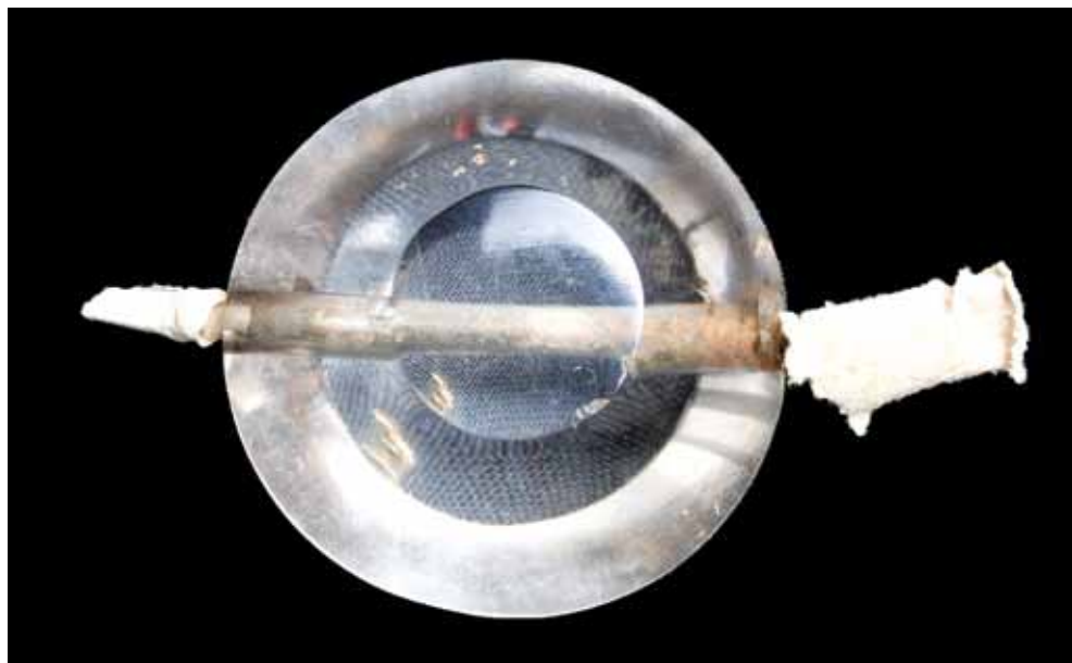
Slika 3. Kristalna theca iz škrinjice sv. Krševana

Croce), 8 stauroteca iz samostanske crkve Santa Maria u Banzio 9 u Basilicati i katedrale u Acerenzi. 10 Fasetirani gorski kristal koji se obrađivao u Veneciji u XIII. i XIV. stoljeću upotrebljavao se ne samo za relikvijare već za ophodne križeve i svijećnjake, poput onih sačuvanih u bazilici sv. Marka u Veneciji, crkvi sv. Petra u Mantovi i bazilici sv. Franje u Assisiju, ili su sačuvani kao izolirani komadi na križu iz Dijecezanskog muzeja u Geroni. 11