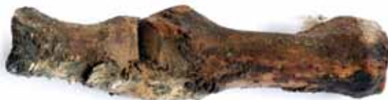
Slika 11. Prva metatarzalna kost ( hallux ) lijevog stopala i prvi proksimalni članak palca lijeve noge, spojeni mumificiranom kožom

nalazi, postoji i drugi raskošnije učinjen (gotovo istih dimenzija) relikvijar istoga svetca, rađen u pozlaćenom srebru tehnikama iskucavanja, graviranja i filigrana te dodatno ukrašen dragim kamenjem. 21 U spomenutom najstarijem inventaru riznice katedrale sv. Stošije od 15. siječnja 1427. godine donosi se podatak da su dio njega dva stopala rađena od srebra i dijelom od zlata „za koje se kaže da su stopala svetog Krševana“ ( pedes duos argenteos partim aureatos qui dicuntur esse pedes sancti Grixogon ). 22 Na stranici istoga inventara, pokraj opisa triju kruna,