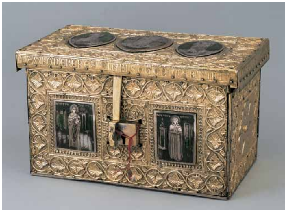
Slika 1. Relikvijar – škrinjica sv. Krševana