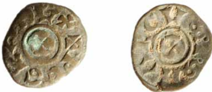
Slika 12. Piccolo ili denaro scodellato mletačkog dužda Giovannija Dandola

nalazi, postoji i drugi raskošnije učinjen (gotovo istih dimenzija) relikvijar istoga svetca, rađen u pozlaćenom srebru tehnikama iskucavanja, graviranja i filigrana te dodatno ukrašen dragim kamenjem. 21 U spomenutom najstarijem inventaru riznice katedrale sv. Stošije od 15. siječnja 1427. godine donosi se podatak da su dio njega dva stopala rađena od srebra i dijelom od zlata „za koje se kaže da su stopala svetog Krševana“ ( pedes duos argenteos partim aureatos qui dicuntur esse pedes sancti Grixogon ). 22 Na stranici istoga inventara, pokraj opisa triju kruna,