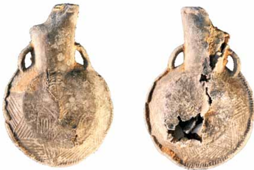
Slika 4. Olovna hodočasnička ampula iz škrinjice sv. Krševana

b) Olovna hodočasnička ampula širine tijela 3,75 cm, visine 5,5 cm i debljine 1,45 cm (slika 4) ukrašena je s obje strane u tehnici grafizma, po rubovima ima trokutaste motive s vodoravnim linijama koji zapravo sveukupno čine zvjezdoliki okvir za „medaljon“ u kojem se nalaze svetački likovi. Na bolje sačuvanoj strani prikazan je najvjerojatnije lik Bogorodice u bizantskoj maniri ( theotokos ) koja blagoslivlja. Druga strana ampule jako je oštećena, međutim vidljivo je da je i na njoj bio prikazan svetački lik, no koga on predstavlja, nije nam moguće pretpostaviti.