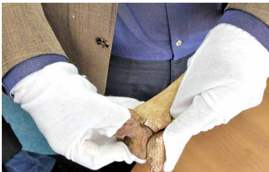
Slika 14. Trenutak spajanja skočne kosti iz relikvijara – stopala sv. Krševana s goljeničnom, lisnom i petnom kosti iz škrinjice sv. Donata

Venecijanski novčić iz relikvijara – stopala sv. Krševana po svojoj prilici razriješio pitanje nastanka i izrade obaju relikvijara – stopala toga svetca iz riznice katedrale. Svakako ključan, a možda u ovom trenutku i najvažniji, predmet iz provedene rekognicije bila je lijeva skočna kost ( talus ) koju smo našli u relikvijaru – stopalu sv. Krševana, kost koja je savršeno nalegla na goljeničnu, lisnu i petnu kost iz škrinjice sv. Donata (slika 14). Time je definitivno potvrđeno da se u tom