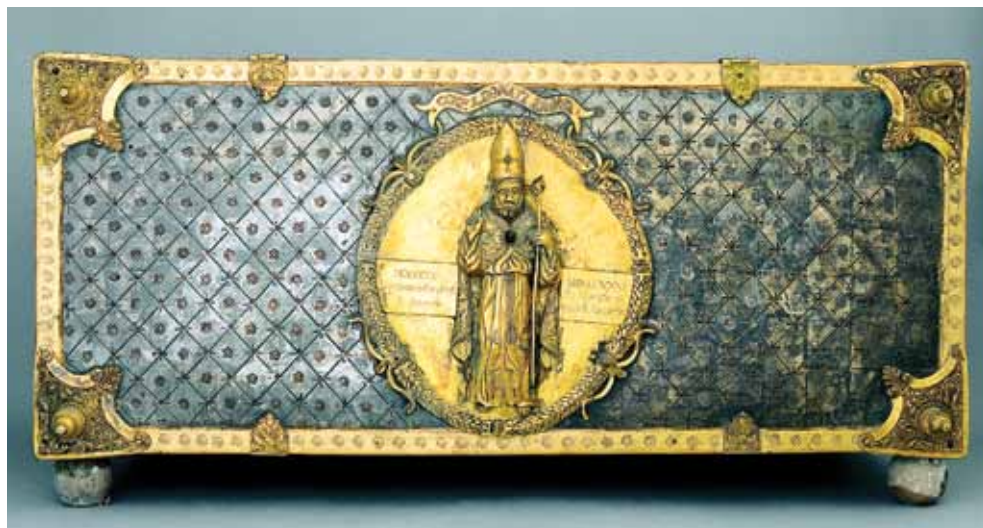
Slika 13. Relikvijar – škrinjica sv. Donata

sv. Donata pripadale su odraslom muškarcu koji je u trenutku smrti imao između 40 i 50 godina. Na tom kosturu uočeno je više pokazatelja fizičkog prenaprezanja. Te promjene teško je korelirati s onim što znamo o sv. Donatu, odnosno činjenici da ga povijesni i crkveni izvori opisuju kao izuzetno mudru i razboritu te politički vrlo umješnu osobu koja je uspješno posredovala u sklapanju mira između Franačkog i Bizantskog Carstva, za što je kao nagradu od bizantskog cara Nikefora I. (802. – 811.) dobio moći zadarske zaštitnice sv. Stošije, a predaja mu pripisuje da je dobio i moći tri solunske mučenice – sestre rodnom iz Akvileje: Irene, Chione i Agape.