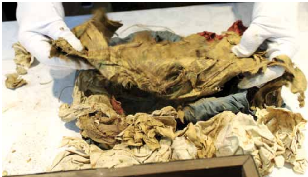
Slika 6. Tunika/košulja sv. Krševana (u rukama) i ostala platna iz škrinjice sv. Krševana

d) Ostaci tekstila, odnosno tunike/košulje sv. Krševana koji se spominju u navedenom zapisu trebali bi biti oni koje smo već spomenuli, u koje su bile umotane ljudske kosti i zub, fragmenti životinjskih kostiju, kristalna theca i hodočasnička ampula (slika 6).