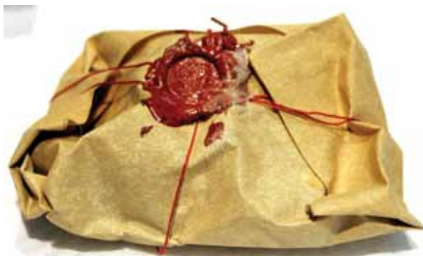
Slika 9. Zapečaćene relikvije iz relikvijara – stopala sv. Krševana

S obzirom na to da je poklopac vijcima bio pričvršćen za ostatak stopala, mogao se otvoriti, što smo napravili, te smo ispod njega našli veću količinu pamuka, a ispod njega svetačke moći omotane u bijeli papir koji je s vremenom požutio, obavijen crvenim koncem preko kojeg je bio pečat (slika 9). Kada smo to oprezno otvorili, našli smo sljedeće: a) dobro ušćuvanu lijevu skočnu kost ili talus odraslog muškarca (slika 10); b) prvu metatarzalnu kost ili hallux lijevog stopala odraslog muškarca; c) prvi ili proksimalni članak palca lijeve noge odraslog muškarca (slika 11) i d) venecijanski novčić piccolo ili denaro scodellato (slika 12). Hallux i prvi članak lijevog stopala bili su spojeni mumificiranom kožom (slika 11).