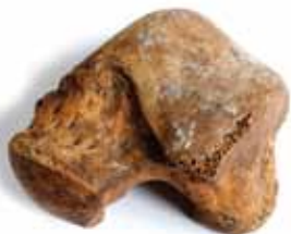
Slika 10. Talus iz relikvijara – stopala sv. Krševana