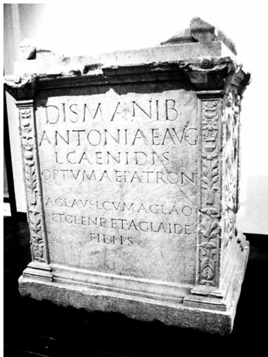
Slika 3. Nadgrobnji žrtvenik Antonije Cenide, CIL 6, 12037, Rim, (...muzej), prednja strana s natpisom (izvor: https://feminaeromanae.org/caenis.html – 6. 12. 2021.)