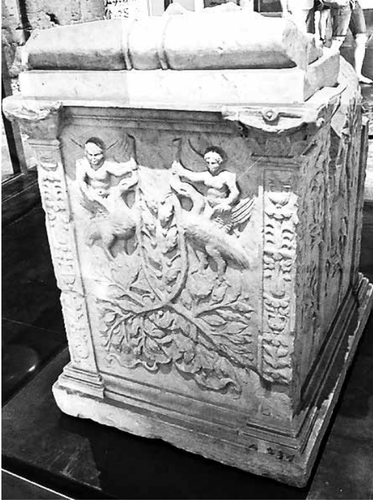
Slika 4. Nadgrobni žrtvenik Antonije Cenide, CIL 6, 12037, Rim, (...muzej), desna strana (izvor: https://feminaeromanae.org/caenis.html – 6. 12. 2021.)

( balineus Caenidianus ), pronađen također na Nomentanskoj cesti, 60 nekoliko stotina metara sjeveroistočnije od mjesta gdje su zabilježeni nalazi „njezinih“ fistula. Posjed je stoga mogao biti vrlo velik, i vjerojatno je uključivao stambene i rekreativne, možda i gospodarske sadržaje, primjereno vlasnici koja je, iako oslobođenica, pripadala visokim društvenim krugovima oko carske obitelji, najprije kao robinja i oslobođenica Antonije Mlađe, potom kao konkubina cara Vespazijana. Natpis je postavio carski rob, koji je upravljao kupelji koja je bila dio nekadašnjeg Cenidina posjeda, ali je mogla biti i otvorena za javnost. 61 Cenidini nekadašnji robovi koji su status slobodnih ljudi stekli od careva nose dodatno ime Caenidianus / Caenidiana , što također svjedoči o ugledu koji je Cenida uživala u rimskome društvu i poslije smrti.