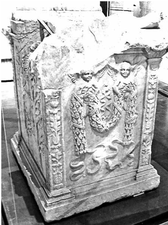
Slika 5. Nadgrobni žrtvenik Antonije Cenide, CIL 6, 12037, Rim, (...muzej), lijeva strana (izvor: https://feminaeromanae.org/caenis.html – 6. 12. 2021.)

Ne vjerujemo da je taj trag dovoljno čvrst dokaz da je Cenida (a prije nje možda Antonija Mlađa) imala u Istri značajnijih gospodarskih interesa. To, dođuše, jest moguće, ali nam u tom slučaju još uvijek nije poznato, jer mali broj pripadnika Antonijine šire, servilne i libertinske obitelji to nikako ne potvrđuje, za razliku od onomastičkih pokazatelja drugih rimskih patricijskih obitelji (npr. Lekanija, Palpelija i Setidija). 63 Zanimanje rimske političke elite, a to je istovremeno i gospodarska elita, za poduzetništvo u Istri svakako je postojalo, ali prema epigrafskim podacima kojima raspolažemo Antonii nisu zastupljeni u većem broju. Stoga možemo zaključiti da je njihova uloga u gospodarskom i društvenom životu Istre u 1. stoljeću posl. Kr. bila razmjerno mala te da Antonija Mlađa