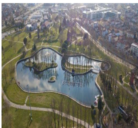
Slika 1. Donatim park

U danom popisu flore, vrste, podvrste i kultivari su navedeni abecednim redom u okviru porodica i viših sistematskih kategorija. Za svaku svojtu navedeno je sljedeće: znanstveno i hrvatsko ime, oblik habitusa te podaci je li je vrsta listopadna ili vazdazelena. Razdioba životnih oblika dana je prema Erhardt et al., 2002 uz određena pojednostavljena. U popisu flore navode se sljedeće kratice: G-grm, G/S-grm ili stablo, S/G-stablo ili grm, S-stablo, Li-penjačica (lijana). Dok je raspodjela svojti na listopadne (L) i vazdazelene (V) preuzeta iz: Walters, 1986; Walters, 1989; Erhardt et al., 2002.