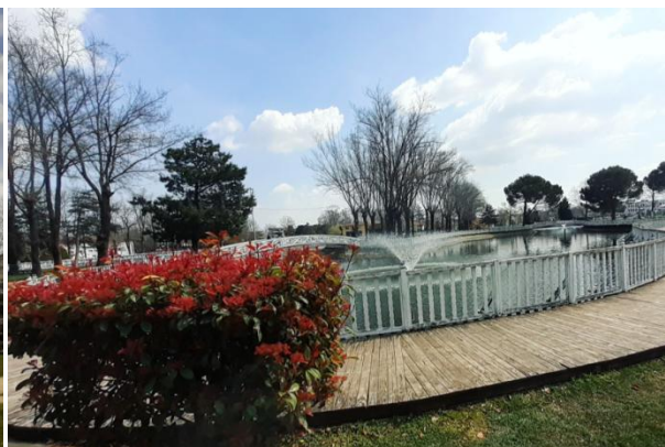
Slika 5. Pogled-2. na Donatim park Figure 5. View-2 at Donatim park

Donatim park (Slike 4 i 5) u gradu Adapazari veoma je bogat dendrološkim svojstama. Tijekom terenskog istraživanja utvrđeno je da Donatim park obiluje dendrološkim svojstama, njih čak 61, te se ubraja u jedan od najljepših i najvećih parkova u provinciji Sakarija. Većina stabala i grmova odličnog su vitaliteta i zadovoljavajućeg estetskog stanja, osim nekoliko stabala Phoenix dactylifera L., (obični datuljevac) koje su se osušile, vjerojatno zbog neodgovarajućih stanišnih uvjeta (suvišak vode, s obzirom da su posađene neposredno uz umjetno jezero) (Slika 6). Ostala parkovna stabla i grmovi imaju pravilno formiranu (orezanu) i zdravu krošnju, jer se redovito godišnje održavanje parka provodi na vrijeme i prema pravilima struke. Debla stabala su zdrava, bez tragova gljivičnih infekcija. Također, rak rane, i različiti tumori nisu prisutni na stablima. Krošnje su im pravilno formirane. Što se tiče štetne entomofaune, stabla F. angustifolia (poljski jasen) su u manjoj mjeri napadnuta ušima Prociphilus fraxinifolli Fabricius koje izazivaju kovrčanje listova i čine im samo estetske štete. Parku je potrebna umjerena revitalizacija u cilju uklanjanja osušenih datulja koje bi se zamijene adekvatnim svojstama. U parku se nalazi veći broj mladih stabala i novih sadnica, koje se estetski odlično uklapaju u već prisutne starije drvorede.