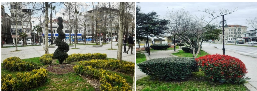
Slika 3. Pogled-2 na gradsko zelenilo Adapazaria