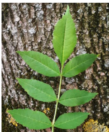
Slika 7. Poljski jasen

Figure 7. Narrow-leaved ash