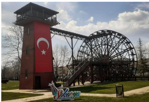
Slika 4. Pogled-1. na Donatim park Figure 4. View-1 at Donatim park