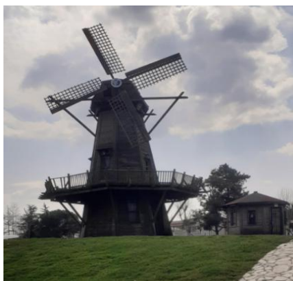
Figure 10. View on airplane in park View on old windmill.