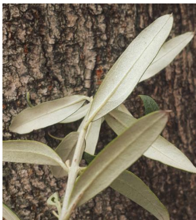
Slika 8. Listovi masline

Maslina se najviše uzgaja u suptropskoj zoni i zahtjeva obilje svjetlosti. U Mediteranskim zemljama visoke temperature ovoj kulturi ponekad nanesu palež lista i ploda. U zimskom razdoblju maslina podnese do -8°C, u trajanju od nekoliko dana. Preosjetljiva je na velike količine vode. Najviše joj odgovaraju ocjedita lagana tla (Nikolić i Radulović, 2010).