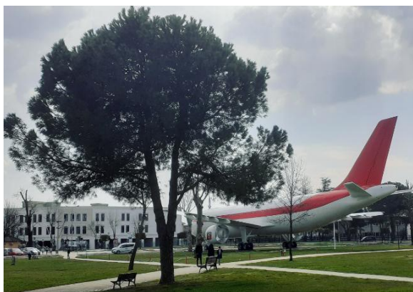
Slika 10. Pogled na zrakoplov u parku Slika 11. Pogled na staru vjetrenjaču (Foto: A. Adžemović, 2021). (Foto: E. Delić, 2021).

Parkovna infrastruktura (klupe, staze) unutar Donatim parka su u odličnom stanju, bez vidljivih tragova oštećenja. U parku se nalazi i restoran za posjetitelje, a pored klupa za odmor, dekorativnih fontana na jezeru, tu su i montirane različite sprave za vježbanje i rekreaciju u prirodi, kao i uređene biciklističke staze. Navedeno doprinosi velikoj posjećenosti parka u svim sezonama. U parku se nalazi i ogromni model putničkog zrakoplova (Slika 10), u kojem gradonačelnik grada Adapazari planira otvoriti restoran za stanovnike i turiste, kao i stara, dekorativna drvena vjetrenjača (Slika 11).