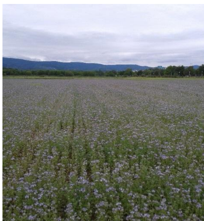
Slika 1. Usjev facelije

Facelija je biljna vrsta porijeklom iz jugozapadnog dijela Sjeverne Amerike (Kalifornija, Meksiko) koja je uvedena u Europu u 19. stoljeću kao medonosna, ukrasna i krmna biljka (Hulina, 1993; Gilbert, 2003; Hulina, 2011; Popović et al., 2017b). Osim u Americi danas je prisutna i u Europi i Australiji. Facelija se može koristiti za različite namjene: za zelenu gnojdbu, kao zaštitni i pokrovni usjev, kao krmna kultura za proizvodnju zelene krme, silaže i sijena, kao antierozivna vrsta, nematocidna vrsta, te kao odlična pčelinja paša, ljekovita, ali i ukrasna vrsta (Petanidou, 2003; Svečnjak, 2007; Popović et al., 2020) (Slika 1).