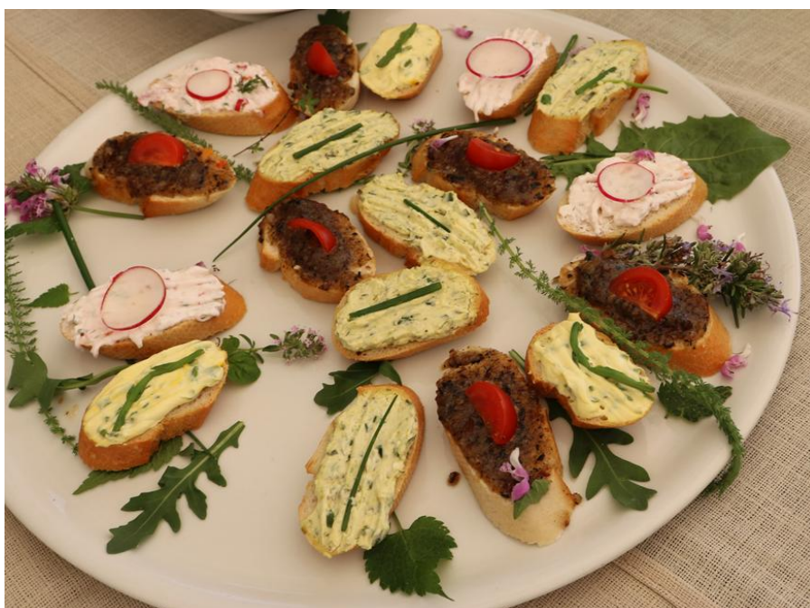
Slika 7. Maštovita jela i namazi s dodatkom samoniklog bilja u lokalnom restoranu "Dorina" u Plominu

Današnji stanovnici Plomina također su vrlo čvrsto povezani s prirodom koja ih okružuje. Pokušavaju se prilagoditi okruženju koje puno daje, ali istodobno ne dopušta puno, što ostaje izazov i u moderno doba. Intenzivno upravljanje poljoprivredom na skromnim zemljištima i u sušnim uvjetima naravno nije moguće, pa su prihodi od turizma itekako dobrodošli. Međutim, mještani su svjesni da je i to održivo samo do određene mjere. Oni se jako zalažu za ekološku i održivu upotrebu krajobraza i namjenu njegovih dobara. Nastoje živjeti što više u suživotu s prirodom i oživjeti uporabu samoniklog bilja u ljekovite svrhe te povezati upotrebu samoniklog bilja s gastronomijom.