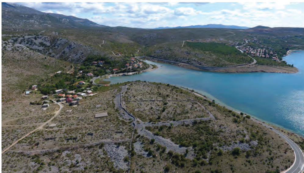
Sl. 7. Kastron, luka u Modrič Dragi i pristup Velebitu – pogled sa zapada / Fig. 7. Kastron, Modrič Draga port and access to Velebit – a view from the west