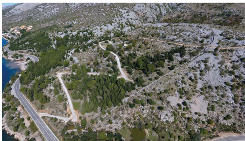
Sl. 15. Istočni pojas bedema kastrona Sv. Trojice / Fig. 15. East stretch of the St. Trinity kastron walls

Nakon obilaska ovog interesantnog nalazišta, čini se da su otklonjene eventualno postojeće dileme glede utvrđivanja vremenske pripadnosti tog prostranog fortifikacijskog kompleksa. Uistinu ga možemo pripisati razdoblju prve vladavine Bizanta, tj. epohi cara Justinijana I. (527.–565.). Daljnji potrebni terenski podaci o tom kastronu bit će svakako prikupljeni tijekom budućih nužno potrebnih sustavnih istraživanja tog dijela naše kasnoantičke spomeničke baštine. Ipak, impresivan dojam koji nam kastron ostavlja veličinom i sjajno zaštićenim položajem, budi nadu da je nakon 537. godine mogao preuzeti ulogu starijeg središnjeg naselja Velebitskog podgorja, tj. antičkog municipija Argirunta, koji je iz nama još uvijek nepoznatih razloga stradao početkom 4. stoljeća. Nakon stradanja municipija, tamošnja prapovijesna Gradina mogla je biti najbližim zaklonom ( refugium ) za populaciju koja je nastavila život. Potom je u prvoj polovini 6. stoljeća veliki kastron na položaju Sv. Trojici preuzeo ulogu središta šire regije, kao i nadzora prometovanja Velebitskim kanalom, a preko Velebita gorskim prijevojima i s dubinama zaleđa. Čini se da je kastron bio i vjerojatnim duhovnim središtem šireg areala, dakle tzv. kastron oikumenon . Titular crkve izgrađene u središnjem dijelu velike utvrde upućuje na epohu Justinijana I., ali nije nikako stran i ranome srednjem vijeku.