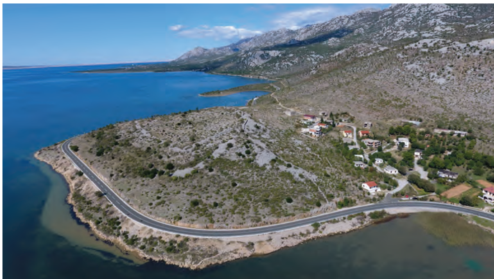
Sl. 2. Gradina Modrić Draga – pogled na Starigrad; snimak pomoću drona / Fig. 2. Modrić Draga hillfort with a view of Starigrad; a drone photograph