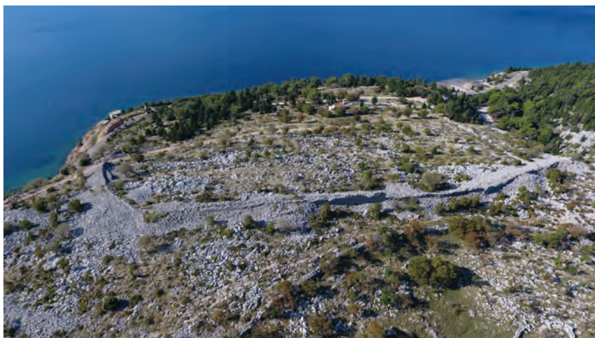
Sl. 13. Sjeverni bedem kastrona Sv. Trojice (snimak dronom: M. G. i J. Š., 2017.) / Fig. 13. North wall of the St. Trinity kastron (drone photo: M. G. and J. Š., 2017)