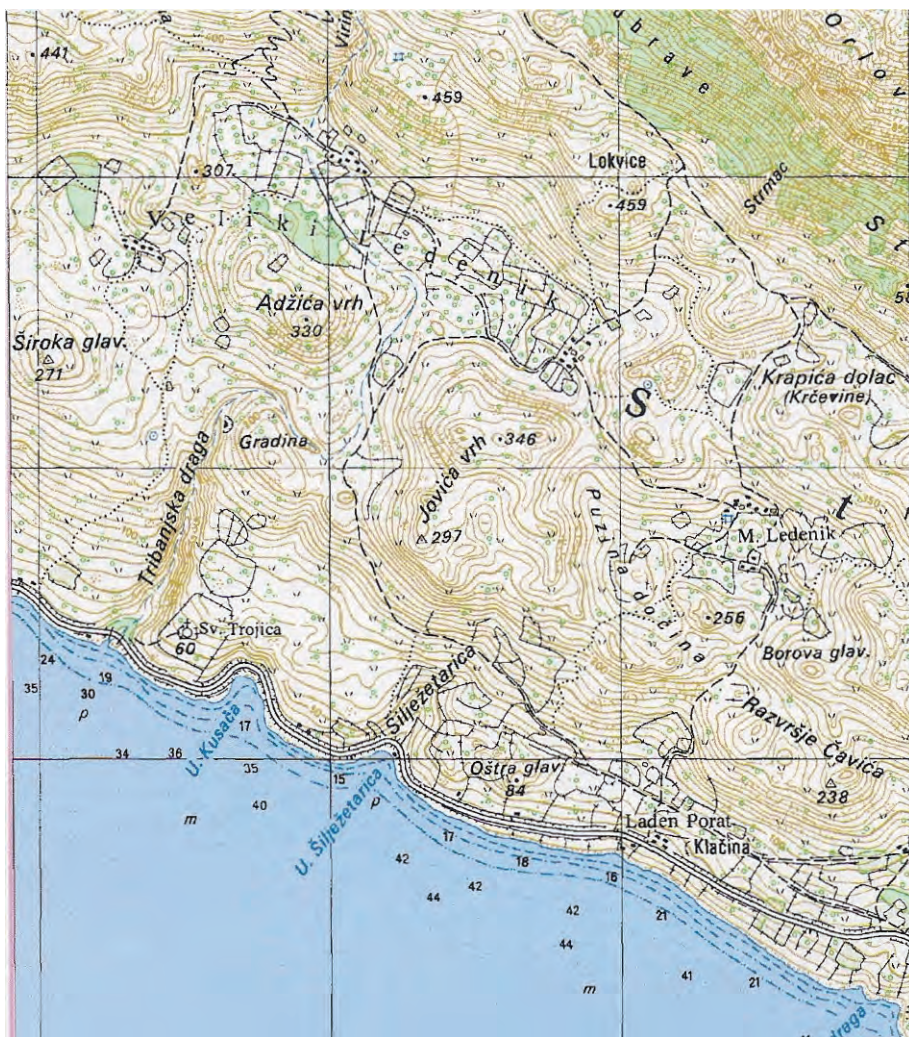
Sl. 8. Topografska karta s položajem Gradine Sv. Trojice / Fig. 8. Topographic map with the location of the St. Trinity hillfort

Važno je napomenuti da je arheološka zona poznata pod imenom Sv. Trojica bila kontinuirano predmetom znatnog interesa, koji se ogleda u rekognosciranjima, pokusnim i zaštitnim sondiranjima, daljinskom snimanju i interpretaciji satelitskih i zrakoplovnih snimaka, a u novije vrijeme i pomoću drona. Kao treća dimenzija arheologije proučavan je dokazani brodolom u prirodnim uvalama podno kastrona. Tijekom srpnja 1990. i 1996. autor ovog priloga detaljnije je obišao lokalitet Sv. Trojicu i tom prigodom registrirao dobro očuvane sekcije pravolinij-