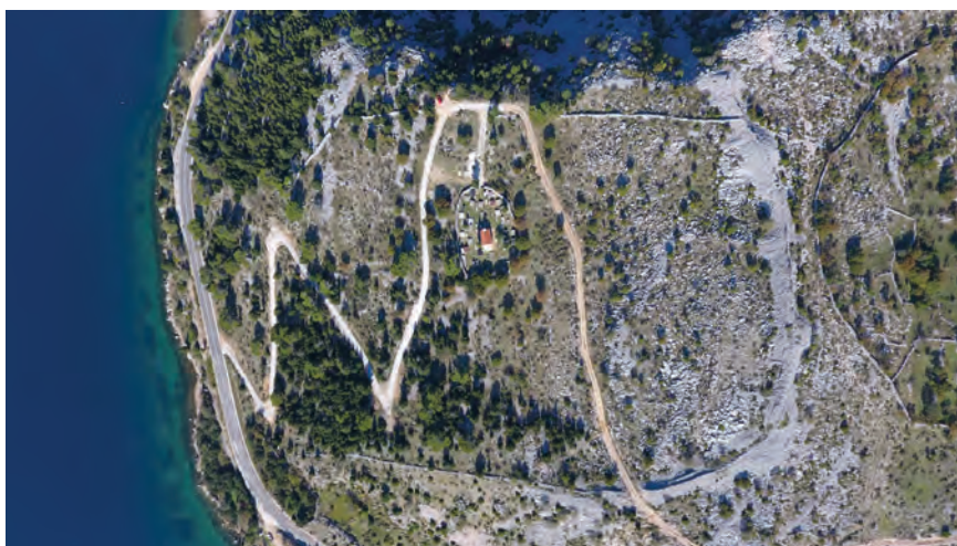
Sl. 14. Četvrtaste i potkovičasta kula sjevernog bedema kastrona Sv. Trojice (snimak dronom: M. G. i J. Š., 2017.) / Fig. 14. Rectangular and horseshoe towers of the north wall of the St. Trinity kastron (drone photo: M. G. and J. Š., 2017)

Kastron Sv. Trojica zauzima strateški izvrstan položaj (kota 60 m) dobro zaštićenom konfiguracijom terena, kako se to razabire na snimka dronom. Pristup je otežan s juga, tj. s obalnog ruba, dok je potpuno onemogućen sa zapada poradi duboke Tribanjske drage. Na istoku je zaštićen snažnim bedemom s kulama (sl. 14). O privlačnosti položaja svjedoči kontinuitet naseljavanja od protopovijesnog gradinskog naselja zajednice Liburna na položaju Gradini s vjerojatnim podgrađem i pripadajućom nekropolom, 69 do izgradnje ranobizantske utvrde na kojoj se život nastavlja i tijekom kasne antike, a jamačno i ranoga srednjeg vijeka. 70 Prapovijesna Velika gradina površine je 4,806 ha i opsega 839 m, dok je površina Male gradine 4,54 ha a opseg je bedema 800 m. Sjeverno od Velike gradine i Adžića vrha (330 m) nalazi se položaj Veliki ledenik, poznat kao poljoprivredna površina veličine 45 ha. Sjevernije od Velike gradine su gorski prijevoji koji su osiguravali mogućnost kontinuiranog tranzita ljudi i dobara (stoke, soli, drveta, obrtničkih tvorevina). Bitno je istaknuti dragocjene numizmatičke nalaze sa željeznodobnog naselja gradinskog tipa, koji su sustavno znanstveno proučeni i objelodanjeni. 71 Riječ je o 33 primjerka novca, doslovno spašenih u južnim profilima nastalima