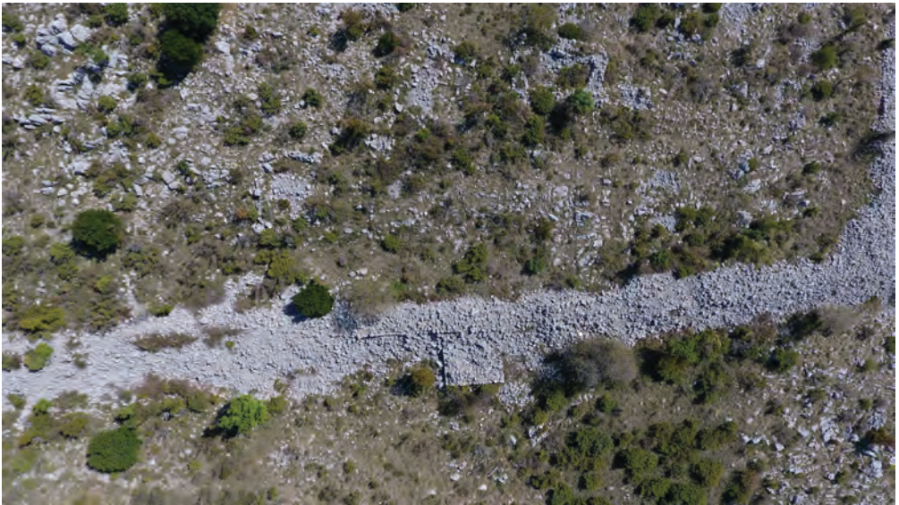
Sl. 5. Kastron Modrič Draga – detalj zapadnog bedema s četvrtastom kulom (snimak dronom: M. G. i J. Š., 2017.) / Fig. 5. Kastron of Modrič Draga – a detail of the western wall with a rectangular tower (drone photo: M. G. and J. Š., 2017)

um (Karin). Nadalje, s položaja kastrona u Modrič Dragi štitio se kopneni istočni prilaz Argiruntu i uspostavljao određeni kontakt s velikim kastronom Sv. Trojicom (Tribanj Šibuljine), ali i nadzor nad vrlo važnim morskim prolazom Ljubučkim vratima između zapadne obale Kotara, s utvrdom Ljupčem (Ljubač) i otokom Pagom. Posebna je vrijednost utvrde u neposrednoj blizini Uvale Modrič pogodno sidrište za brodovlje, ali i ishodište kopnene komunikacije u gorski masiv Velebita (sl. 7). Nikako ne treba zapostaviti ni blizinu izdašnog vrela vode u Modrič Dragi, koja je sada boćata ali valja u obzir uzeti fenomen bradizma, kada je u kasnoj antici izvor slatke vode bio na oko 1,5 m višoj razini. Možemo opravdano pretpostaviti da je kastron u Modrič Dragi bio važna karika u sustavu kasta na razmatranom području.