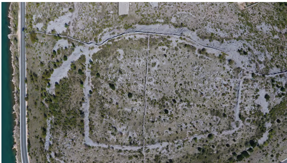
Sl. 6. Neki objekti unutar perimetra bedema kastrona u Modrič Dragi / Fig. 6. Some structures within the perimeter of the Modrič Draga kastron