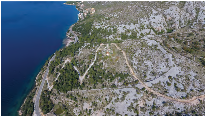
Sl. 12. Kompleks kastrona Sv. Trojice – pogled s jugoistoka / Fig. 12. St. Trinity kastron – a view from the southeast

jasno se raspoznaju izravnavajući slojevi. 68 Bedemi su ponegdje dosezali visinu od oko 6 m očuvanog zidnog plašta, dok su ih četvrtaste kule sigurno izvorno nadvisivale, što je bila uobičajena pojava na utvrdama diljem Justinijanova imperija.