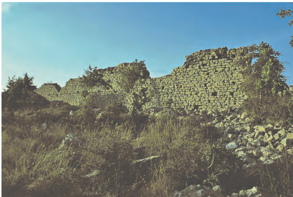
Sl. 10. Kastron Sv. Trojica – pogled na detalje sjevernog bedema / Fig. 10. St. Trinity kastron – a view of details of the north wall