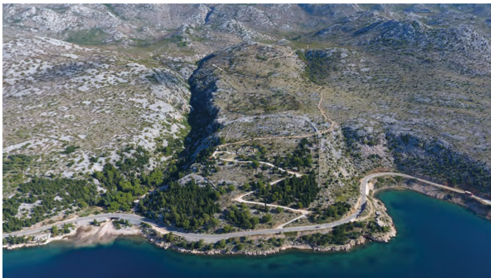
Sl. 11. Kastron Sv. Trojica – pogled sa zapada / Fig. 11. St. Trinity kastron – a view from the west