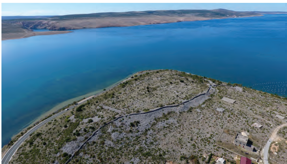
Sl. 3. Gradina Modrić Draga – pogled prema Novskom ždrilu / Fig. 3. Modrić Draga hillfort – a view of Novsko ždrilo