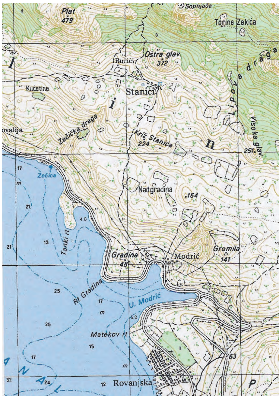
Sl. 1. Topografska karta s položajem Gradine Modrić Drage (mj. 1: 25000) / Fig. 1. Topographic map with the location of the Modrić Draga hillfort (scale: 1:25000)