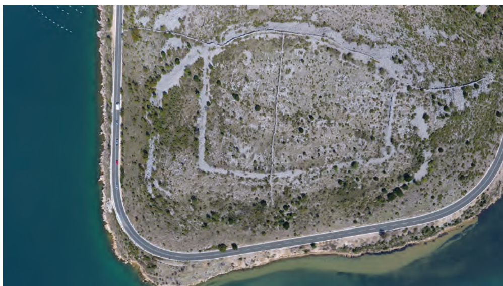
Sl. 4. Vertikalni pogled na kastron u Modrič Dragi (snimak dronom: M. G. i J. Š., 2017.) / Fig. 4. Vertical view of the kastron in Modrič Draga (drone photo: M. G. and J. Š., 2017)

Snimke kastrona Modrič Drage dronom s visine do oko 300 m pokazuju detalje utvrde, tj. bedeme iz kojih strše četvrtaste kule (sl. 5). Kastron je najviši na sjevernom dijelu bedema, koji se postupno spušta prema uvali Modriču. Opseg utvrde je 520 m, njegova je površina 1,47 ha, a bedemi su rađeni od na licima pritesanog lomljenog kamena. Slagani su u relativno pravilne slojeve u tehnici opus incertum . 45 Iz autorovih ranijih obilazaka utvrde poznata je veća kula istaknuta u njezinom jugoistočnom uglu, kao i spomenute druge četvrtaste kule na uglovima i na središnjem dijelu. 46 Ujedno se unutar perimetra bedema raspoznaju tlocrti pojedinačnih objekata, možda nastambi ali i mogućih cisterni (sl. 6). Nije prepoznat tloris nekog sakralnog objekta. Debljina zida iznosi 0,8 m, što je prosječna širina bedema Justinijanovih utvrda. Za bolje tumačenje ove utvrde potrebno je svakako poduzeti sustavna arheološka istraživanja, koja će pribaviti materijalne dokaze o životu u kasnoj antici ali i u prapovijesno doba.