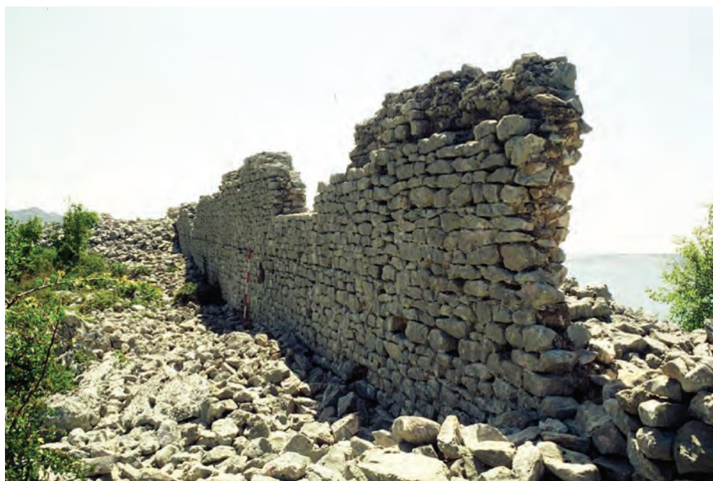
Sl. 9. Kastron Sv. Trojica – pogled na sjeverni bedem utvrde / Fig. 9. St. Trinity kastron – a view of the north wall of the fort

skog bedema (sl. 9) s ostacima isturenih kvadratnih kula, raspoređenih na uglovi- ma pravokutnog tlocrta kompleksa utvrđenja i u pravilnim razmacima u njihovu međuprostoru (sl. 10). Tehnika gradnje bedema, zatim tlorisna osnova te utvrde, a posebice njegova upućenost moru i nadzoru pomorskog prometa potvrda su da ga valja uvrstiti među slična ostvarenja vojnog graditeljstva nastala tijekom kasne antike uz naše priobalje i na otočju Jadrana, kao i diljem Sredozemlja. Riječ je o utvrđi koja ima izuzetno značajnu ulogu, ponajprije jer svojim položajem zatvara odnosno otežava kopnenim putem pristup zoni Starigrada Paklenice, antičkog Argirunta (sl. 11, karta 1). Utvrda je ujedno štitila i prilaz antičkom Vegiju/Bigi, okolici današnjeg Karlobaga.