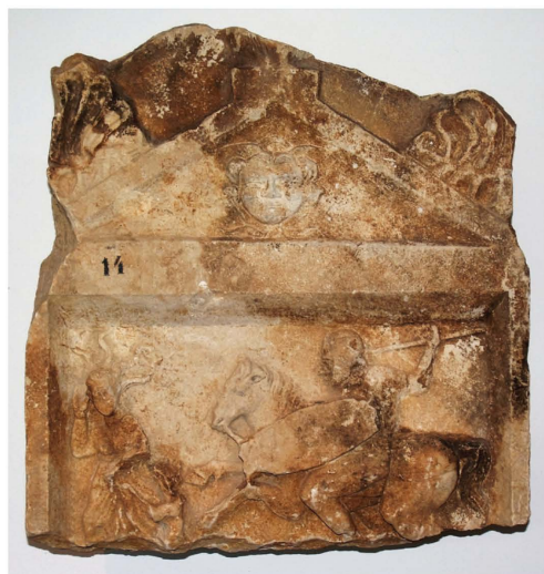
Sl. 3. Stela s konjanikom koji kopljem gađa barbarku, Narona (Muzej Narone Vid).