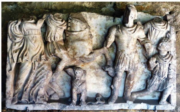
Sl. 1. Reljef s likom cara na konju kojega ovjenčava Viktorija, Salona (Arheološki muzej Split)

Fig. 1. Relief with the equestrian statue of an emperor wreathed by Victory (The Archaeological Museum Split).