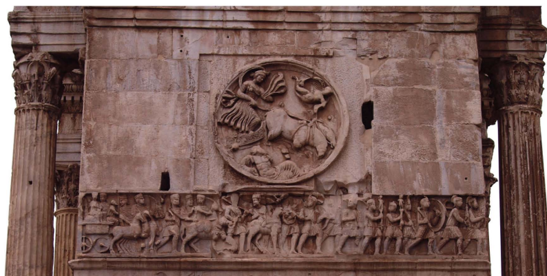
Sl. 2. Reljef na Konstantinovom slavoluku u Rimu.