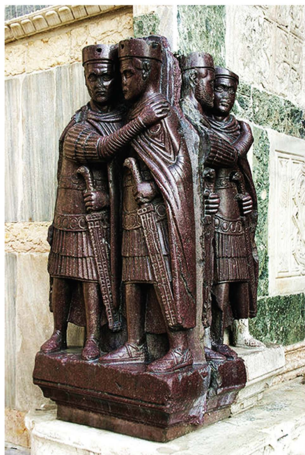
Sl. 1. Skupina tetrarha, Venecija.