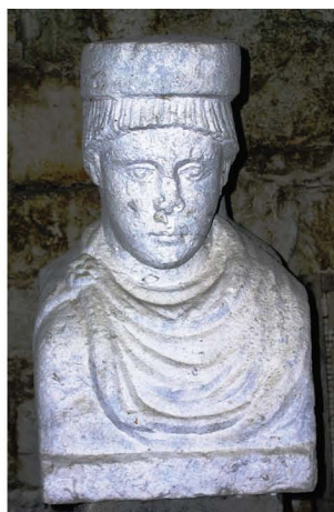
Sl. 3, 4. Herme s likovima tetrarha (?) i božanstava rijeka, Salona

Fig. 3, 4. Hermae with the images of tetrarchs (?) and water deities, Salona.