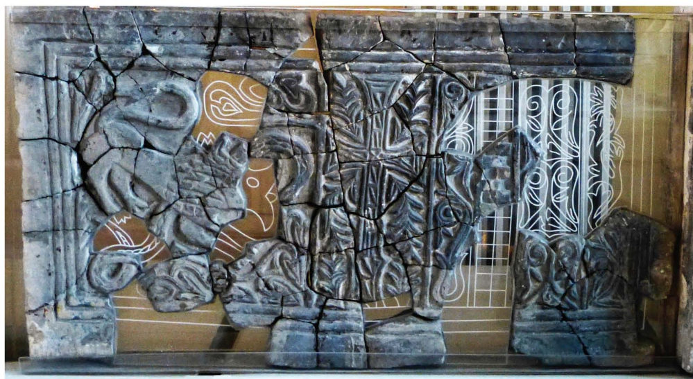
Sl. 5. Reljef oltarske pregrade ranokršćanske crkve, Bilimišće kod Zenice (Zemaljski muzej Sarajevo) / Fig. 5. A relief chancel screen of the early Christian church, Bilimišće near Zenica (The National Museum Sarajevo).