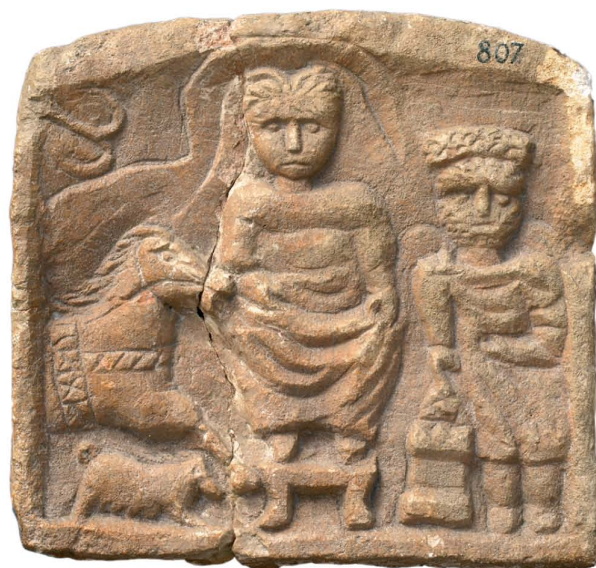
Sl. 4. Reljef navodne Epone, Koprno kod Unešića (Gradski muzej Šibenik) Fig. 4. A relief of presumed Epona, Koprno near Unešić (The Museum of Šibenik).