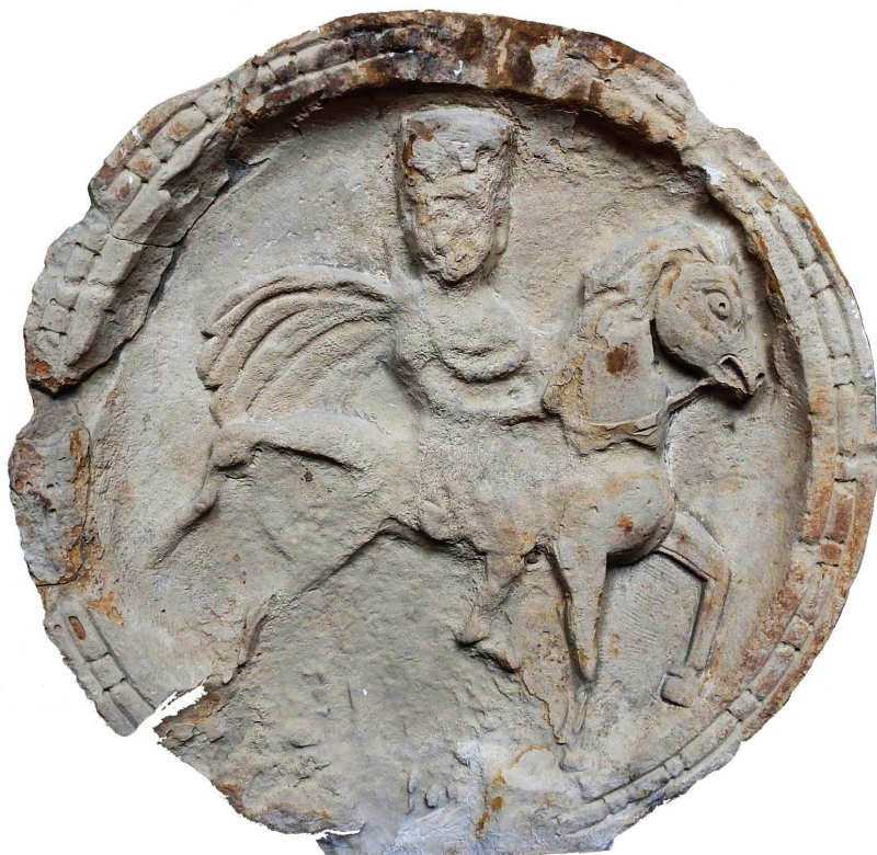
Sl. 1. Reljef s likom konjanika, Sarajevo (Zemaljski muzej Sarajevo) / Fig. 1. A relief with an image of a horseman, Sarajevo (the National Museum, Sarajevo).

glava je okrenuta pravo prema gledatelju. On je odjeven u dugu tuniku koja mu seže do koljena. Tunika je kratkih rukava, tako da su mu ruke gole. S jedne strane ruka je pred prsima a s druge paludamentum zakriva pogled tako da se ne može razaznati ima li konjanik oklop ili pak samo donju haljinu. Moguće je i jedno i drugo. Pouzdano se samo smije kazati da je tunika bila potpasana. Iza ramena se poput krila viori paludamentum . Na glavi je kapa koja ima kružni oblik (poput koluta sira). Rub kape na čelu je oštećen tako da izgleda kao da je nareckan, ali to su, kad se dobro pogleda, oštećenja kamene površine. Jasno je vidljivo da je rub kape na čelu imao dvostruko oivičenje poput uske urezane linije. Posrijedi je kapa koja se naziva pileus Pannonicus , krznena, kožna ili pustena vojnička kapa. Pojedinsti lica se ne vide jer su nestale oštećenjem površine reljefa, osim lijevog uha koje je neprimjereno veliko. Desnom rukom jahač drži uzde od kojih se vide, samo ondje gdje su se bolje očuvale, dvije trake od kojih je jedna bila u jednoj, a druga u drugoj ruci. Konjanik sjedi na sedlu pričvršćenom remenom, podvučenim ispod