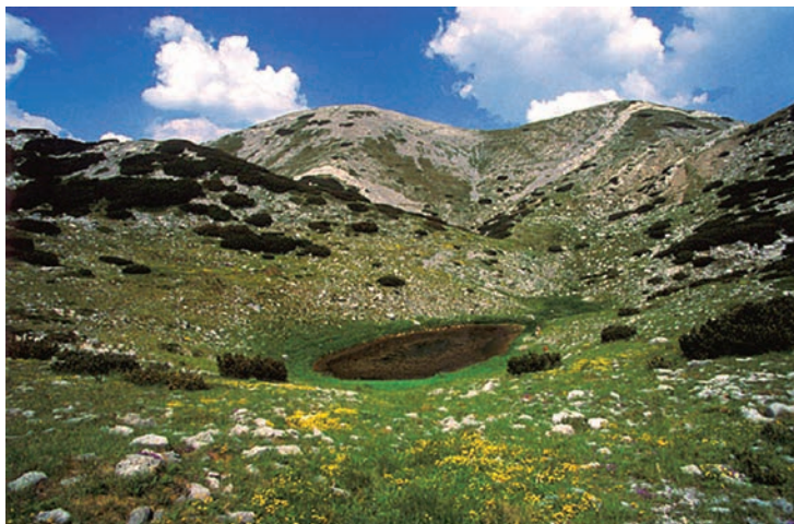
Babino Jezero/Lokva

(Adžić 2016: 43). Razlog tomu je nestanak stočarstva na Velebitu i „vila u suživotu s njegovim stočarima.“ Zato se jezero zvalo još i Vilinsko, jer su vile vodile brigu o njegovoj čistoći. Voda mu je bila vajik čista, jer su ga vile obnoć čistile i igrale kolo oko njega. I čistile su galebu. U njem je voda bila vajik istog raza i nikad ne bi prisušla. A biloj okruglo i duboko, nema dna. Blago se nije subitalo spuštati nogan u jezero, samo tliko da se napije, a mogaj i čovik pit tu vodu. 50