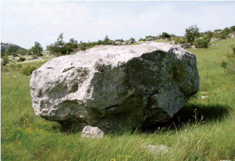
Malorujanska Baba 2

dokaživat, jer Babe više nema, al pantin kasan čobanija kaj klapac oko nje da san vidija na njoj žito kaj uklesano čekičen i dliton. Mi smo pod njon imal stanove. Nijet bila daleko od Bunara Jovića i Jaruge niz koju se slivala voda ozgo s Kose. Mojaj baba znala na prolće na nju stavt čup vune, daj to za zdravlje blaga. Bićej niko kamen razbija ol odnija, jer nije bija velk kaj uni na Malon Rujnu, a javor se osušija. Pod njin je bilo kolalište i pivalo se. Stariji su otprvo divanl da Kamena Baba nije od ovog naroda daj to uklesa narod kojij tu prije živija, niki Liburci, Grci, štot ja znan. 41 U terenskim istraživanjima 2016., velikorujanske Babe nije bilo in situ .