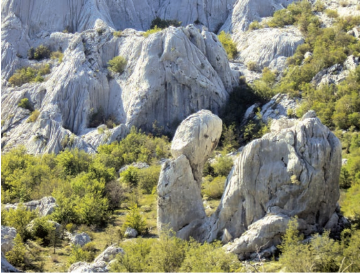
Jagin Kuk

Meteorološku ulogu u frazeologiji Podgoraca zadobila je i Velika Gospa Rujanska, budući da njezinim danom završava plodni i započinje neplodni ciklus godine: Pope, mol se ti za kišu do Gospe, a ja ću sam od Gospe ol Molte se svi vi za kišu do Gospe, a ja ću sam od Gospe. 46 U Bojinačkom Velikom Docu lociran je Jagin/Rogin Kuk , neobične morfologije koja neupućenima izaziva lascivne konotacije. Zapravo su dvije Jage: veća ozapad, a manja najerena odistok . U mitskoj simbolici ključna je najerena/falusoidna Jaga. Nepoznato je tko je i kada imenovao Kuk tim imenom, budući da to žensko ime ne postoji u antroponomastici Podgorja, premda ima istu simboliku kao Baba Roga kojom se plašilo neposlušnu djecu: Odnícete Baba Roga . Baba Jaga je mitski lik iz ruskih usmenih predaja i bajki, a kako je došao kao antroponim do Velebita, ostat će otvoreno pitanje. Jaga je drevna boginja, antropomorfno demonsko biće u kontaktu s onostranim/h tonskim, degradirana, groteskna ( najerena ) starica, seksualno neprivlačna, ambivalentna, zbačena sa svoga trona i pretvorena u rugobu koja vlada prirodnim silama. „Označujejo falični atributi in je s svojimi grotesknimi značilnostmi objekt negativnih emocij“ (Hrobat 2010: 223). U interpretaciji će biti povezane Jaga/Roga, budući da su oba lika istovjetna u mitskoj predodžbi o degradiranim boginjama Majke Zemlje u južnom Podgorju. Jaga/Roga/Morana utrojena je ostarjela boginja zime i smrti.