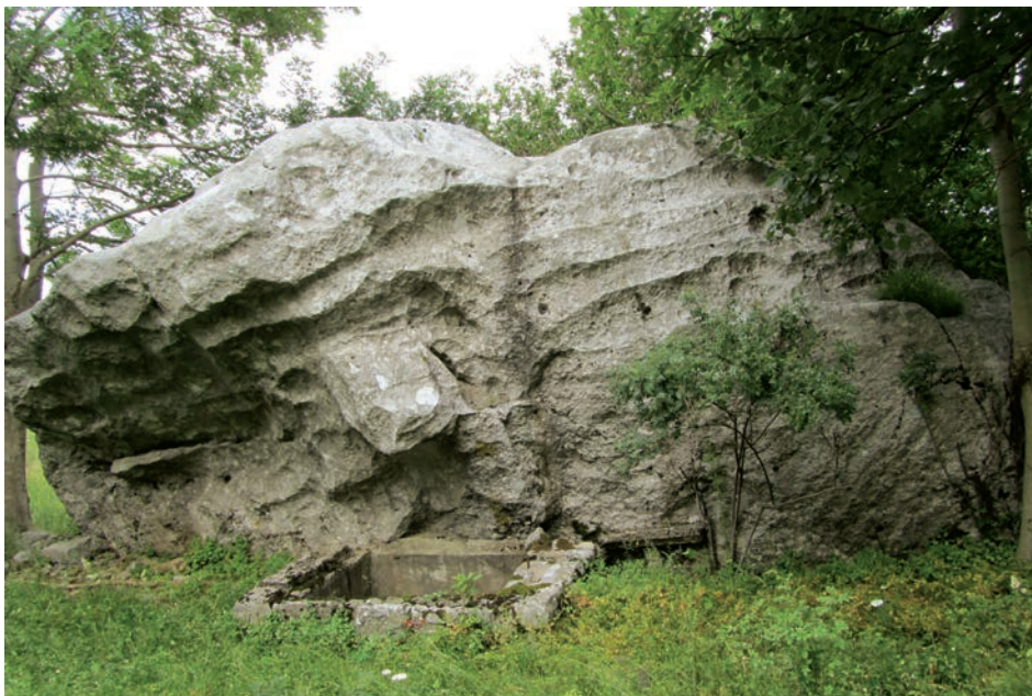
Baba Arčabuša

spolnosti vlage/vode iz koje se rađa novi život (Kipre 2014: 85). Štovanje ženskih kulturnih mjesta – kulturnih kamena na Velebitu, supstrat je naslijeđen još od Liburna ( Malo i Veliko Rujno, Libinje ). Okamenjene Babe imaju svoj odraz u podgorskoj frazeologiji: Ukipila se kaj kamena Baba, Skamenla se kaj kamena Baba , a diskursi su koji potvrđuju tradicijska vjerovanja i štovanja Babe.