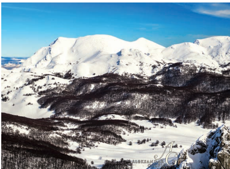
Babin Vr

Bapski toponimi motivirani pretkršćanskim religijskim supstratom u hodu kroz godinu, najbrojniji su unutar Nacionalnog parka. Vjerojatno je to zato što su tu planinski vrhovi znatno viši nego drugdje pa ranije započne zima i zapadne snijeg. Baba Zima/Morana gospodarila je tim prostorom i ostavila trajan supstratni biljeg mitske simbolike u krajobrazu Nacionalnog parka. Krajač ističe da su najviši vrhovi simboli kulturnih božanstava praslavenskog panteona. Raspoređeni su u krajobrazu prema svetim trokutima (V. Belaj, J. Belaj 2014: 55-56). U pučkim predodžbama Babin/Moranin Vr je personifikacija zime, tame i smrti. Baba zima u neplodnom ciklusu mete sve pred sobom: mete snig, zameja je snig, kija snig . Osim meteorološkog karaktera ona izražava i onostrani, liminalni svijet: solarni/nebeski i htonski/podzemni. Babin Vr u zimskom razdoblju slikovito dočarava Ledenu Babu u „ležećem“ položaju s „glavom“ na sjeveru, a „nogama“ prema istoku. Po sredini je istaknut „debeli bapski trbuh.“ Oronim je u metaforičkom smislu jedinstven primjer „ležeće Ledene Babe “ na Velebitu. U meteorološkom smislu zimi Babin Vr najjače kuva i kija obavijen maglom i oblacima. Ledena Baba ide po gori i šulja se po dolu . Ona je Smrtovka koja usmrćuje mikrokozmos u zimskom ciklusu (Hrobat 2010: 213). Ispod Babinog Vra je Babino/Vilinsko Jezero , motivirano postojanjem vode. Danas je to samo lokva s tendencijom ubrzanog presušivanja