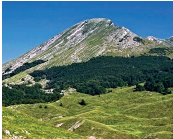
Sveto Brdo

Mitološki sustav vjerovanja u tradicijskoj kulturi južnih Podgoraca obilježio je toponimiju i topografiju prostora Nacionalnog parka i njegovog šireg okruženja. Velebit je zbog svoje osobite geomorfologije prostornih struktura mitska planina u kontinuitetu od prvih indoeuropskih do ranosrednjovjekovnih i starohrvatskih doseljenika. Elementi mitološkog sustava vjerovanja osobito su prisutni u toponimima vilinske i bapske topografije. Prema mitskim predajama i recentnim pisanim izvorima uspostavlja se kontekst pretkršćanske starine kada se u emanaciji i epifaniji događala sakralizacija krajobraza južnog i jugoistočnog Velebita. Ti su prostori označavali svetost i predstavljali energetske točku božanske sile, mjesto gdje se neka svemirska sila koncentrira i grana, kao što su raskrižja, mirilišta, Sveto Brdo , Dušice , izvori, vode, pećine, crkvine i druga. Treba napomenuti da ovdje nisu iscrpljeni svi tragovi mitske toponimije u topografiji južnog Velebita, čije tragove možemo pratiti i prije starohrvatskih mitskih predodžaba.