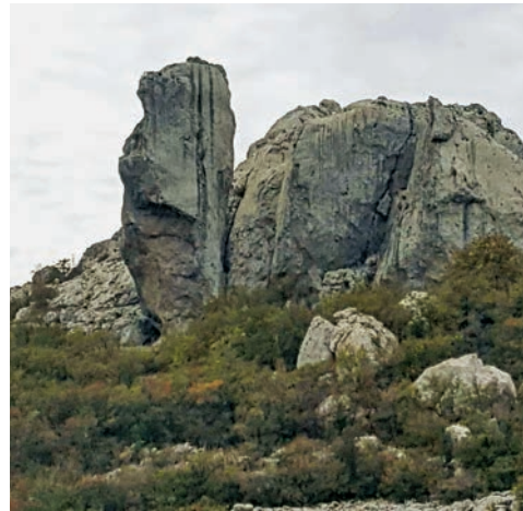
Po(d)grizen (snimila M. Trošelj)

vrhu kuka, na suhom, Veles u dolini, vodi ( Duboki ), a vila/Mokoši sjedinjuje oba toposa na prostoru Malog Rujna , neodvojivog dijela vilinskog svijeta i njihovog te-lurnog simbolizma koji ih veže uz Majku Zemlju (Kipre 2014: 100). Une su razapele uže od Kuka Vilina do Po(d)grizena. Po užu su gole prolazile priko malorujan-ske vode. Vidija i jedan čoban i une su za dišpet prilile vodu cigljin s Malog Rujna u Duboki. Takoj Malo Rujno postalo pasište, kojey u davno doba bilo svo pod vodon. Na isušenon Rujnu blagoj paslo, a u Dubokon Jezeru se napajalo. Obnoć su vile čistile jezero od galebe i ujtro niko neb reka daj' tu blago paslo i pilo vodu. Al sada jezera više nema, produšlo se u Drugon ratu, 1941. Poslej na produši niknilo crno trnje. Obnoć su igrale kolo kod Ogrede Lazića