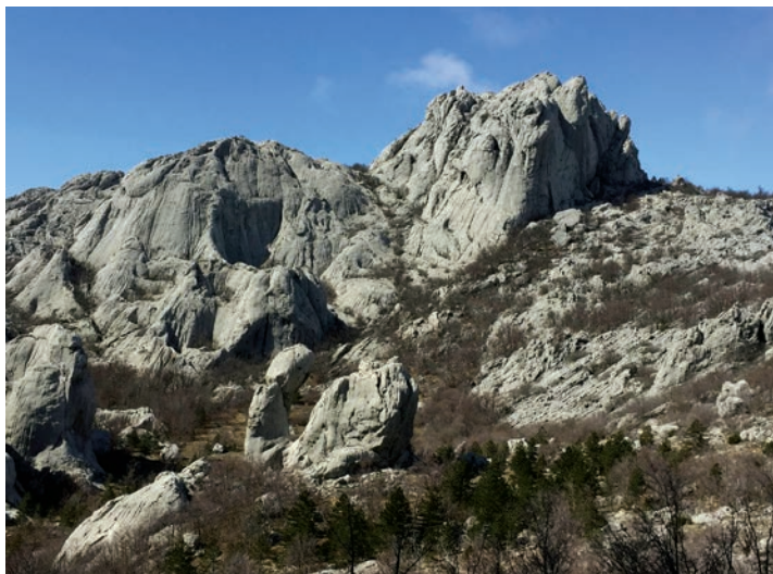
Bojinac-Bojin Kuk

bu na Bojincu Perunov suparnik Veles predstavljen je ženskom inačicom Velom/Bojom. Udarom groma kao dijela kozmičke strukture, uspostavlja se suodnos između kozmogonijskog mita o Perunovom sukobu sa zaprječnikom/zaprječnicom voda zmajem/zmijom. On oslobađa vode od Velesovih zoomorfnih supstututa na kraju vegetacijskog ciklusa, kada božanski par Mara i Jure postaju stari. Pastirica Boja supstitut Vele ulaskom u neplodan ciklus ubija Juru i na kraju kao Morana, vladar zime umire do uskršnuća u novom ciklusu plodnosti (Kipre 2014: 94; Hrobat 2010: 217). Na dan Gromovnika Ilije, Perunove alopersoneže (bilo po Gregorijanskom, bilo po Julijanskom kalendaru) događalo se da Gromovnik po-mete/smrzne/prisiče pojedince oko rujanskog prostora i to na liminalnim topovima kao što su Ribnička Vrata, Vrata na Križu prema Aptovačkoj Kosi, Jelovčka Vrata, Prag i Kraljičina Vrata . Ako netko kosi na dan Gromovnika Ilije u Lici govorilo se: Prisvitl, prisvitl Sveti Ilija i nama pukne grom i ubije čovka i njegove konje . 43 U simbolici Bojinca ključan je i njegov meteorološko-temporalni karakter. Po njemu su Podgorci predviđali vrijeme, osobito oni koji su ribarili. Bilaj kapa ol brv nad Bojincon – bura će. Bojinac svitli – bura će. Čara nad Bojincon – lipo će vrime. Bojinac kuva – velko će nevrime s buron, škropcon i snigon. Kija od Bojinca. Kad zabili Bojinac, ne izlaz iskuće . 44 Kad snig pada, najprije ga vidiš na Bojincu . 45