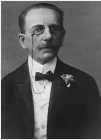
Sl. 3. Rudolf Desselbrunner

iskustvo stjecao u zagrebačkoj Dioničkoj tiskari i kasnije u Primorskoj tiskari u Kraljevici. 30