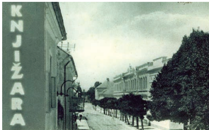
Sl. 8. – Razglednica središta Gospića s reklamnim panoom Kolačevićeve knjižare u prvom planu (putovala 1919.)

vodeći ljudi Hrvatske zajednice. Pokretač i jedan od vlasnika Ličkih novina gospićki odvjetnik Mile Miškulin 60 i novi vlasnik knjižare i knjigovežnice Kolačević krenuli su u zajednički projekt te su uz novine, kao novost na lokalnom tržištu najavili izlaženje godišnjaka Ličkog kalendara . 61 Tiskara je dobila službeno ime „Lika“ te je zajedno s Kolačevićevom knjižarom i papirnicom prostor našla u prizemlju poslovne zgrade Prve ličke štedionice (vidi fusnota 47). Upečatljiv segment Kolačevićeve knjižarske ponude bile su razglednice Gospića, pa je kroz sljedećih dva desetljeća upravo on bio izdavač najšireg opsega razglednica s raznoraznim motivima grada, a posebno mjesto zauzimaju one na kojima je u prvom planu njegova knjižara i papirnica (vidi sl. 8. i sl. 9). Odabirom ovakvog motiva, Kolačević je evidentno vizualnom dojmljivošću nastojao stvoriti reklamu svoje djelatnosti. Kroz knjižarsku i tiskarsku djelatnost, Kolačević je vrlo brzo postao jedan od značajnijih gospićkih poslovnih ljudi. Godinama je obnašao funkciju potpredsjednika podružnice planinarskog društva „Visočica“, bio je jedan od utemeljitelja gospićkog Trgovačkog udruženja, tajnik sokolskog društva, blagajnik pjevačkog društva „Hrvat“ (Brlić 2017: 198-208). Oporbena politička aktivnost urednika Mile Miškulina učestalo se negativno odražavala na tiskarsku i izdavačku djelatnost tiskare „Lika“, pa je osim