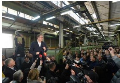
Slika 2. Predsednik Srbije u Trsteniku, 24.2.2019.