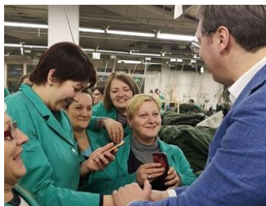
Slika 4. Predsednik Srbije u Vranju, 8.2.2019.