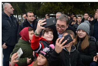
Slika 6. Predsednik Srbije u Tutinu, 22.2.2019.

Izvor: Screenshot, Instagram, @buducnostsrbijeav