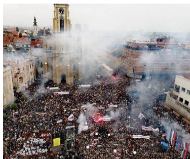
Slika 11. Skup u Novom Sadu, 11.4.2019.