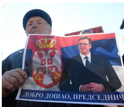
Slika 8. Građanin Velike Drenove, 24.2.2019.