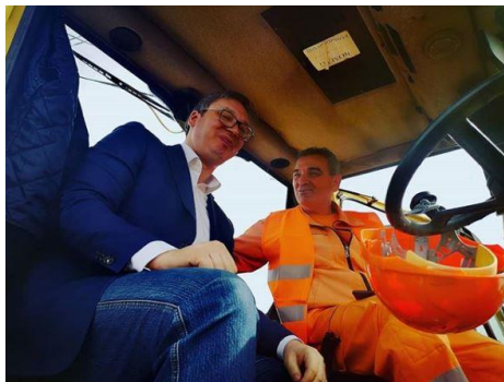
Slika 3. Predsednik Srbije u Indiji, 8.3.2019.