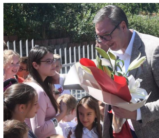
Slika 7. Predsednik Srbije u Brusu, 19.8.2021.