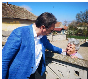
Slika 17. Predsednik Srbije u Žabarima, 6.4.2019.