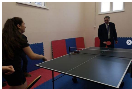
Slika 14. Predsednik Srbije u Kovinu, 10.2.2019.

Izvor: Screenshot, Instagram, @buducnostsrbiyeav