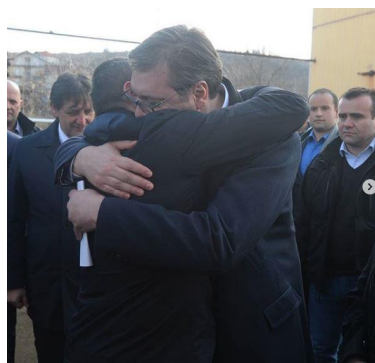
Slika 9. Predsednik Srbije u Kruševcu, 24.2.2019.