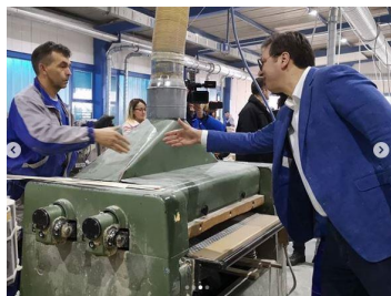
Slika 16. Predsednik Srbije u Vladičinom Hanu, 8.2.2019.