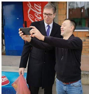
Slika 13. Predsednik Srbije u Glogonju, 10.2.2019.