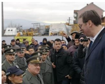
Slika 1. Predsednik Srbije u Vranju, 8.2.2019.