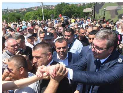
Slika 10. Predsednik Srbije u Kragujevcu, 28.6.2021.

Izvor: Screenshot, Instagram, @buducnostsrbiyeav