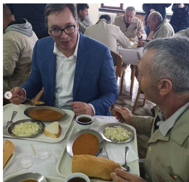
Slika 12. Predsednik Srbije sa radnicima „Simpa”, 8.2.2019.