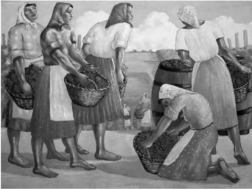
Beračice sa korpama grožđa; 1942. ulje/ platno VI. Galerija slika "Sava Šumanović" u Šidu

Isusa Hrista, slaže sa brojem figura koje je naslikao. Prosto je neverovatno da je Sava Šumanović slučajno došao do svih ovih detalja i da je sve nastalo spontano. Mi želimo da verujemo da je Sava Šumanović za kraj nama ostavio poruku, i da je to razlog zašto je na kraju života naslikao ovaj triptih. 51