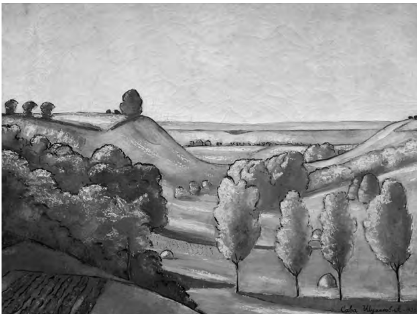
Dolina "Kukavice", 1938; ulje/ platno VI. Galerija slika "Sava Šumanović" u Šidu

u šidsku crkvu, najveću i najvažniju građevinu ovog malog sremskog mesta. Sava je taj prizor gledao svakog dana.