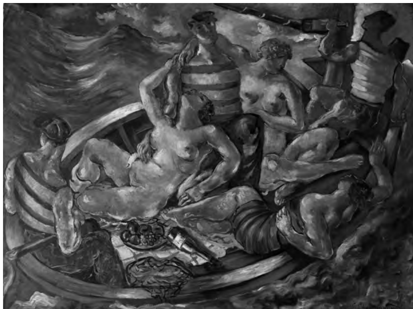
Pijana lađa, 1927, ulje/ platno; vl. Muzej savremene umetnosti, Beograd

više se ne zna ko je kapetan – ili su svi kapetani – a brod se prevrće čas na jednu čas na drugu stranu”, kaže istoričar Milan Ristović 20 , inače zaljubljenik u delo Save Šumanovića. Ova Šumanovićeva slika, smatra on, može se pročitati i kao anticipacija fašizma koji će uskoro gurnuti svet u katastrofu.