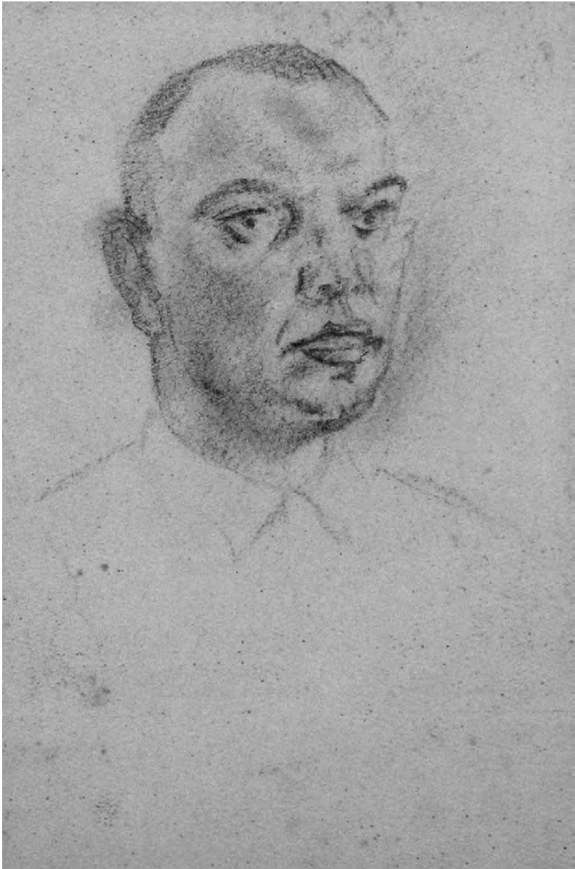
Autoportret, olovka/papir; 1933 — 1935. VI. Galerija slika "Sava Šumanović" u Šidu