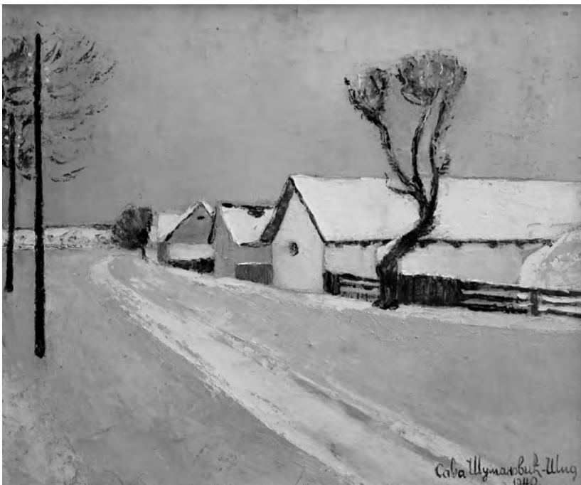
Periferija Šida, 1940. ulje/ platno VI. Galerija slika "Sava Šumanović" u Šidu