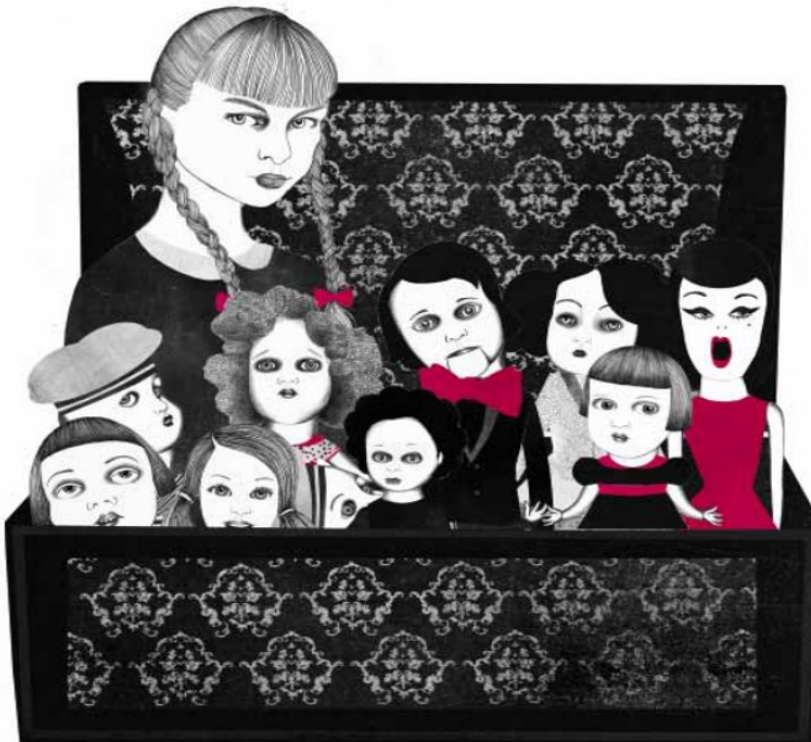
Slika 1: Ilustrirala Sara Morante

Sestra i ja užasnute smo ugledale bakinu kuću lutaka kako gori u kutu naše sobe. Nekako smo jastucima uspjele ugušiti požar pa poput dvaju uznemirenih divova provirile unutra. Plamenovi su zacrnjeli šarene tapete, a ostaci namještaja stršili su kao kostur pougljenjene ptice. Kašljale smo sve do stuba. Prazne oči ogledala zrcalile su samo trag od pepela koji je lebdio u zraku, pa smo malim prstom razvalile vrata spavaonica na drugom katu, strepeći od onog najgoreg. Usamljena