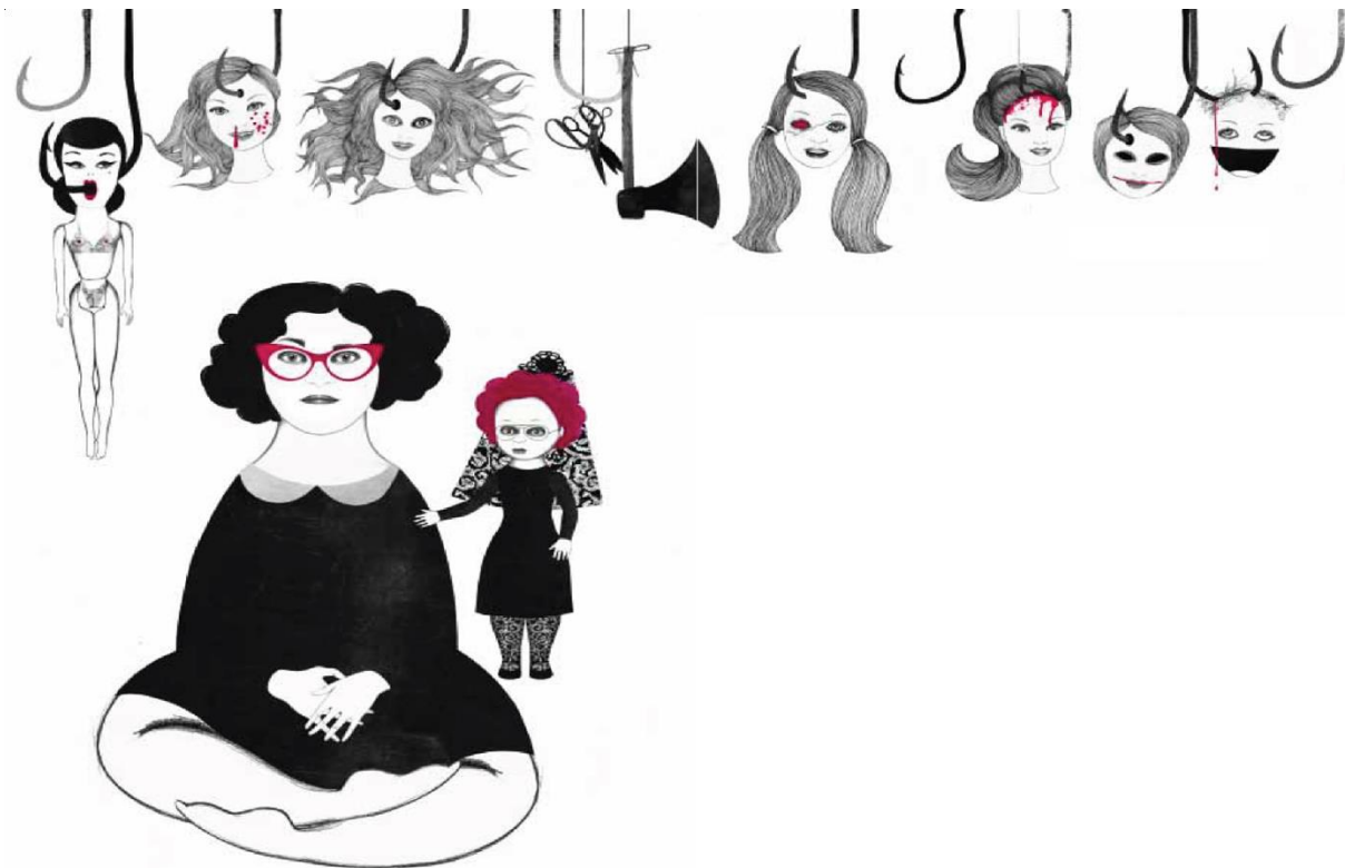
Slika 3: Ilustrirala Sara Morante

Zanimjela je prvi put otkako je poznajem. Oprezno sam pričekala. Nije bilo reakcije, pa sam joj tragičnim glasom saopćila da sam čula liječnika kako govori mojim roditeljima da umirem od tuberkuloze. Tu-ber-ku-lo-ze, izgovorila sam u slogovima. Jako ću smršavjeti i pljuvati krv u maramicu. Neću napuniti ni jedanaest godina. Lutka je to prihvatila nekako nemarno i usmjerila svoj ledeni pogled u neku točku iza mojih leđa, možda u smjeru police koja je pripadala mojoj mlađoj sestri. Te iste noći, dok sam lijegala u krevet, majci sam čudnim odraslim glasom saopćila da sam odlučila s kojim igračkama želim biti pokopana.