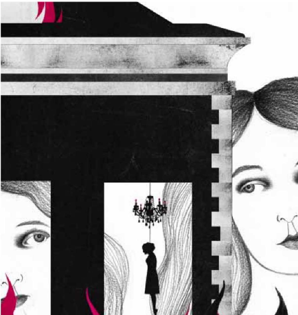
Slika 2: Ilustrirala Sara Morante

Lijepa je blizanka voljela slušati pseći dah svoje sestre, znati da je budna u olujnim noćima i da bdije nad njezinim mirnim snom. Zabranjujem ti da spavaš, govorila bi joj, ne smiješ zaspati prije mene, a ako dođe čudovište, neka prvo pojede tebe, i dok te bude proždiralo, upozorit ćeš me, a ja ću imati vremena uteći. Ružna je blizanka kimala. Bila je poslušna i zadržavala je dah, vrpcom joj vezala haljinu, laštila njezine bijele lakirane cipele, što god je zaželjela za nju je bila zapovijed, neopoziva želja savršena bića, idealizirane inačice nje same. Tako je malo nedostajalo da to bude ona, ali to ipak nije bila. Ružna blizanka nastavila ju je češljati svake noći, ravnala je svaki pramen