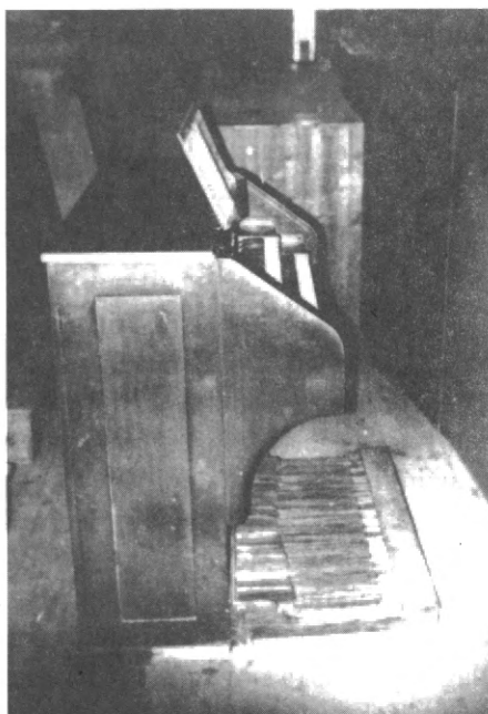
Slika 3. Sviraonik

Manuali su široki 75 cm, a klavijatura od 54 tona obuhvaća tonove od C do f 3 , a kod Callidovih orgulja klavijatura je obuhvaćala tonove od G - f 3 . Duljina bijelih tipaka iznosi 13 cm, a širina 2,2 cm. Crne tipke, od ebanovine, duge su 8 cm, a široke 1 cm. Na sredini sviraonika iznad manuala smješten je stalak za note, a na okviru povrh II manuala nalaze se registri za manuale i pedal, kao i kazaljka od valjka za crescendo. Ispred I manuala nalaze se natpisi za kolektive piano, mezzoforte, forte, i jedna slobodna kombinacija. S lijeve strane nalazi se ugrađen ukidač za valjak. Spojevi manualcopel i pedalcopel uključuju se nogom.