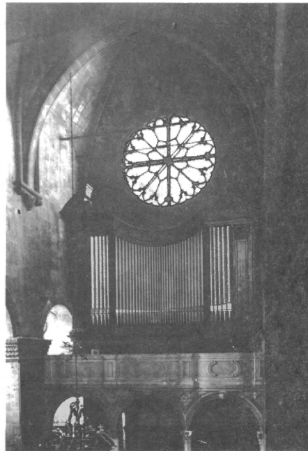
Slika 2. Orgulje Milana Majdaka

Orgulje Milana Majduka smještene su na isto mjesto gdje su bile i Callidove, dakle na koru iznad glavnog ulaza u katedralu. Visoki ormar orgulja izrađen je iz jelova drveta, naslonjen na Radovanov portal. Tako je rekonstruiran da je velika rozeta ostala potpuno vidljiva, što je veliki plus i doprinos katedrali kao umjetničkom spomeniku. Prospekt orgulja okrenut je prema glavnom oltaru, a rese ga svirale violinskog principala i celobassa 8'. Na vrhu ormara, sa svake strane, nalazi se po jedna barokna figura.