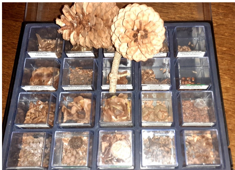
Slika 2. Zbirka šumskog sjemena za edukaciju studenata Figure 2. Forest seed collection for student education

Na terenskim istraživanjima, studenti su imali zadatak prikupiti sjemena koja su bila dostupna na istraživanom području, utvrditi tip sjemena i plodova, stupanj zrelosti, sadržaj vlage u sjemenu, stupanj uroda sjemena i način transporta do rasadnika. Od važnijih šumskih vrsta s kojima su se studenti detaljnije upoznali kako teorijski, tako i praktično, jesu: mezijska bukva ( Fagus moesiaca (Domin, Maly) Czecz.), obična smreka ( Picea abies (L.) H. Karst.), ilirski crni bor ( Pinus nigra subsp. illyrica ), hrast medunac ( Quercus pubescens Willd.), hrast cer ( Quercus cerris L.), obična jela ( Abies alba Mill.) i druge.