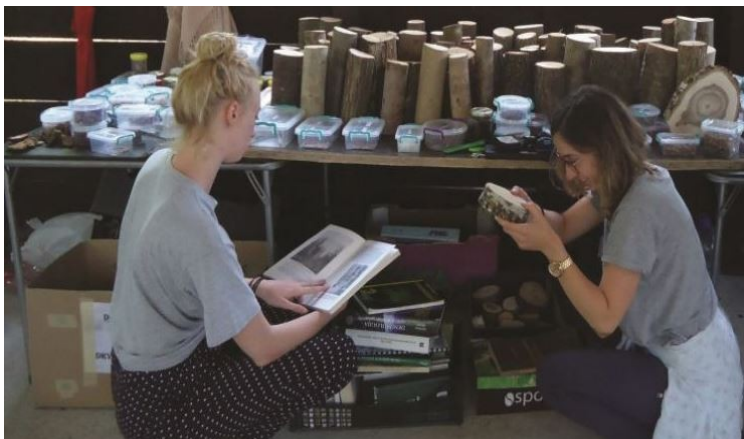
Slika 3. Studenti na dendrološkoj radionici Figure 3. Students in a dendrology workshop

Tijekom terenskih istraživanja i teorijske edukacije studenti su se upoznali sa biljnim vrstama navedenim u Tablici 2.