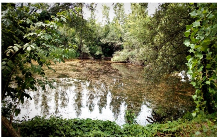
Slika 6. Poplavne šume (higrofilna vegetacija) na području Eko-centra "Jezera" Figure 6. Flood forests (hygrophilic vegetation) in the area of Eko-centar Jezera