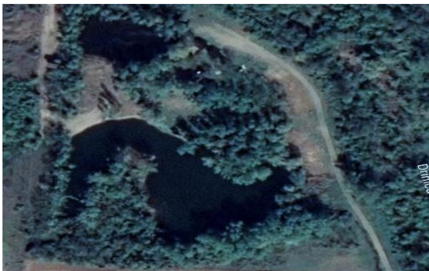
Slika 1. Geografski prikaz istraživanog područja

2001; Vojniković et al., 2017.); Šumsko sjemenarstvo (Dorbić et al., 2018; Gurda, 1999; Kajba i Balian, 2007; Mataruga et al., 2013; Mekić, 1997; Mekić, 1998.)