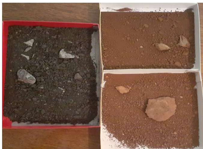
Slika 4. Odabrane vrste tala za vježbu Figure 4. Selected types of soils for exercise

Područje Eko-centra "Jezera" kao što je već i spomenuto nalazi se u nizinskom vegetacijskom pojasu, u zoni poplavnih (ritskih šuma) (Slika 6). Najugroženija vrsta kao posljedica djelovanja čovjeka, a nešto manje klimatskih promjena je europska crna topola ( Populus nigra L.) koja se smatra vrstom u nestajanju iz dva razloga: 1) zbog prisustva gena američke crne topole ( Populus deltoides W. Bartram ex Marshall.), u populacijama europske crne topole ( P. nigra ); 2) prirodne populacije ove vrste znatno su smanjene pod utjecajem čovjeka, izravnom sječom ili zahvatima u staništu (regulacija velikih tokova rijeka, izgradnja nasipa i zaštita obala), što je prouzrokovalo sprječavanje plavljenja i uvjetovalo fragmentaciju ritskih staništa te izumiranje autohtone vrste topole, čija je prirodna obnova onemogućena. Navedena vrsta se ubraja u najugroženije drvenaste vrste Europe.