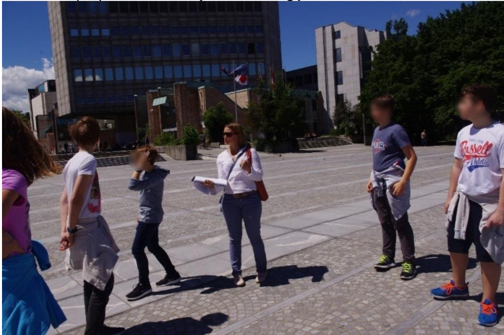
Slika 3: Obilazak Ljubljane pod vodstvom kustosa Zavoda za zaštitu kulturne baštine Ljubljana

susjedstvu. U zaključku rada se tvrdi da su promjene u prijevoznim sredstvima, prometu, kao i urbanistički i arhitektonski zahvati utjecali na način života djece, lišavajući ih adekvatnog mjesta za druženje. Kao dodatne primjere istraživačkog rada možemo navesti "Mi i klimatske promjene" i "Posjeti planinskim kolibama u Julijskim Alpama učenika osnovne škole Majde Vrhovnik". U sklopu izvannastavnih aktivnosti organizirana je suradnja sa Zavodom za zaštitu kulturne baštine Ljubljana. Konzervatorica u institutu predstavila je svoje zanimanje tijekom vođenog obilaska ljubljanskih kulturnih spomenika uz potporu informacijske tehnologije.