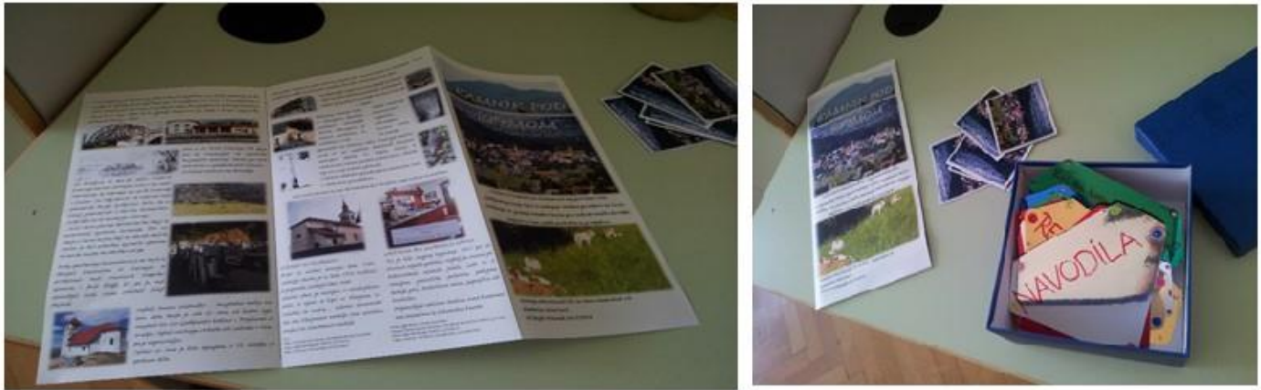
Slika 6: Kreativna prezentacija mjesta (Autor: Nina Farič)

Kamnik pod Krimom, malo selo u općini Brezovica. Izradili su i turistički suvenir za Kamnik pod Krimom u obliku igre lova na blago koja se bavi kulturnom i prirodnom baštinom mjesta.