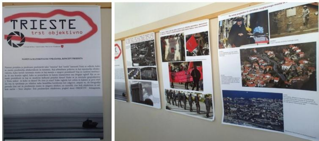
Slika 2: Fotografska studija Trsta i njegove zajednice (Autorica: Nina Farič)

Studenti mogu, prema svojim interesima, sami odabrati mentora za svoj istraživački ili projektni rad. Primjerice, jedan od učenika izradio je projekt u obliku serije plakata. Nakon ekskurzije u Trst u sklopu nastave geografije, predstavio je fotografsku studiju grada i njegove zajednice. Njegovu objektivnu foto prezentaciju pratio je i teorijski dio. Cijeli projekt predstavljen je na godišnjem Susretu mladih istraživača u organizaciji Gradskog vijeća Ljubljane.