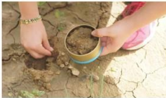
Slika1: Terenski rad

Izvannastavne aktivnosti u okviru predmeta uključuju pripreme za različite razine natjecanja u znanju geografije. Studenti proširuju i produbljuju svoja teorijska znanja proučavanjem potrebnih izvora i literature, a također se upoznaju s metodama rada na terenu. Natjecanje u znanju zemljopisa organizira Zavod za školstvo na školskoj, područnoj i državnoj razini. Posebnost natjecanja je u njegovoj podjeli na dva dijela: teorijski, na temelju zadanih pisanih izvora, te praktični, koji se odvija na terenu, gdje učenici, prema pravilima, promatraju, mjere, bilježe i zaključuju. Nakon praktičnog dijela slijedi ispit koji se temelji na terenskom radu. Opseg pitanja obuhvaća pet kompleksa: orijentaciju, terensko mjerenje i utvrđivanje, prirodno-geografsko zaključivanje i pojašnjenje, društveno-geografsko zaključivanje i pojašnjenje te izračune i statističko dokazivanje.