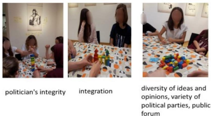
Slika 4: Prezentacija ideja u obliku 3D strukture u muzeju

Ambrusa, druga je djelovala u korist romske zajednice, dok je treća skupina djelovala kao sudsko vijeće koje je prema iznesenim argumentima donijelo svoju odluku. Na kraju radionice sve tri grupe predstavile su svoje ideje u obliku 3D strukture, omogućujući im da shvate različitost društva kao temelj za poštovanje i toleranciju (most = integracija, stup = integritet političara, šarena tvrđava bez krova s vratima na sve strane = raznolikost ideja i mišljenja, raznolikost političkih stranaka, javni forum).