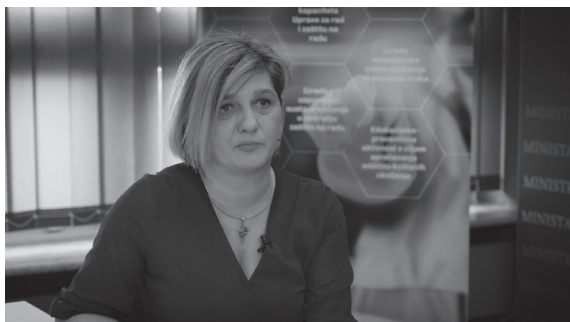
Marina Borić, načelnica Sektora za zaštitu na radu u Ministarstvu rada, mirovinskog sustava, obitelji i socijalne politike

Jedan od ključnih temelja učinkovitog upravljanja zaštitom na radu su alati za procjenu rizika. To je sveobuhvatni postupak koji provodi poslodavac i kojim se utvrđuju opasnosti, štetnosti i naponi koji mogu uzrokovati štetne posljedice za zdravlje radnika ali i radni proces. Cilj je da se rizici na mjestima rada uklone ili smanje. Metodološka online aplikacija za procjenu rizika Risko omogućit će pregledan uvid u sve rizike koje treba procijeniti, a isto tako i da se poslodavci i radnici upoznaju s ovom zakonskom obvezom. Ujedno, Risko će omogućiti izradu procjene rizika u svim gospodarskim djelatnostima. Prema riječima Marine Borić, načelnice Sektora za zaštitu na radu u Ministarstvu rada, mirovinskog sustava, obitelji i socijalne politike , nužno je da poslodavci shvate važnost prevencije i kontinuiranog ulaganja u sustav zaštite na radu. - Prema podacima europskog istraživanja, 1 euro uloženi u zaštitu na radu poslodavcu se vraća dvostruko. S druge strane, važno je da i radnici shvate važnost sigurnog rada; da shvate da postupajući u skladu s propisima štite svoje zdravlje, svoj život te neposredno i svoju obitelj. Samo odgovornim pristupom i ponašanjem možemo unaprijediti ovaj sustav – zaključuje Borić.