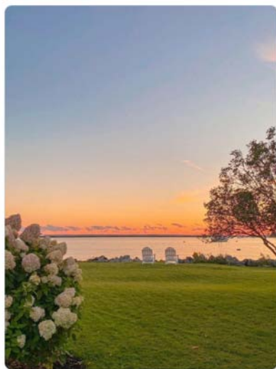
Primjer 1. Mentalno sam ovdje