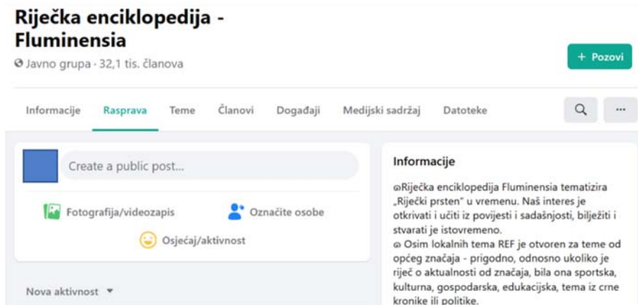
Slika 3. Facebook grupa Riječka enciklopedija – Fluminensia (REF)

Organizira se oko tema povezanih s gradom Rijekom i područjem riječkoga prstena, a fokus joj je na prošlosti i sadašnjosti toga područja. Članovi grupe su većinom osobe koje obitavaju na tome području, no u grupi participiraju i članovi koji s mnogih drugih osnova – obiteljskih, poslovnih, profesionalnih i inih – nalaze interes u riječkim temama. Zbog tenzija nastalih uglavnom po ideološkoj osnovi u danome trenutku dio je članova iz ove grupe istupio, što je rezultiralo nastankom nove grupe slična imena i slične koncepcije: Nova riječka enciklopedija – Fluminensia (NREF). Nova je grupa regulirana kao privatna mreža, što znači da samo članovi imaju pristup njezinu sadržaju, dok je ranija grupa bila i ostala regulirana kao javna, što znači da su sadržaji vidljivi svima na mreži. Izvor: Facebook grupa Riječka enciklopedija – Fluminensia. https://www.facebook.com/groups/254502667896499 . Pristupljeno 25. ožujka 2022.