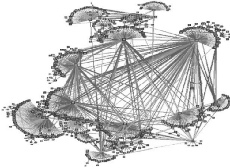
Slika 4. Slika iz knjige Jana A.G.M. van Dijka The Network Society. Social Aspects of New Media (2006: 32) prikazuje povezivanje manjih sfera socijalne stvarnosti u dinamičke mrežne procese.

mim medijem te njime omogućenim načelima kodiranja i autoidentificiranja (primjerice uporabom lozinki), izopćavanja, dopuštenih razina pristupa i sl. Potonjim se aktualiziraju mogućnosti selekcije i ekskluzije neželjenih pristupnika komunikacijskom procesu ili dijelovima toga procesa. Naposljetku, mrežno ustrojavanje komunikacije aktualizira i pitanja sigurnosti odnosno vulnerabilnosti digitalnoga medija, pa stoga već i samo sudjelovanje u procesu komuniciranja povlači i pitanja izloženosti i zaštite privatnih podataka te identiteta korisnika. Sve to daje novu težinu i pitanjima povjerenja i nepovjerenja te aktualizira i problematiku mnogobrojnih psiholoških i socijalnih preduvjeta učinkovita komuniciranja u eri novih medija.