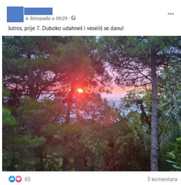
Slika 1.

Evo primjera jedne takve poruke, preuzete s društvene mreže Facebook: