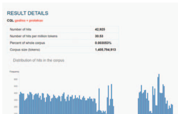
Slika 3. Statistički podaci za kombinaciju godina + protekao

Pretraga u kontekstu određene kombinacije riječi daje i statističke podatke o sveukupnome broju pojavljivanja u korpusu, broju pojavljivanja na milijun pojavnica, o postotku zastupljenosti u cijelome korpusu te o veličini korpusa odnosno pojavnica (tokena), što ilustrira Slika 3.