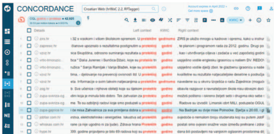
Slika 2. Prikaz primjera u kontekstu za natuknicu protekao

Pretraga u kontekstu određene kombinacije riječi daje i statističke podatke o sveukupnome broju pojavljivanja u korpusu, broju pojavljivanja na milijun pojavnica, o postotku zastupljenosti u cijelome korpusu te o veličini korpusa odnosno pojavnica (tokena), što ilustrira Slika 3.