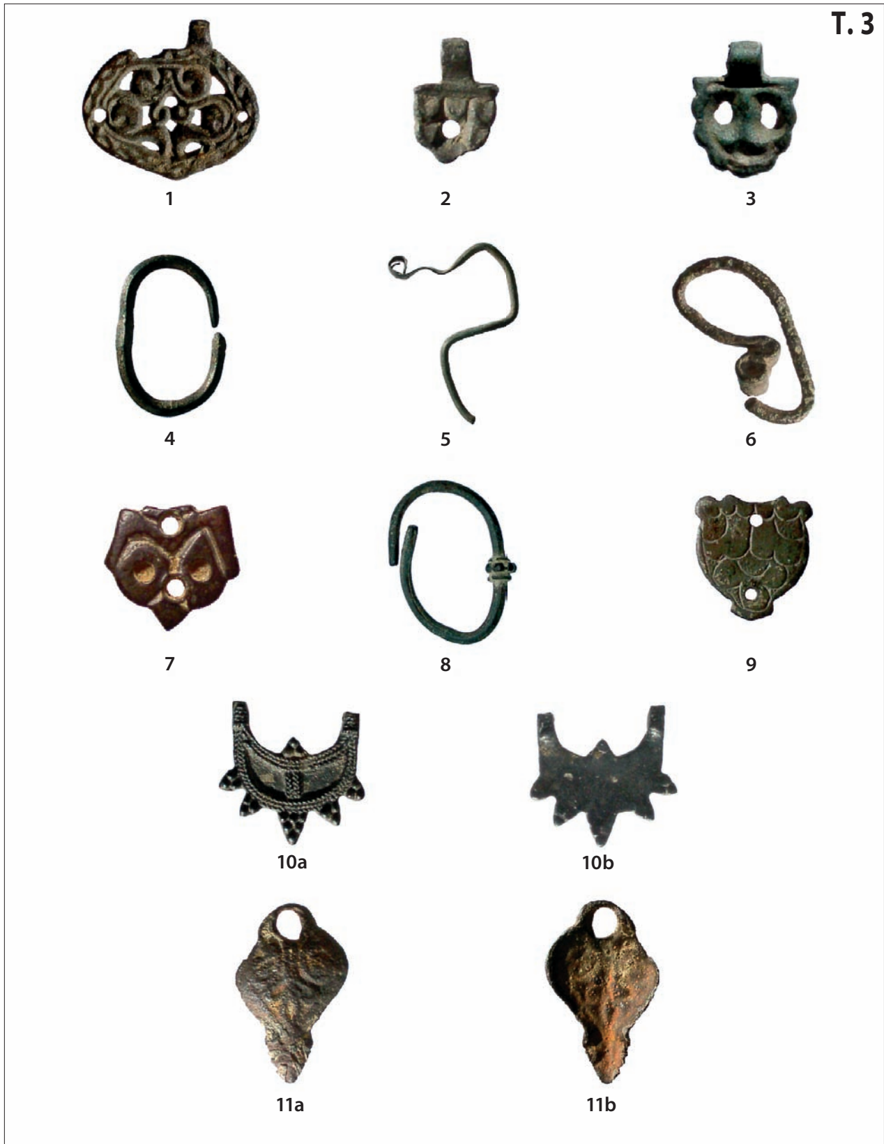
T. 3: 1-4, 7-10a-b Sotin-Vrućak; 5 Sotin-Jaroš; 6, 11a-b Sotin-Dunav