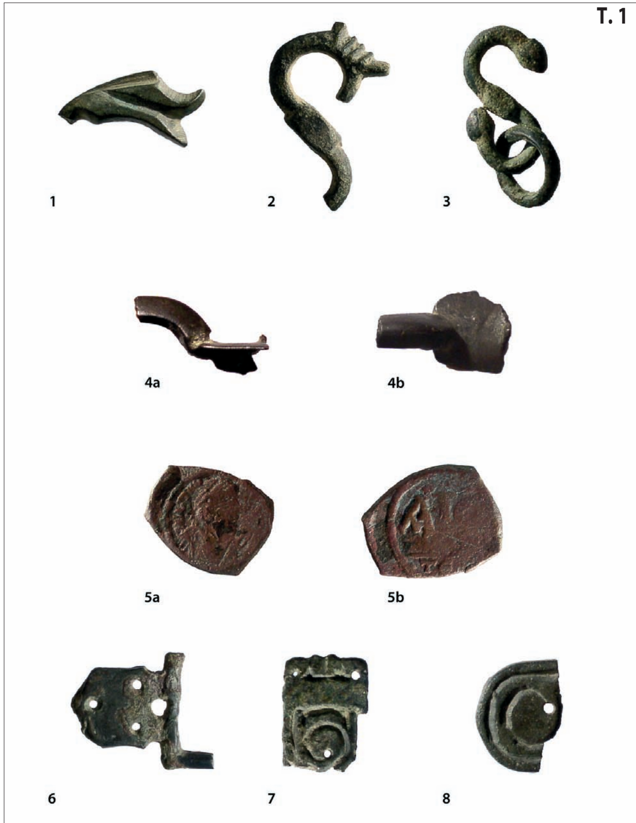
T. 1: 1-4, 6-8 Sotin-Vrućak; 5a-b Sotin-Jaroš