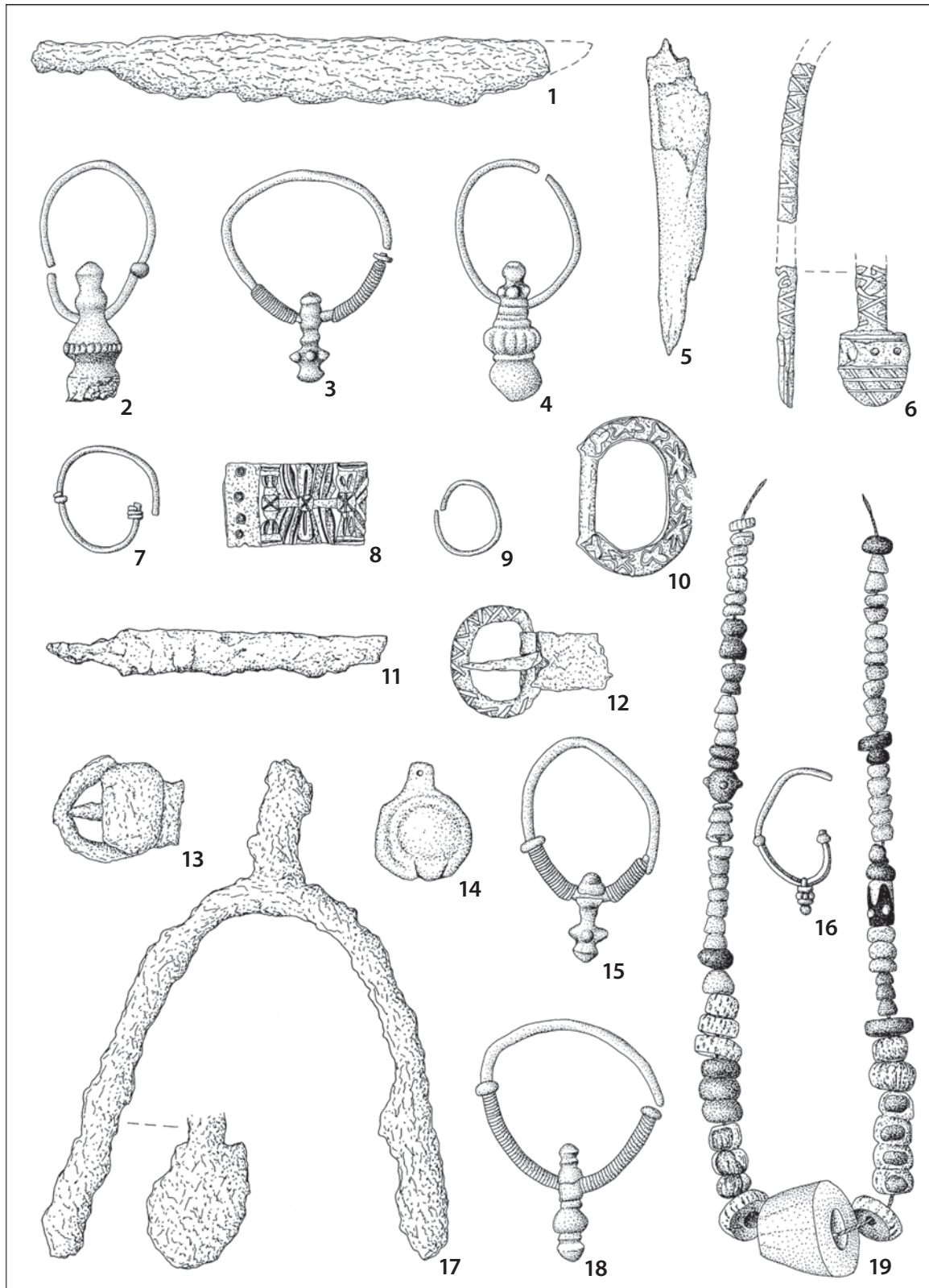
Obr. 3 Výber predmetov pohrebného inventára: 1-4,7,9,15-16,18-19 – Nitra-Zobor-Lupka; 5,13-14,17 – Mužla-Čenkov-Vilmakert; 6,8,10,12 – Nitra-Staré Mesto-Hrad; 11 – Nitra-Zobor-Dolnozoborská cesta