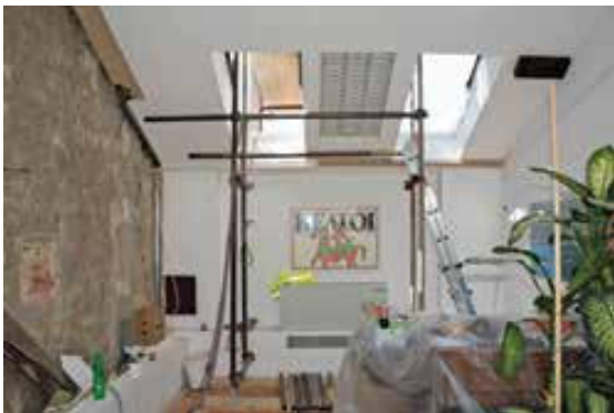
Slika 3. Šteta na južnom zabatu zgrade.

nije dočekala svečano paljenje muzejskih reflektora, međutim dočekala je mrežno predstavljanje na šestome Međunarodnom festivalu arheološkog filma u Splitu u vidu tematski snimljenoga kratkometražnog dokumentarnog filma Broken Exhibition . 2 Muzejski inventar težak je udarac pretrpio i u knjižnici AMZ-a, u kojoj su oštećeni ormari za pohranu knjižne građe (sl. 2). Strukturno su posve devastirane četiri uredske prostorije: soba Pedagoškog odjela, ured ravnatelja (sl. 3) te dva ureda na zabatima zgrade (sl. 4). Prostorije su obnovljene krajem kolovoza.