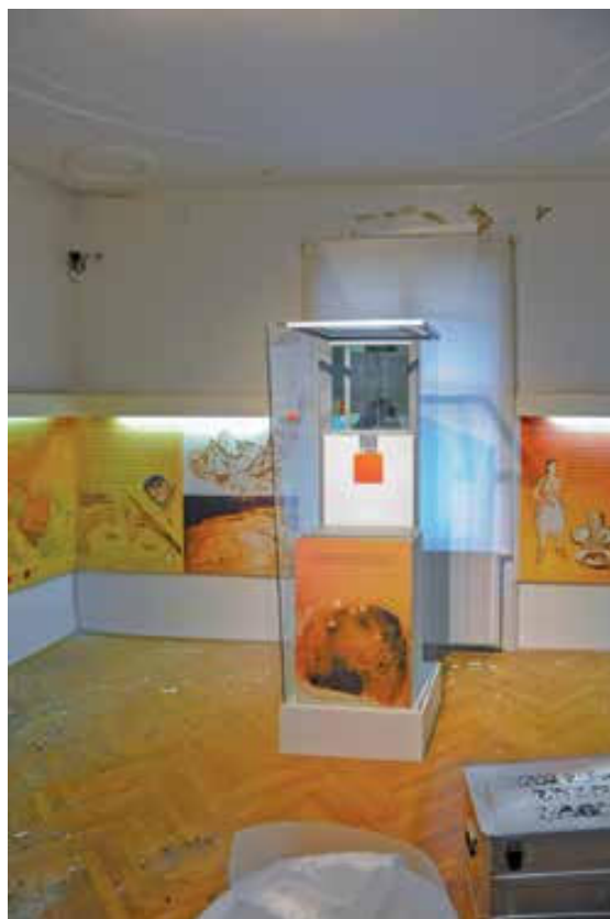
Slika 6. Dio stalnog postava Pretpovijesnog odjela.

ćim smjernicama 4 , koje su s vremenom dopunjavane, 5 popis najvažnije građe i reda spašavanja zbirki, predmeta i dokumentacije u AMZ-u nije načinjen. Izrada takvog protokola jedno je od područja u kojemu bismo, poučeni iskustvom potresa, mogli trajno unaprijediti praksu Muzeja. Usporedno sa zahvatima na muzejskoj zgradi muzejski su djelatnici pristupili popisivanju i procjeni štete. Muzej je nadležnim tijelima državne uprave i lokalne samouprave predao izvještaje koji su pobrojili oštećenja na 109 muzejskih predmeta načinjenih od kamena, stakla, metala, keramike i jantara iz zbirki Egipatskoga (sl. 5), Pretpovijesnog (sl. 6) i Antičkog odjela (sl. 7). Knjižni fond, arhivska građa i predmeti koji su se nalazili na obradi u Konzervatorsko-restauratorskom odjelu, kao ni muzejski predmeti Srednjovjekovnoga i Numizmatičkog odjela, nisu oštećeni. Vučedolska golubica, Solinjan-ka, Zagrebačka mumija sa Zagrebačkom