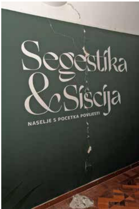
Slika 1. Postavljena i neotvorena izložba Segestika i Siscija – naselje s početka povijesti.

Polupani lončići usklik je kojim se označuje prekid igre zbog proceduralne pogreške ili pogreške u primjeni pravila. Nakon usklikla igra se vraća na početak. 1