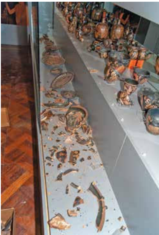
Slika 7. Vitrina s razbijenim grčkim slikanim vazama.

lanenom knjigom i Branimirov natpis također su pošteđeni štete, nasreću.