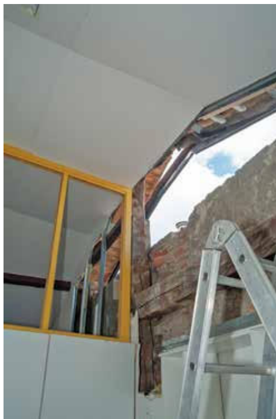
Slika 4. Šteta na sjevernom zabatu zgrade.

moguću mjeru, a muzejski su predmeti iz izložbenih prostora pohranjeni u muzejske čuvaonice ili unutar samoga izložbenog prostora. Načela preventivne zaštite pritom su bila uvažena u najvećoj mogućoj mjeri u danom trenutku, pa naknadni udari, kao ni potres 29. prosinca 2020. godine, nisu prouzročili dodatna oštećenja, čime je učinak potresa kod Petrinje, u smislu materijalne štete u Arheološkome muzeju u Zagrebu, bio zanemariv. Svako treba naglasiti da je učinjeno rezultat intuicije, osnovne logike, posebnih znanja i dovitljivosti muzejskog kolektiva, što otvorenim ostavlja problem nepostojanja protokola postupanja s muzejskom građom AMZ-a pri prirodnim katastrofama. Iako je potreba za izradu takvih posebnih institucijskih protokola naglašena u op-