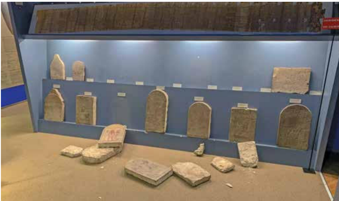
Slika 5. Dio stalnog postava Egipatskog odjela.

ćim smjernicama 4 , koje su s vremenom dopunjavane, 5 popis najvažnije građe i reda spašavanja zbirki, predmeta i dokumentacije u AMZ-u nije načinjen. Izrada takvog protokola jedno je od područja u kojemu bismo, poučeni iskustvom potresa, mogli trajno unaprijediti praksu Muzeja. Usporedno sa zahvatima na muzejskoj zgradi muzejski su djelatnici pristupili popisivanju i procjeni štete. Muzej je nadležnim tijelima državne uprave i lokalne samouprave predao izvještaje koji su pobrojili oštećenja na 109 muzejskih predmeta načinjenih od kamena, stakla, metala, keramike i jantara iz zbirki Egipatskoga (sl. 5), Pretpovijesnog (sl. 6) i Antičkog odjela (sl. 7). Knjižni fond, arhivska građa i predmeti koji su se nalazili na obradi u Konzervatorsko-restauratorskom odjelu, kao ni muzejski predmeti Srednjovjekovnoga i Numizmatičkog odjela, nisu oštećeni. Vučedolska golubica, Solinjan-ka, Zagrebačka mumija sa Zagrebačkom