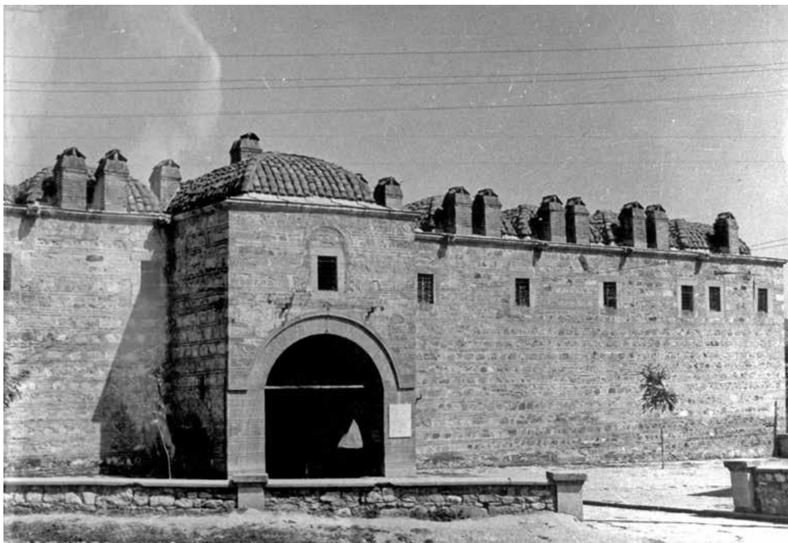
Slika 4. Kuršumli han prije potresa. Izvor: Državni arhiv Republike Sjeverne Makedonije.

Kuršumli han (srednjovjekovnome turskom karavan-saraju, danas bismo rekli „hotelu“) i ostatak arheološkog materijala u objektu nekadašnje turske kasarne na uzvišenju zvanom Kale, u okviru gradskih zidina nekadašnjega prvog naselja, a zatim i grada zvanog Skupi. Takvi „prastari“ objekti svakako nisu mogli odoljeti potresu. U sastavu Muzeja nalazile su se tri važne zbirke pretpovijesnoga, antičkog i srednjovjekovnog materijala. Velik dio ovoga neprocjenjivog arheološkog materijala otišao je u nepovrat: velik dio oslikane keramike (kao i jedna hidrija s prikazom Dioniza okruženog nimfama i srnama), zatim zemljani, stakleni i drugi predmeti i monete, dio zbirke originala srednjovjekovnih fresaka i ikona itd. Ostatak materijala bio je smješten u neoštećenom dijelu lapidarija (sl. 4 – 6).