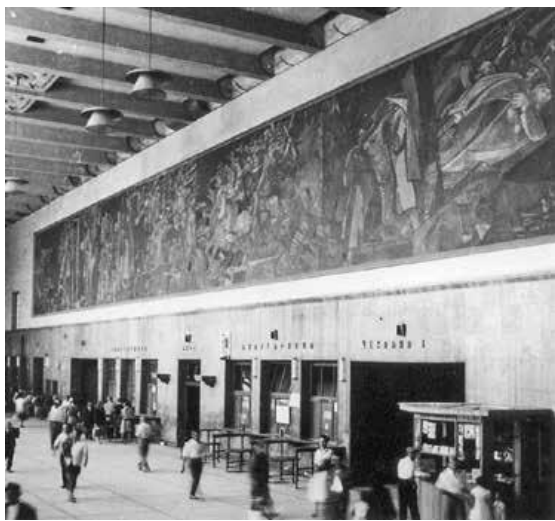
Slika 1. Interijer Željezničke stanice u Skopju s muralom Narodnooslobodilački rat u Makedoniji .

Ovaj „kubistički oratorij“ – neki su ga zvali i „makedonska Guernica “ – nije preživio katastrofalni potres 26. srpnja