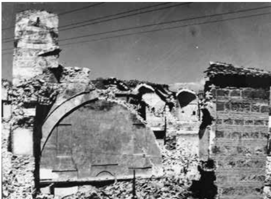
Slika 5. Kuršumli han nakon potresa.

Historijski muzej, osnovan 1949. godine, nalazio se u južnom krilu nekadašnje turske kasarne na uzvišenju zvanom Kale, zajedno s dijelom Arheološkog muzeja.