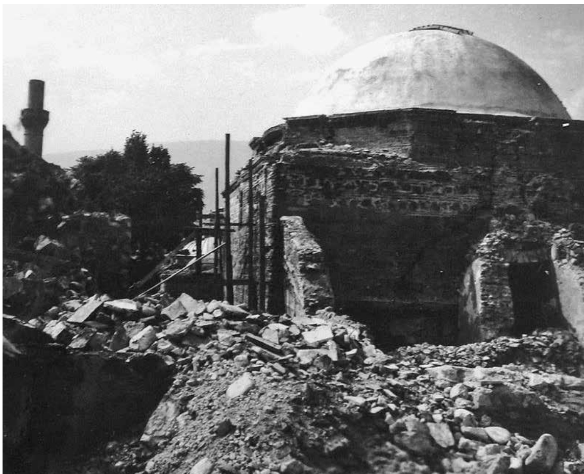
Slika 9. Umjetnička galerija Skopje (Daut-pašin hamam) poslije potresa 1963. godine.

Tadašnja Umjetnička galerija Skopje (danas Nacionalna galerija Makedonije), osnovana 1948. godine i smještena u nekadašnjemu turskom hamamu (Daut-pašin hamam, kraj 15. stoljeća), pretrpjela je prilična oštećenja, ali brzo su bila sanirana. Čuvaonice i umjetnički materijal prošli su, srećom, s manjim štetama (sl. 9 i 10). Sličnu sudbinu imale su i druge kulturne ustanove. Narodni teatar bio je toliko oštećen da je morao biti srušen, kao i Nacionalna i univerzitetska biblioteka, koja je samo imala sreću da je cijeli knjižni fond s oko 450 000 knjiga i starih rukopisa posve bio spašen.