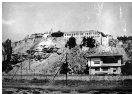
Slika 8. Turska kasarna poslije potresa.

jedini nešto „dobio“ od tog potresa – dobio je objekt, ostatak nekadašnje Željezničke stanice, danas simbol grada sa sačuvanim satom koji pokazuje vrijeme potresa. Nije to danas idealan suvremeni muzejski prostor, ali imajući u vidu djelokrug rada ovog Muzeja, kao i lokaciju i simboličku