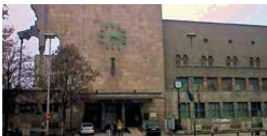
Slika 3. Željeznička stanica danas (Muzej grada Skopja).

Zašto počinjem s ovim uništenim djelom? Zato što je to tada zaista bilo remek-djelo, možda nešto najvrednije što smo od suvremene umjetnosti izgubili u tome katastrofalnom potresu. Ništa se od njega nije moglo sačuvati, nije se moglo ni ponoviti! (Isti slikar poslije je načinio još nekoliko murala širom Makedonije, ali ne u tim grandioznim dimenzijama i nikada s istim žarom, kvalitetom, rekao bih i opsesijom.) Ali, izgubili smo i mnogo toga drugoga! Treba napomenuti da je i sama Željeznička stanica bila jedan od simbola tadašnjeg Skopja – djelo arhitekta Velimira Gavri-