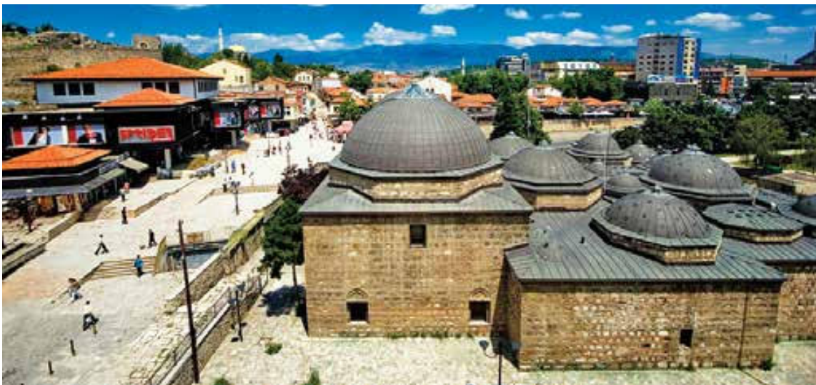
Slika 10. Umjetnička galerija Skopje – danas dio Nacionalne galerije Makedonije.