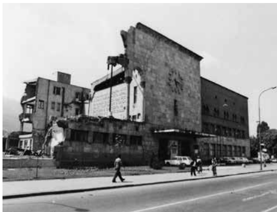
Slika 2. Zgrada Željezničke stanice nakon potresa 1963. godine.

1963. godine. Nije preživjela (u originalnom obliku) ni Željeznička stanica: ostao je samo dio u kojemu je danas smješten Muzej grada Skopja (sl. 2 i 3).