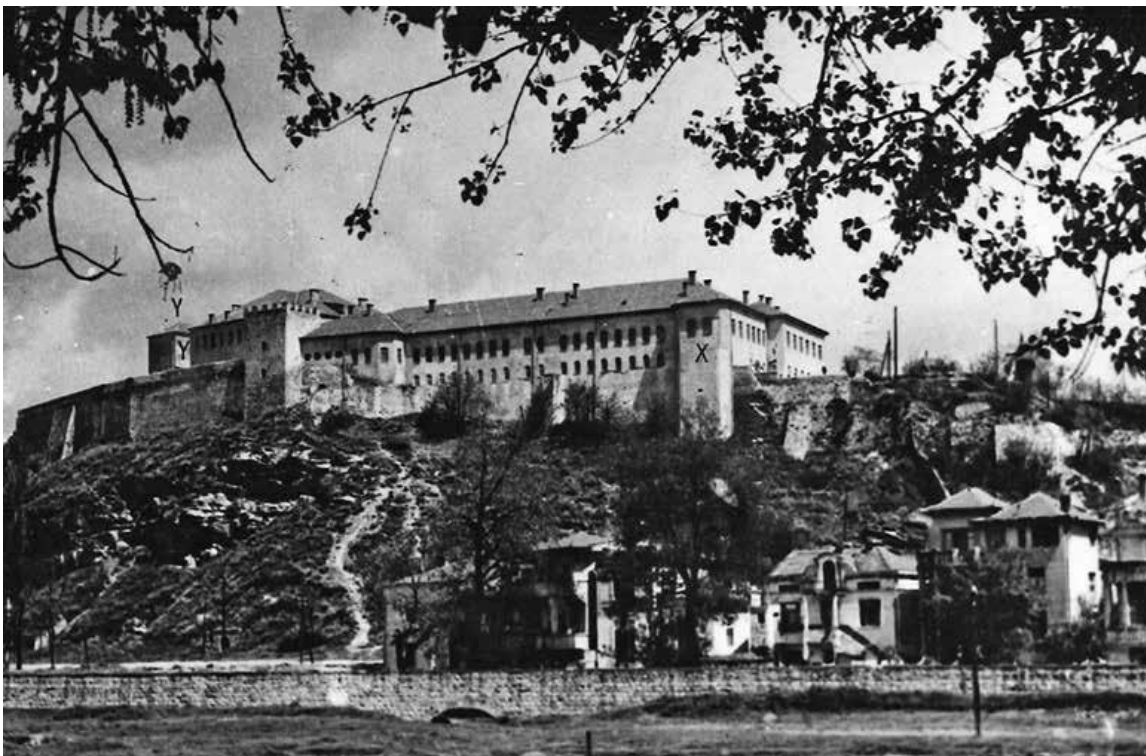
Slika 7. Zgrada turske kasarne, u kojoj su bili smješteni Historijski i Arheološki muzej, prije potresa. Lokacija Historijskog muzeja obilježena je znakom X, a Arheološkoga znakom Y.

nekoga privatnog zdanja (1200 kvadratnih metara), i sve tako do potresa 1963. godine. U vrijeme potresa objekt u kojemu je bio smješten Muzej pretrpio je znatna oštećenja, zajedno s muzejskim čuvaonicama, laboratorijima, radionicama itd. Njegovu slučaju svojstveno je to da je potres uništio veći dio pohranjenog materijala, ali ne i većinu stalnih izložbi (na primjer onih predstavljenih u diorama). Muzej se nakon potresa suočio s problemom čuvanja preostalog materijala, što je privremeno riješeno smještajem u improviziranim barakama. Ovakvo stanje trajalo je do izgradnje nove muzejske zgrade 1969. godine.