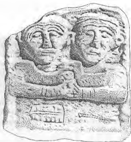
Sl. 2. Nadgrobna stela iz Stupina (Rogoznica). – Fig. 2. Funerary stele from Stupin (Rogoznica).

Majstor je prilikom obrade spomenika pozadinu ostavio onakvom kakva je bila površina kamena u prirodi, a oblikovao je samo prednju stranu. U vrlo plitku edikulu smjestio je kompoziciju od tri lika. 3 Ne znamo je li stela, koja je na gornjem rubu djelomice oštećena ili je bila namjerno otkresana za drugu uporabu, završavala samo gornjim rubom edikule s kompozicijom ili je imala zabat. Iz onoga što nam je ostalo raspoznajemo dva polja. U prvome polju, u edikuli dubine samo 1 cm od površine kamena, smješteni su likovi jedne obitelji: majka, otac i dijete. Već na prvi pogled vidi se da je riječ o djelu domaćeg majstora koji se