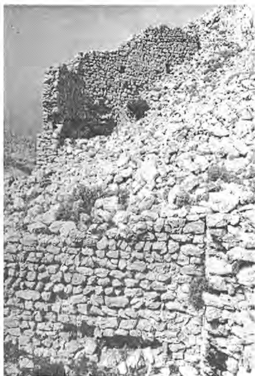
Sl. 6. Pogled na veliki višekatni zapadni objekt i cisternu kasnoantičke utvrde na poluo- točiču Svetojanj. – Abb. 6. Die Ansicht des großen mehrstöckigen Objektes im Westen und der Zisterne der spätantiken Befestigung auf der Halbinsel Svetojanj.

je ribolov i uzgoj stoke sitnog zuba, osobito ovaca. Pričuva vode dopunjavala se, izvan ljetnih mjeseci, čestim oborinama. Niz objekata četvrtastoga tlocrta naslonjenih na pojas bedema dokazuje postojanje potreba za duljim boravkom ljudi. Tragovi arhitekture, osobito cisterne za pohranu vode, pokazuju tehniku zidanja nalik ribljoj kosti, primjerenu kasnoj antici (sl. 9). Obilno korištenje veziva i lomljenoga kamena vapnenca, kao i rijetki tragovi ulomaka keramike istočnomediterranskog obilježja, upućuju na vrijeme postanka tog jedinstvenog spomeničkog kompleksa nedaleko Stare Novalje na otoku Pagu (sl. 2). Na vrijeme kasne antike upućuje i postojanje istaknute duhovne vertikale u središtu utvrđenog naselja.