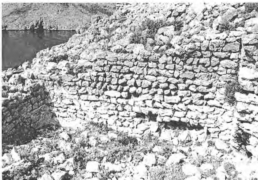
Sl. 9. Ostaci kasnoantičke cisterne na južnoj padini utvrde Svetojanj. – Abb. 9. Die Überreste der spätantiken Zisterne am Südhang der Befestigung Svetojanj.