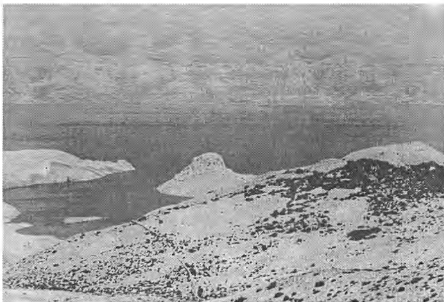
Sl. 1. Pogled s juga na poluotočić Svetojanj na otoku Pagu. – Abb. 1. Die Südansicht der kleinen Halbinsel Svetojanj auf der Insel Pag.

Strma konična stijena nadmorske visine 50,5 m ističe se nad poluotočićem koji je na jugozapadnoj krševitoj zaravnjenoj strani visine samo 7,9 m (sl. 3). Duljina poluotočića u smjeru sjeveroistok-jugozapad iznosi 300 m, a širina u smjeru sjeverozapad-jugoistok 100 m, tako da njegova površina iznosi oko 3,6 ha. Svekolika površina poluotočića prekrivena je tragovima guste arhitekture. Ostaci zidova primjetni su i na jugoistočnoj padini i uz koničnu stijenu, odnosno na njezinom otesanom ravnom vrhu (sl. 4). Tragovi jasne čovjekove djelatnosti u prostoru dali su poluotočiću slikoviti naziv Svetojanj, odnosno Sutojanj, koji je trajno obilježio ovaj pusti djelić otoka Paga. Taj naziv upućuje na postojanje odgovarajućeg crkvenog zdanja.