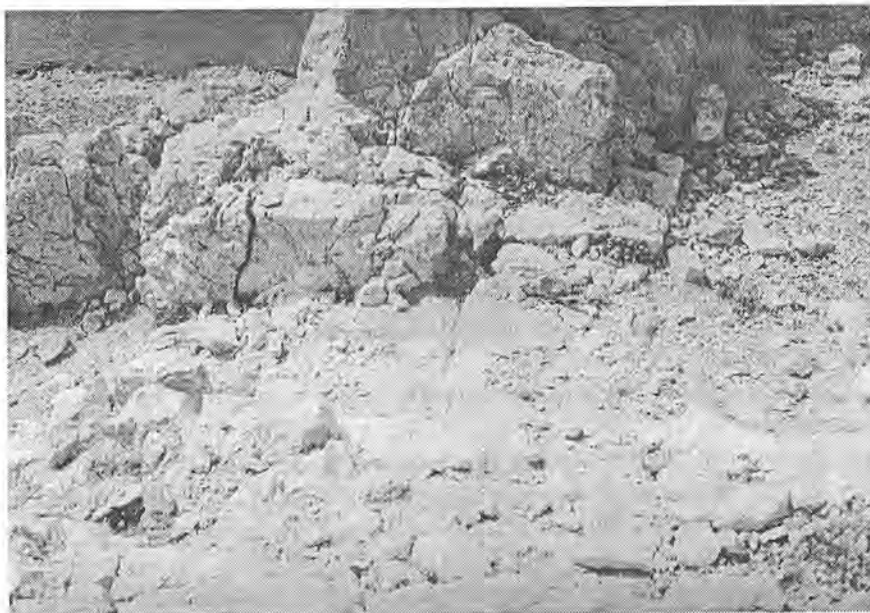
Sl. 8. Ostaci stepenica unutar sklopa arhitekture kasnoantičke utvrde Svetojanj. – Abb. 8. Die Treppenüberreste innerhalb der spätantiken Befestigung Svetojanj.

Utvrda na položaju Svetojanj imala je istaknutu ulogu zaštite pomorskoga prometa u Velebitskom i Paškom kanalu. Zajedno s nizom utvrđenih postaja na susjednoj obali Velebitskog podgorja — u Prizni i okolici Starigrada - osi-