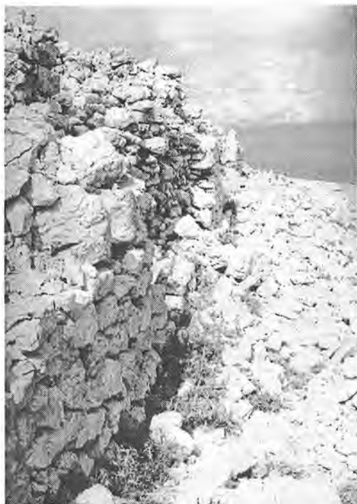
Sl. 7. Ostaci jugoistočne sekcije bedema kasnoantičke utvrde Svetojanj. – Abb. 7. Die Überreste der südöstlichen Mauersektion innerhalb der spätantiken Befestigung Svetojanj.

Na temelju brojnih istovrsnosti, otkrivenih uz istočnu obalu Jadrana, od Albanije na jugu do Istre na krajnjem sjeveru Hrvatske, valja utvrdu na poluo-točiću Svetojanj promatrati u povezanosti s onodobnim ustrojem zaštite oslobođenog prostora i njegovoga ponovnoga, doduše kratkotrajnoga, priključenja obnovljenoj ekumeni Rimskoga Carstva. Taj se slijed odvijao tijekom Justinijanove epohe i danas je dosta dobro poznat. Posebno se to odnosi na horizont vojnog graditeljstva koji je dokazan diljem istočnojadranskog priobalja Hrvatske na nizu znakovitih primjera. Sjeverni dio Hrvatskog primorja pruža u tom smislu brojne lijepe primjere gradnje kasnoantičkih utvrda, tzv. kastra ( kastron ) ili frurija ( frurion ). Te su utvrde nastale pretežito tijekom istočnogotsko-bizantskog rata, odnosno prve vladavine Bizanta na Jadranu za cara Justinijana I.