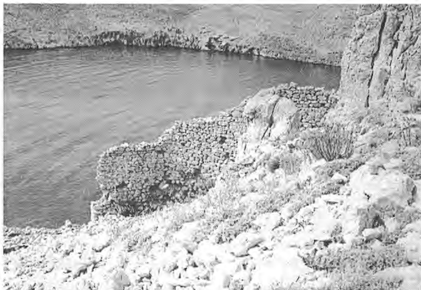
Sl. 5. Pogled s juga na koničnu stijenu poluotočiča Svetojanj i tragove kasnoantičke arhitekture. – Abb. 5. Die Südansicht der konischen Felsen der Halbinsel Svetojanj und der Überresten der spätantiken Architektur.

ljivo arheološko nalazište osvrnuo, u veoma sažetom obliku, vrstan poznavatelj prošlosti otoka Paga, Aleksij Škunca. U ostacima antičke utvrde na pustom kamenjaru Rta Svetojanj naslutio je djelić sustava zaštite Justinijanova plovnog puta uz ovaj dio jadranske obale. 4 Nešto podrobnije se na to zanimljivo nalazište osvrnuo pisac ovih redaka. Obilazeći primjere kasnoantičkog obrambenog graditeljstva na otoku Pagu i u Velebitskom podgorju, prepoznao je u Svetojanju detalj složenog sustava obrane iz vremena prve vladavine Bizanta na Jadranu. 5