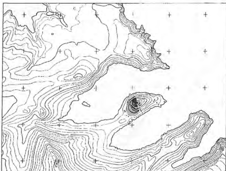
Sl. 3. Zemljovid poluotočica Svetojanj s položajem kasnoantičke arhitekture. Mjerilo: 1:5000 (crtež: V. Žimić-Justić, d.i.a.). – Abb. 3. Die Landkarte der Halbinsel Svetojanj mit der Position der spätantiken Architektur. Maßstab: 1:5000 (Zeichnung: V. Žimić-Justić, d.i.a.).