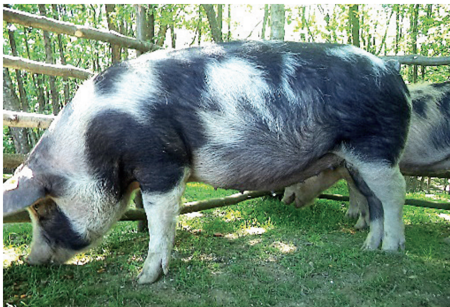
Slika 1. Krmača banijske šare svinje