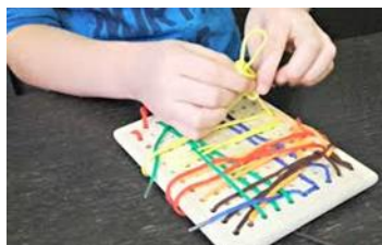
Slika 5: Provlačenje vunениh niti (internetski izvor).