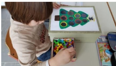
Slika 1: Ubacivanje cofa u kutiju (osobna arhiva).