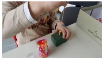
Slika 2: Nizanje perlica na drveni štapić (osobna arhiva).