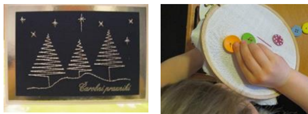
Slika 6: (Pri) šivanje gumba i čestitki.