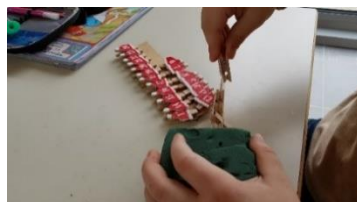
Slika 3: Postavljanje (namještanje) štipaljki na drveni štapić.