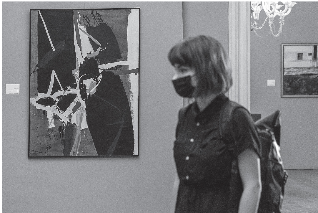
sl.2. Posjetiteljica u postavu Gradskog muzeja Varaždin (Hrvatski majstori 20. i 21. stoljeća, Palača Sermage), 2021.

20. ICOM. „Museums, museum professionals and Covid-19: third survey”, https://icom.museum/wp-content/uploads/2021/07/Museums-and-Covid-19_third-ICOM-report.pdf (pristupljeno 26. rujna 2021.).