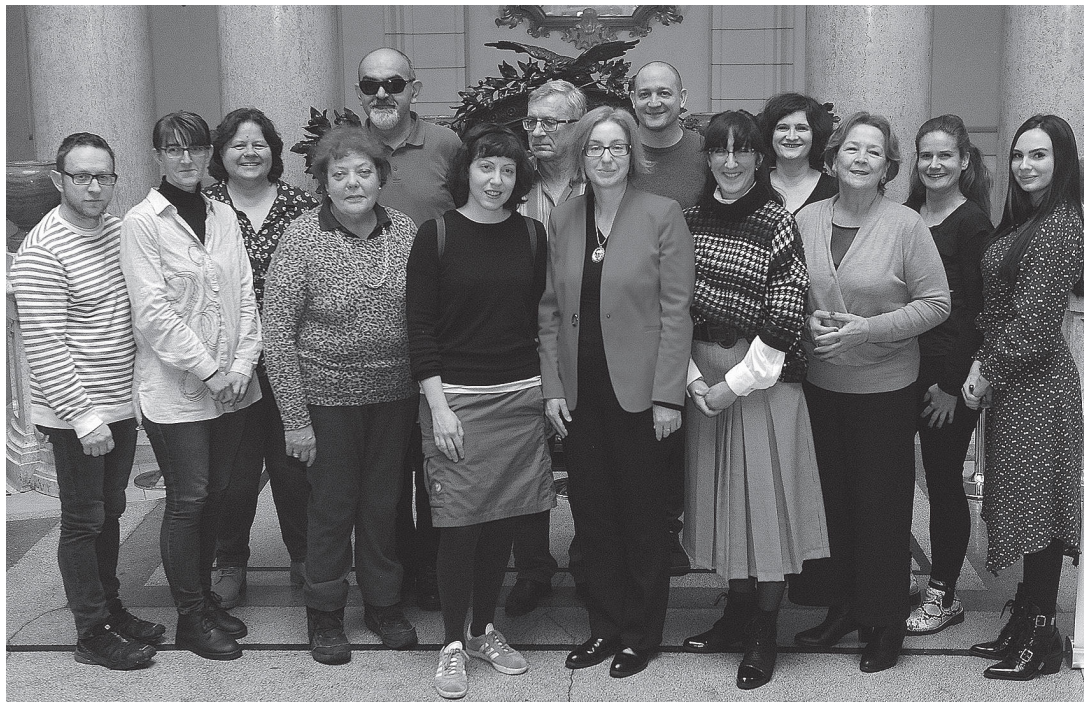
sl.2. Prvi saziv Građanskoga muzejskog vijeća, snimio Marko Gracin, 2019.