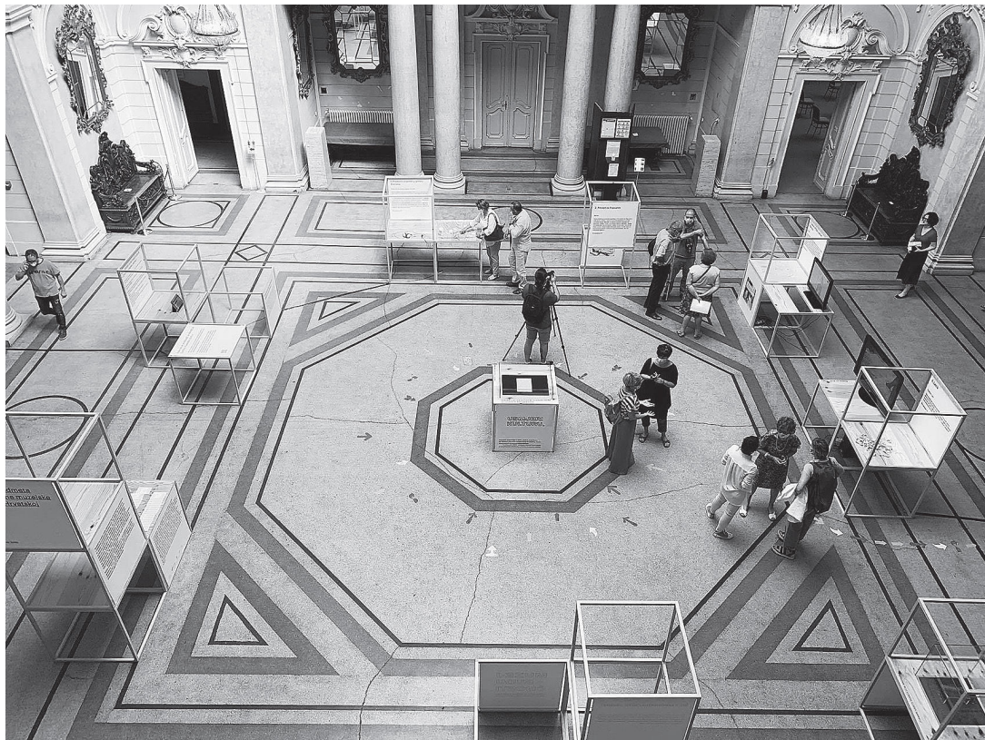
sl.11. Izložba Prvih pet predmeta Civilne muzejske zbirke

Udrugu Specijalne policije iz Domovinskog rata Ajkula te Kreativni kolektiv Kombinat kao reizabranu članicu. Navodimo molbu kojom se Udruga za pomoć ovisnicima Vida obratila Vijeću u svojoj prijavi za članstvo: Želimo muzej koji bi posjetili i naši korisnici te koji bi ih objeručke prihvatio. Za nas, to je važan dio demokratizacije – ulazak u jednu stamenu strukturu poput muzeja, koja je upravo suprotna vrlo krhkim, senzibilnim i socijalno isključenim ljudima s kojima radimo. 11