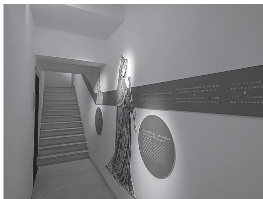
sl.6. Detalj izložbe na vrhu južne kule Centra za posjetitelje Medvedgrad. (listopad 2021.).

S tim u skladu, naš interdisciplinarni tim kreativaca sastavljen od muzeologa, produkt-dizajnera i grafičkih dizajnera, dizajnera multimedije i rasvjete te biologa razvio je tijekom trogodišnjeg razdoblja više od dvadeset različitih interpretacijskih planova. Izrađena je provedbena dokumentacija za razvoj deset centara za posjetitelje, tri interpretacijsko-edukacijska centra, jednoga edukacijskoga i jednoga prijamnog centra. Uz posjetiteljsku infrastrukturu u zatvorenome, za koju su u maniri održivog djelovanja iskorištena postojeća infrastrukturna rješenja unutar zaštićenih područja, projektom je izrađena i dokumentacija za sedam poučnih staza i jednu mobilnu aplikaciju te za vanjski signalizacijsko-interpretacijski sustav za hrvatsku mrežu zaštićenih prirodnih područja s jedinstvenim vizualnim identitetom Parkovi Hrvatske . 7 I rješenja interpretacije na otvorenome izrađena su neinvazivno i u skladu s prirodnim okruženjem. Time je za-