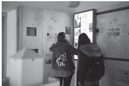
sl.9. Stalna izložba u velikom palasu Centra za posjetitelje Medvedgrad s interaktivnom multimedijском povijesnom lentom i maketom Medvedgrada. Fotografirao Nikola Zelmanović (listopad 2021.).

edukativno, inspirativno i osobno iskustvo prirodne baštine Medvednice, ali i skrivenih tajni srednjovjekovnoga Medvedgrada. Flora i fauna Medvednice dočarana je interpretacijskim tekstovima i vještīm, u maniri bakroreza izrađenim ilustracijama, a tajnovitost utvrde dočaravaju interaktivni multimedijски izložci. Na vrhu kule, uz interpretacijske izložke, posjetitelje dočekuje i prekrasan pogled na Zagreb i okolice kao neposredan doživljaj prirode koja ih okružuje.