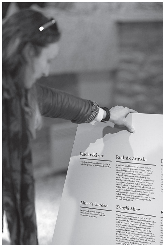
sl.4. Detalj izložbe u podrumu južne kule Centra za posjetitelje Medvedgrad.