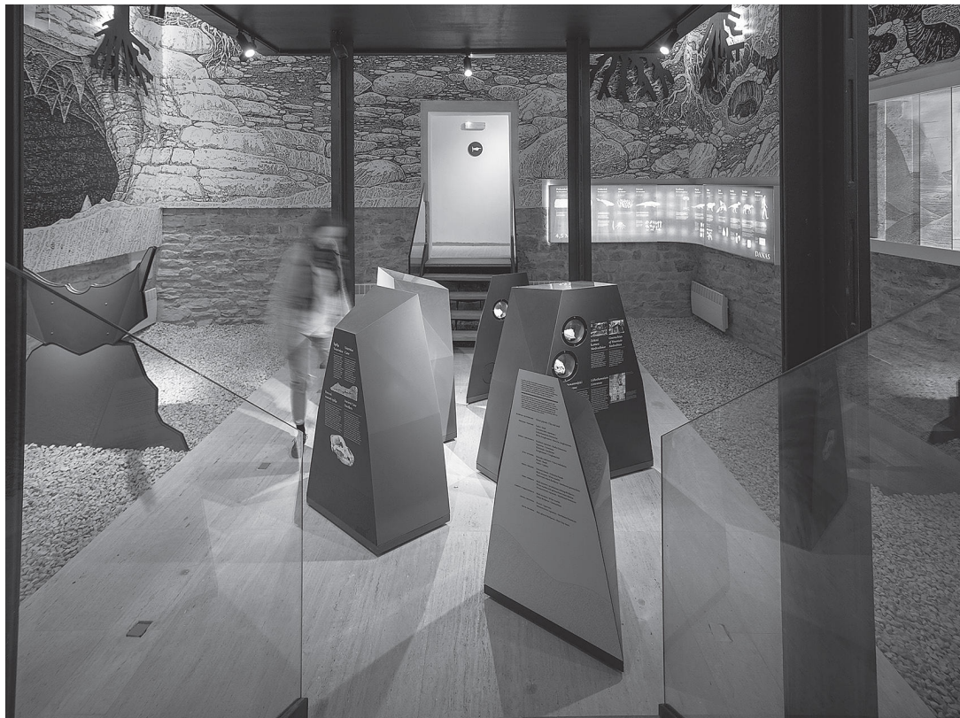
sl.3. Izložba u podrumu južne kule Centra za posjetitelje Medvedgrad. Fotografirao Damir Žižić (listopad 2021.).

gobrojnih povijesnih priča i legenda povezanih upravo s utvrdom Medvedgrad, danas omiljenim rekreacijskim odredištem koje odnedavno pruža i jedinstveno interpretacijsko iskustvo djelovanjem novootvorenog Centra za posjetitelje Medvedgrad.