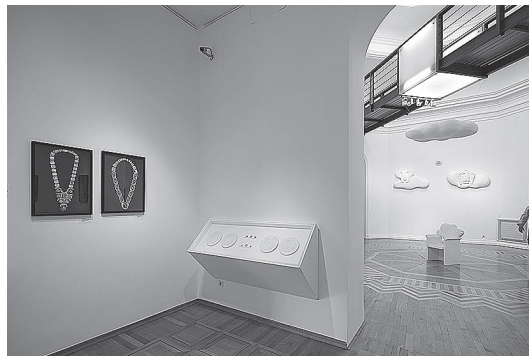
sl.3. Damir Mataušić, Identitet, 2019.

sta unutar Goručega grma, svijećnjake i procesijski križ te svetohranište s motivom pelikana. Cijeli crkveni interijer osmišljen je u suradnji s Ivicom Ragužom, dekanom Katoličkoga bogoslovnog fakulteta u Đakovu i izveden je 2018. 1