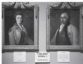
sl.5. Gradski muzej Virovitica je bio zatvoren za posjetitelje, ali dostupan u virtualnom okruženju

The second activity was aimed at presenting the Czech ethnic minority in Virovitica, by depicting valuable donations of textile material that after processing and preparation for entry into the storeroom enriched the Collection of Folk Attire of Virovitica Municipal Museum by videos published on YouTube. With these activities the museum allowed the public to become more familiar with part of its work, that related to the preservation of the historical and cultural heritage, as well as heritage research. The museum endeavoured to increase the awareness of the interested public about diversity and foster inclusivity, dialogue and care for the heritage.