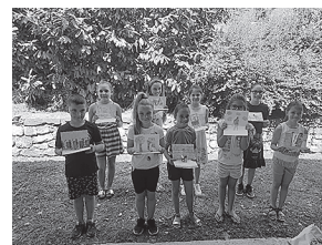
sl.1. Sudionici edukativne radionice

IM 52, 2021. POGLEDI, DOGAĐAJI, ISKUSTVA VIEWS, EXPERIENCES, EVENTS