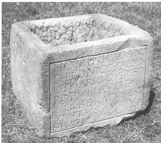
Fig. 2. Telonicus' urn, The Archaeological Museum in Split.

Sl. 2. Telonikova urna, Arheološki muzej u Splitu.