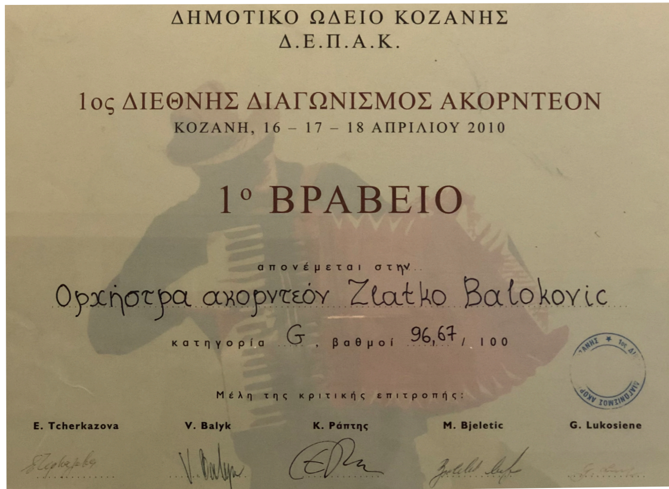
Slika 8. Prva nagrada Harmonikaškom orkestru Glazbene škole Zlatka Balokovića pod vodstvom nastavnika Mirana Vaupotića u Grčkoj 2010. (izvor: Arhiv Glazbene škole Zlatka Balokovića).