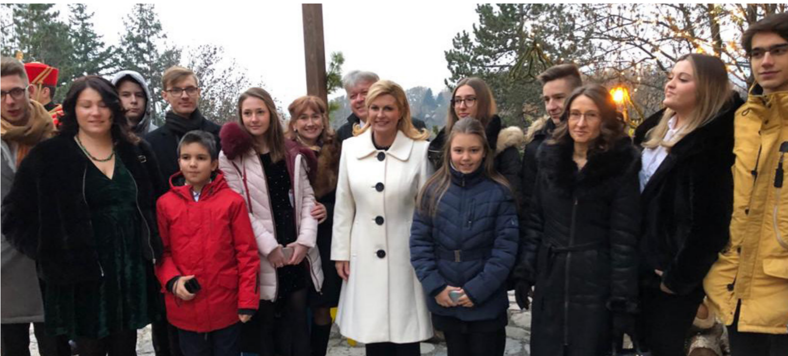
Slika 12. Učenici i nastavnici Glazbene škole Zlatka Balokovića s predsjednicom Kolindom Grabar Kitarović 2017. (izvor: Arhiv Glazbene škole Zlatka Balokovića).

Balokovića redovito sudjeluju na regionalnim i državnim, kao i domaćim međunarodnim natjecanjima, a vrlo zapažene uspjehe ostvarili su solisti i komorni ansambli te Tamburaški orkestar glazbene škole pod vodstvom nastavnice Svetlane Krajne, koji je 2000. osvojio zlatnu plaketu na 23. festivalu tamburaške glazbe u Osijeku, a 2003. gostovao u dvorani UNESCO-a u Parizu. Prve državne