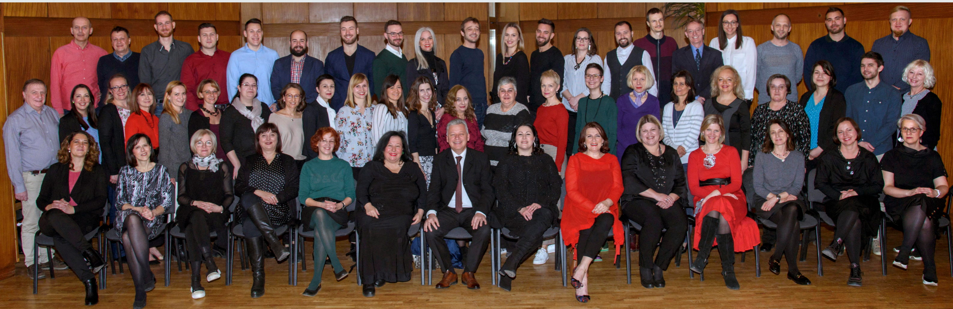
Slika 1. Djelatnici Glazbene škole Zlatka Balokovića u školskoj godini 2019./2020.

U kontekstu naše obljetnice, posebno smo ponosni na pothvat objavljivanja monografije o Glazbenoj školi Zlatka Balokovića.