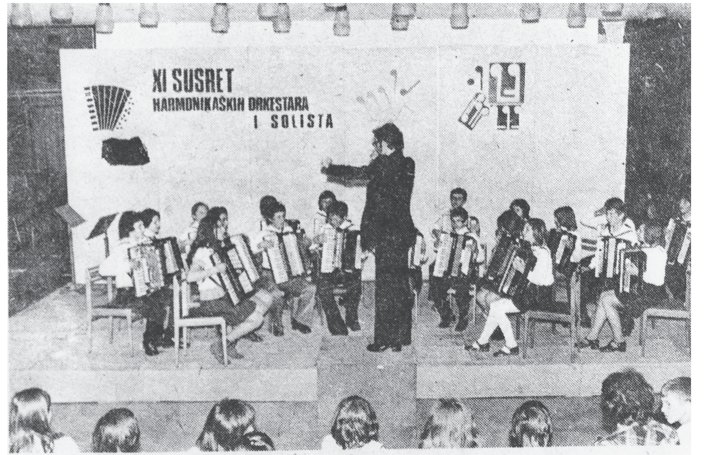
Slika 5. Harmonikaški orkestar Glazbene škole Zlatka Balokovića pod vodstvom Zvonka Šiljca 1974.