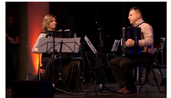
Slike 10, 11, 12 i 13 – Uvodne autorske glazbene točke