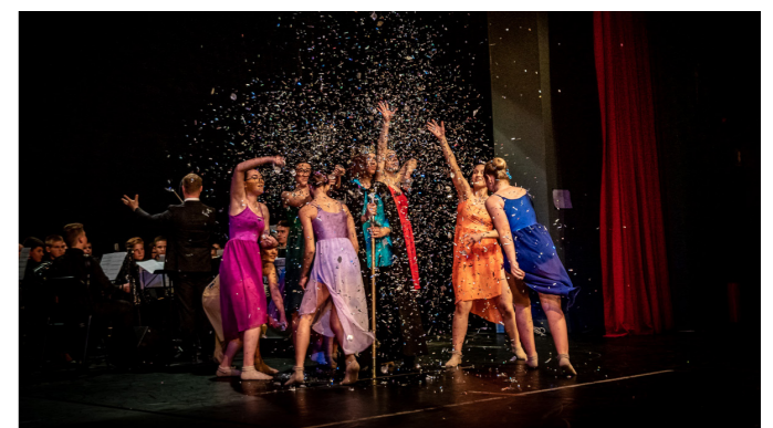
Slike 15, 16, 17, 18, 19, 20, 21 i 22 - Praizvedba plesne suite Dugine boje u dvorani Pučkog otvorenog učilišta Velika Gorica