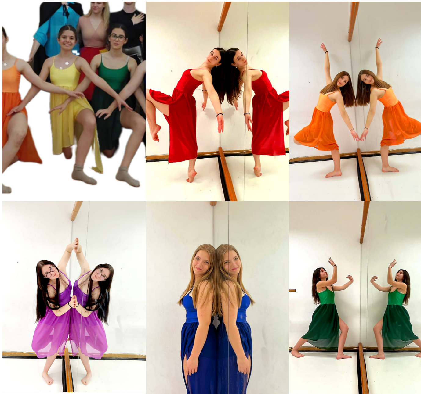
Slike 3, 4, 5, 6, 7 i 8 – Svaka plesačica predstavlja određenu boju iz baletne suite