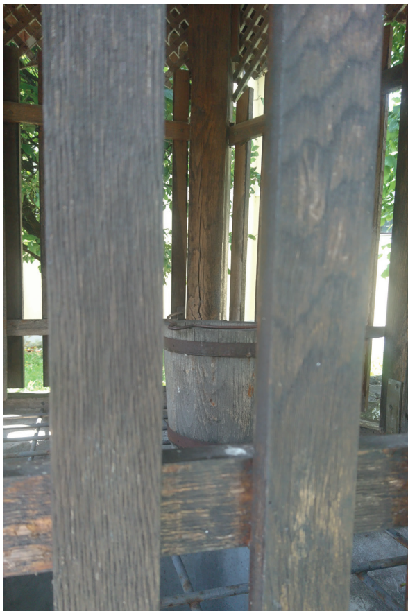
Slika 9: Pogled u unutrašnjost zdenca