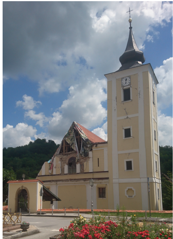
Slika 7: ...koja je teško oštećena u potresima 22. ožujka i 29. prosinca 2020. godine