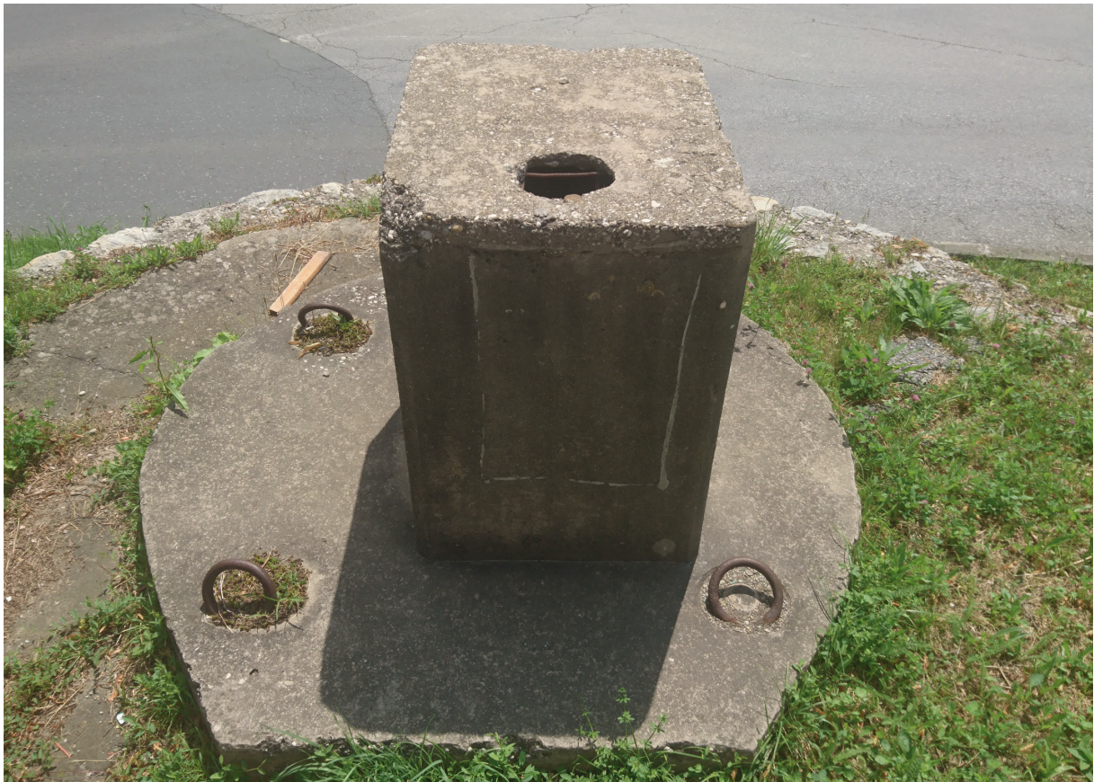
Slika 12: Nakon izgradnje vodovoda zdenac je zatvoren