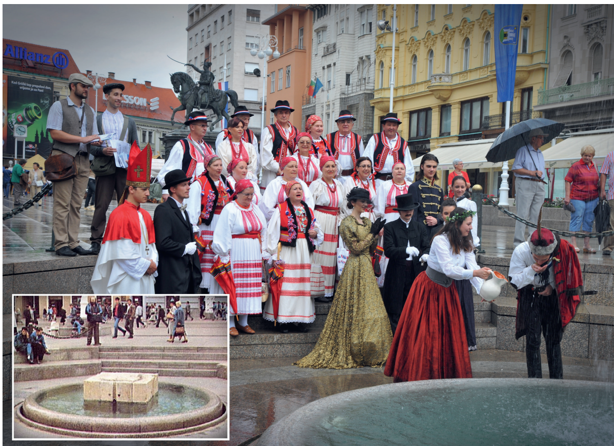
Slika 1: Manda je zagrabila vodu za bana baš kao u predaji, s obilježavanja 135. obljetnice zagrebačkog vodovoda

Nikola Bonifačić Rožin zapisao je u Folkloru grada Zagreba predaju o Manduši. Predaja kaže da je neki ban bio u lovu i izgubio se od pratnje. Tumarao je okolo i nije mogao naći put. To je trajalo nekoliko dana i konj mu je uginuo. A on se vukao žedan po toj prašumi i došao do jedne čistine. Tamo je stajala jedna djevojka na izvoru.