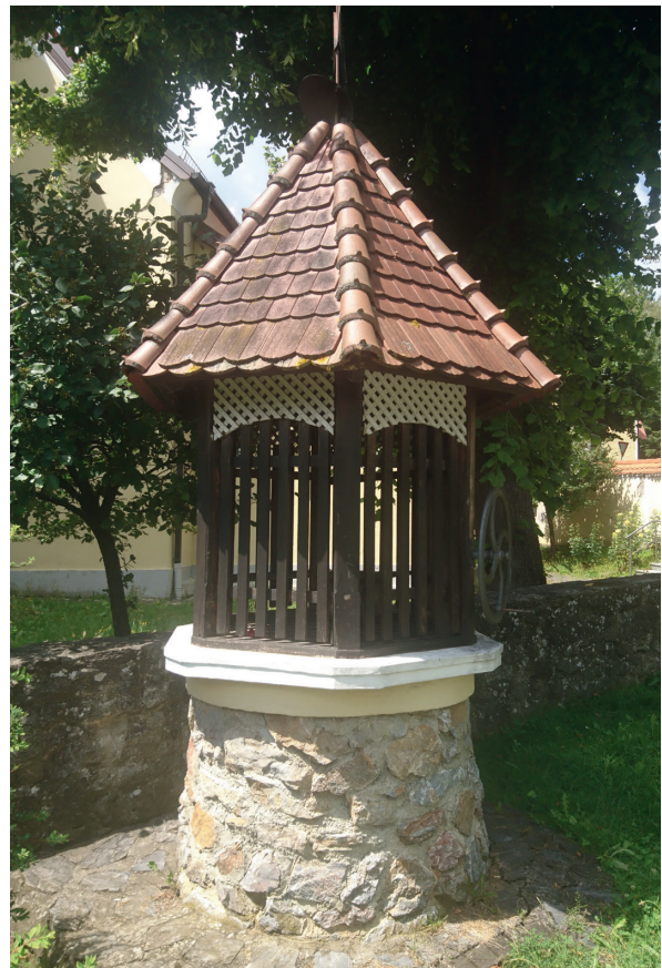
Slika 8: ...Od jezera je ostao samo zdenac