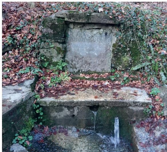
Slika 14: Kraljičin zdenac

Cisterna na Medvedgradu je otkrivena 1969. godine.