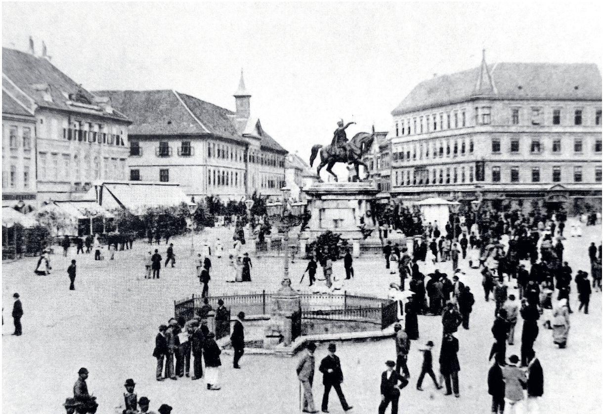
Slika 3: Manduševačka 'fontaina', zdenac sa željeznom ogradom, svjetiljkama i kamenim podnožjem, iz kojeg kroz 4 slavine teče voda manduševačkog vrela, što po željeznim cijevima dolazi ispod kuće na uglu Bakačeve ulice sve do bunara.

Poslije zvona s Lotrščaka, koje je pozivalo građane da se vrate unutar gradskih zidina, nije bilo uputno ostajati na Manduševcu. Optužili bi ih da su vještice.