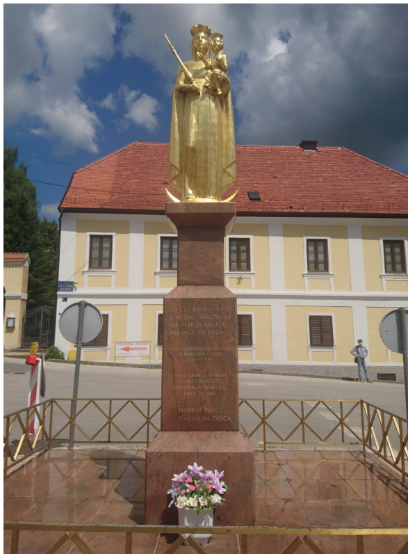
Slika 6: Pozlaćeni kip Gospe Čučerske na trgu ispred župne crkve Pohoda Blažene Djevice Marije...

Župna crkva Pohoda Blažene Djevice Marije u zagrebačkom Čučerju teško je oštećena u potresima 22. ožujka i 29. prosinca 2020.