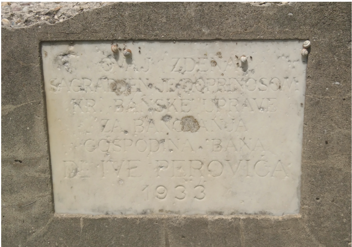
Slika 13: Ploča s uklesanim podacima o nekadašnjem zdencu