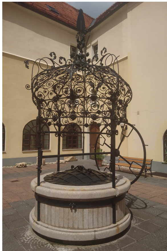
Slika 10: Natkrovlje zdenca u bivšem pavlinskom samostanu u Remetama, kopija