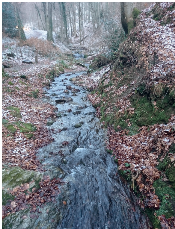
Slika 16: Potok Kraljevac