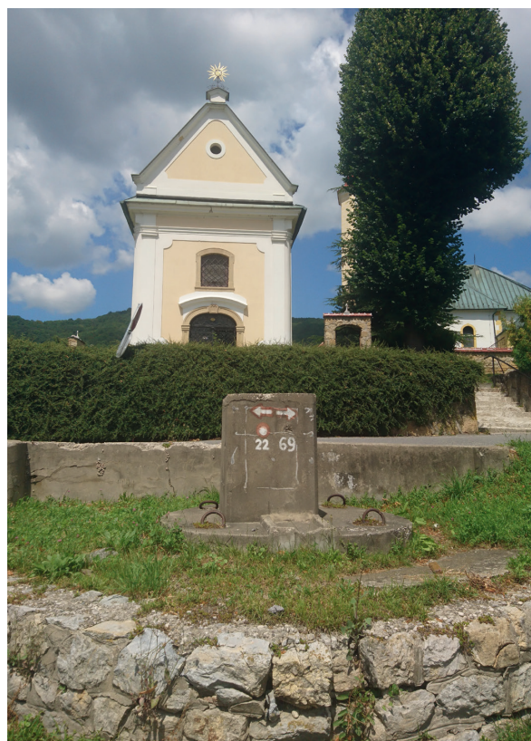
Slika 11: Zdenac u Markuševcu kod kapelice Majke Božje anđeoske

Stari su mještani pričali kako su u ono davno vrijeme ljudi išli u posjet hrvatskom kralju u njegov grad. Išli su kroz veliki dugački tunel koji je počinjao u zdencau pred Kapelicom Majke Božje anđeoske u centru Markuševca. Spustili bi se u velikoj košari. Da bi prošli tunel u košaru su prvo spustili mladu junicu i tjerali je ispred sebe do neke veće prostorije. Tu bi je ostavili i sakrili se. Iz mraka