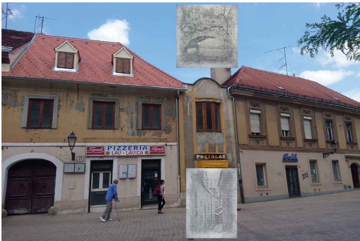
Slika 4: Između kućnog broja 23 i 25 u Vlaškoj ulici jedna mala prigradnja, gdje je sada postolar, zatvara usku staru ulicu, koja je vodila do ljekovitog zdenca

mala slika 1: Mjesto gdje je pronađen Kažotičev zdenac