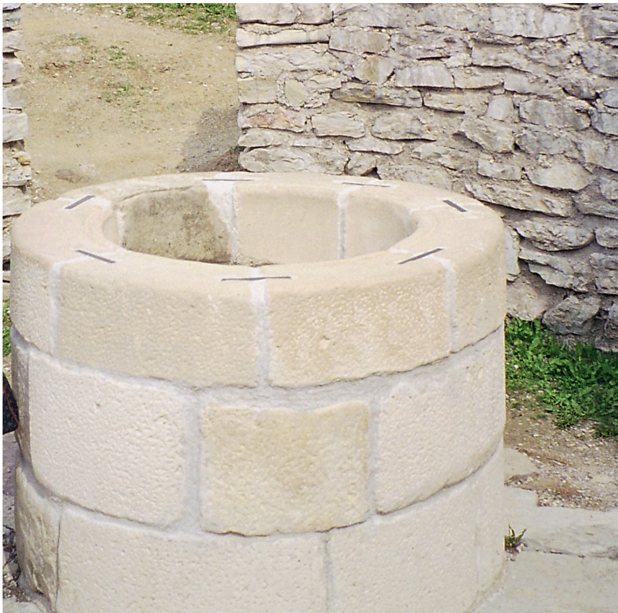
Slika 17: Zdenac na Medvedgradu