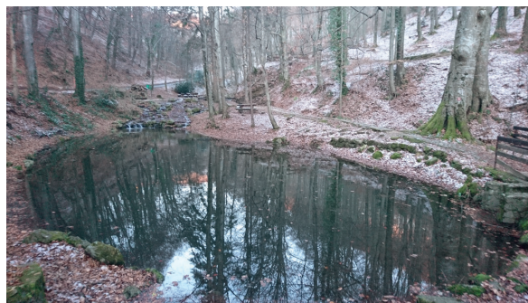
Slika 15: ... jezerce