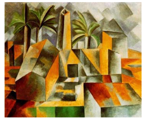
Treći krajolik pod nazivom „Factory at Horta de Ebro“