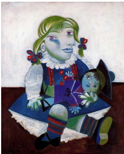
tome, može se slobodno koristiti, kao boja.