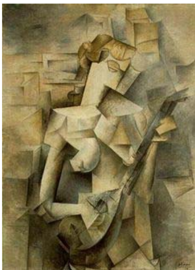
Sl 1. Braque: „Žena s mandolinom“

Fasetni ili analitički kubizam obuhvatio je razdoblje od 1908. do 1912. godine. U likovnim djelima ovoga perioda objekti su razbijeni na kristalaste čestice te ponovno rekonstruirani tako da se ne posvećuje pažnja izgledu subjekta nego njegovoj biti. Napušta se klasična perspektiva i kubisti ne slikaju ono što vide nego ono što o predmetu znaju. Širok spektar boja u analitičkom kubizmu ne postoji te se boje ograničavaju na plavu, oker i sivu. Picasso umjesto realnog izvora svjetlosti koji osvjetljava sve predmete uvodi više izvora svjetlosti za svaki predmet. Picasso i Braque surađuju tako blisko da se njihova djela razlikuju jedino prema temperamentima; dok je Picasso u potrazi za kontrastom i naponom oblika, Braque traži harmoniju i ujednačenost. Obojica su krenuli putem apstrakcije ostavljajući samo naznake stvarnog svijeta, no kako bi zaustavili proces prelaska u apstrakciju od 1912. godine sve se više oslanjaju na realnost [1].