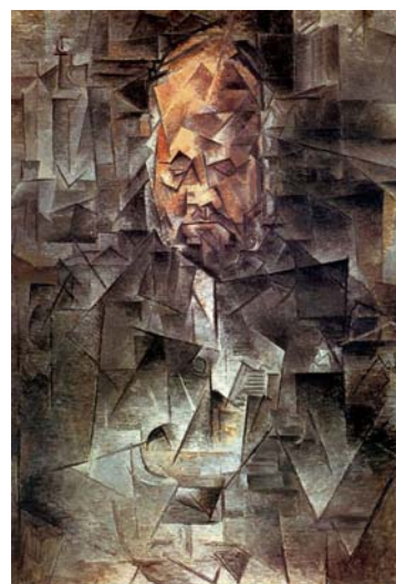
Sl.2 Picasso: „Portret Ambroisea Vollarda“