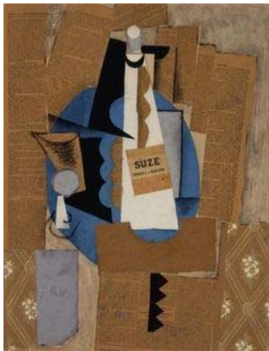
Sl.3. Picasso: "Gitara, note i čaša vina"

Sintetički ili kolažni kubizam je nova faza kubizma koja je još odvažnija od one koja joj je prethodila. Ime je dobila po francuskoj riječi „collage“ što znači lijepljeni papir a traje od 1912. do 1914. godine. Picasso i Braque slikaju monokromne slike kako bi uklonili problem boje iz analitičkog kubizma i kako bi se usmjerili na strukturu i liniju. Međutim, 1912. su počeli koristiti svjetlije boje kao dekorativni element te su mnogi umjetnici počeli koristiti tehniku kolaža u svojim radovima. Kolaž je posve promijenio način na koji su Picasso i Braque stvarali svoje slike. Umjesto da su razbijali i raščlanjivali predmet na esencijalne oblike kao što su to činili u analitičkom kubizmu sada su ga umjetnici sintetički konstruirali gradeći ga ili uređujući od izrezanih komadića papira [1].