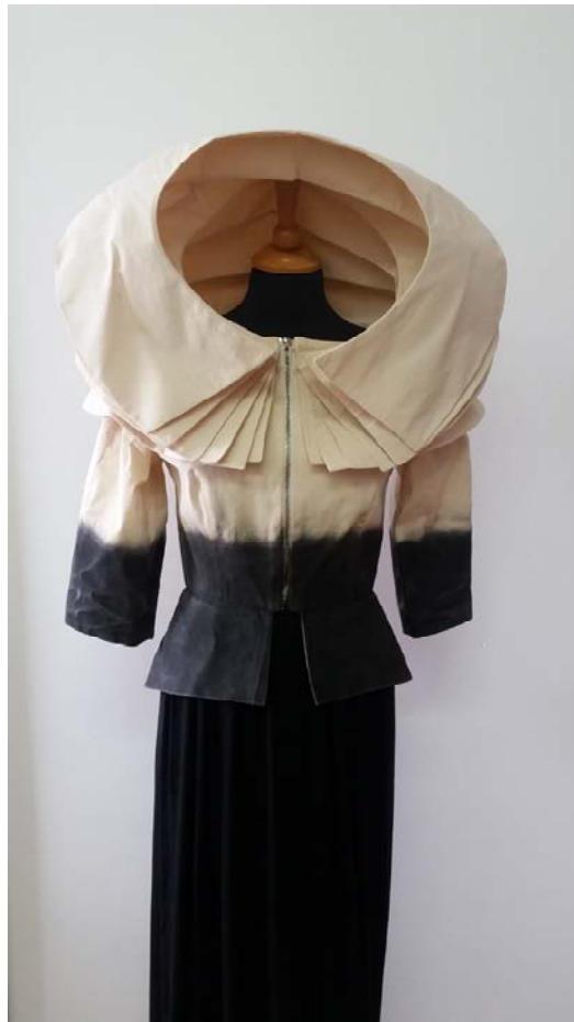
Slika 9: Jakna iz kolekcije na izložbi studenta TTF-a, proljeće 2015. g., autor nepoznat