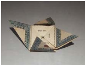
Slika 2: Krsna svjedodžba u stilu „ Double blintz “

Demokratizacija origamija u Japanu je nastala tijekom Tokugawa razdoblja (1603.-1867.) kada dolazi do procvata japanske umjetnosti i kulture. Iako nema puno dokaza o hobi izradi origamija prije 1600. g., tijekom 17. st. origami postaje važan dio Japanske kulture. „ Prva izdana knjiga o izradi origamija je bila „Tsutsumi-no Ki“ autora Sadatake Ise izdana oko 1764. Sadržavala je upute o izradi 13 ceremonijalnih oblika poput noshija “ (izvor: http://www.origami-resource-center.com/history-of-origami.html )