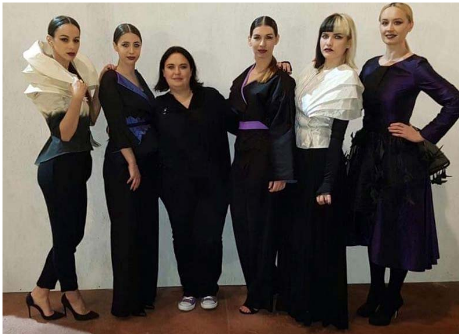
Slika 20: Mini kolekcija prikazana na Tjednu Dizajna u Laubi, proljeće 2016. g. Autor: nepoznat POPIS LITERATURE: