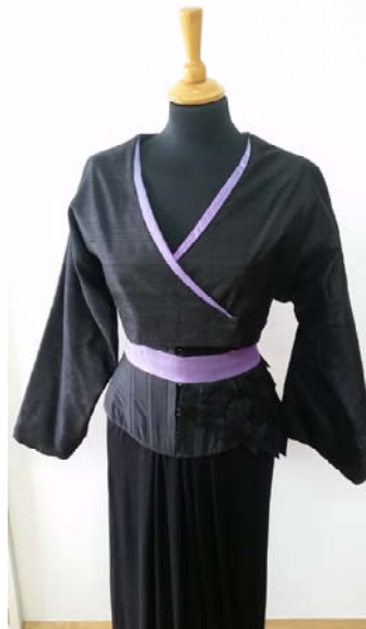
Slika 10: Kimono i korzet iz kolekcije, proljeće 2016. g., autor: B. Buhin