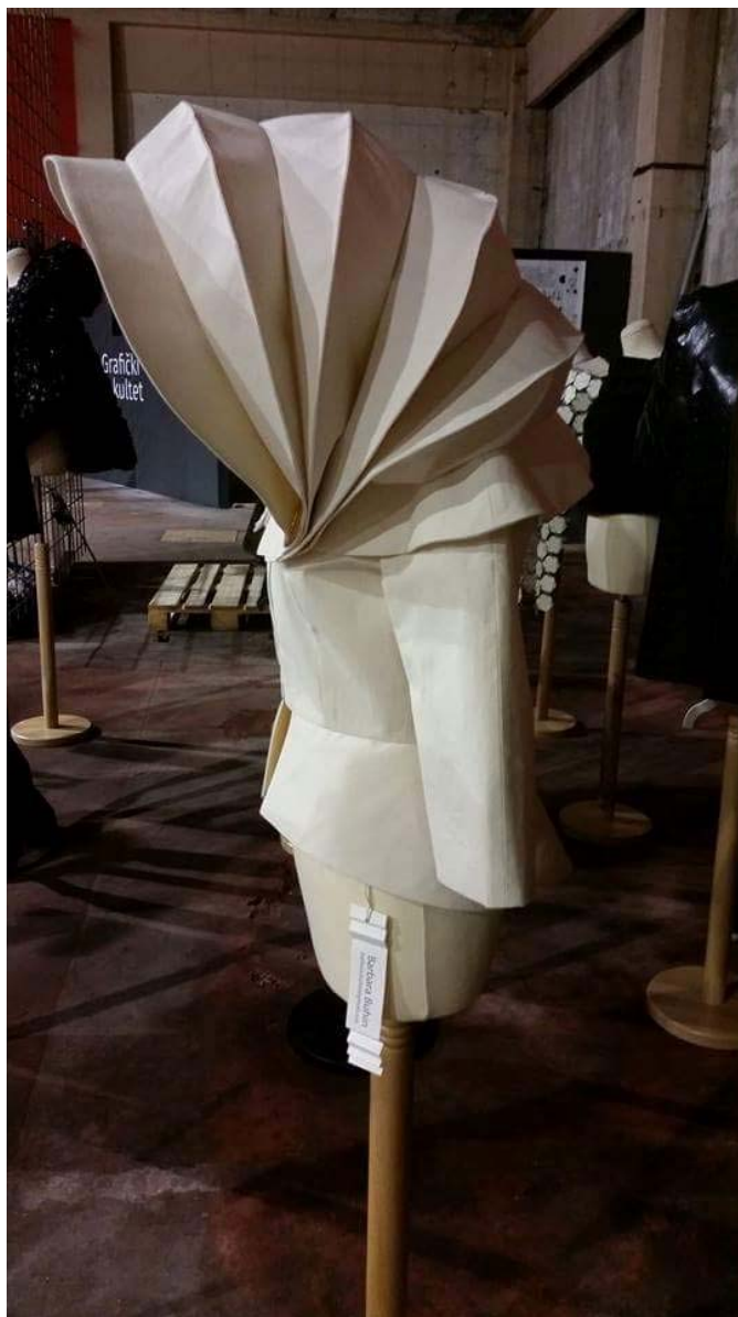
4.1.2. Fotografije kolekcije:

Materijali iz kojih bi izradila ostatak kolekcije i dalje bi bili prirodni, poput pamuka i svile uz rjeđe korištenje umjetnih materijala.