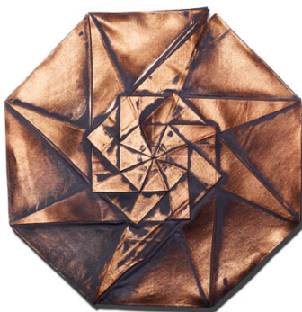
Slika 6: Primjer iz kolekcije „132 5. ISSEY MIYAKE“

Dizajneri često koketiraju s elementima origamija. Za ovaj dio istraživanja obilno sam koristila internet izvore te mnoge časopise.