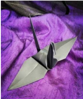
Slika 3: Origami ždral, autor: Barbara Buhin